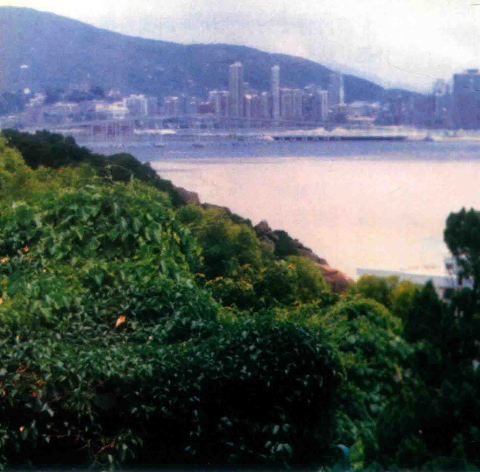
澳门半岛——澳门地区政治、经济、文化中心。