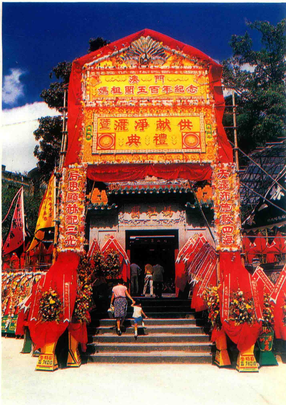
妈祖阁——澳门最古老的庙宇。葡萄牙人最早就是在妈祖阁附近登陆的。