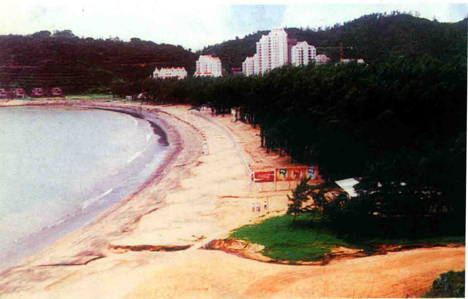
澳门的两个离岛凼仔（上图）、路环（下图）与澳门半岛有大桥及公路连接。岛上环境优美，空气清新，是休闲游乐的好去处。