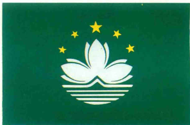
中华人民共和国澳门特别行政区区旗图案。