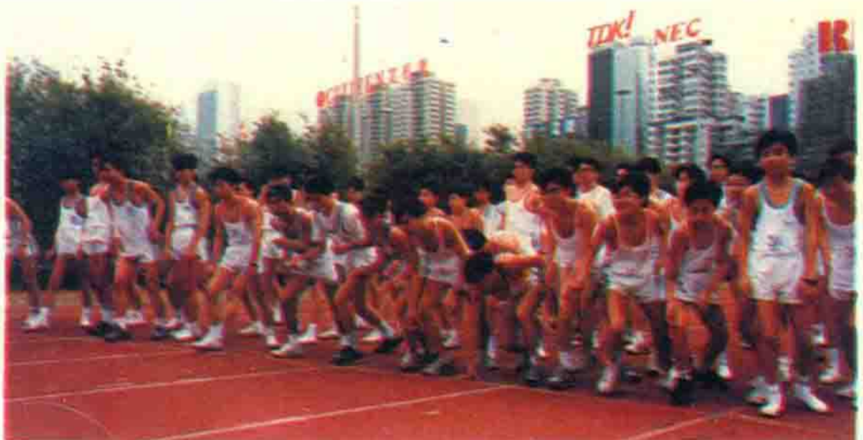
中学生 5000 米长跑活动