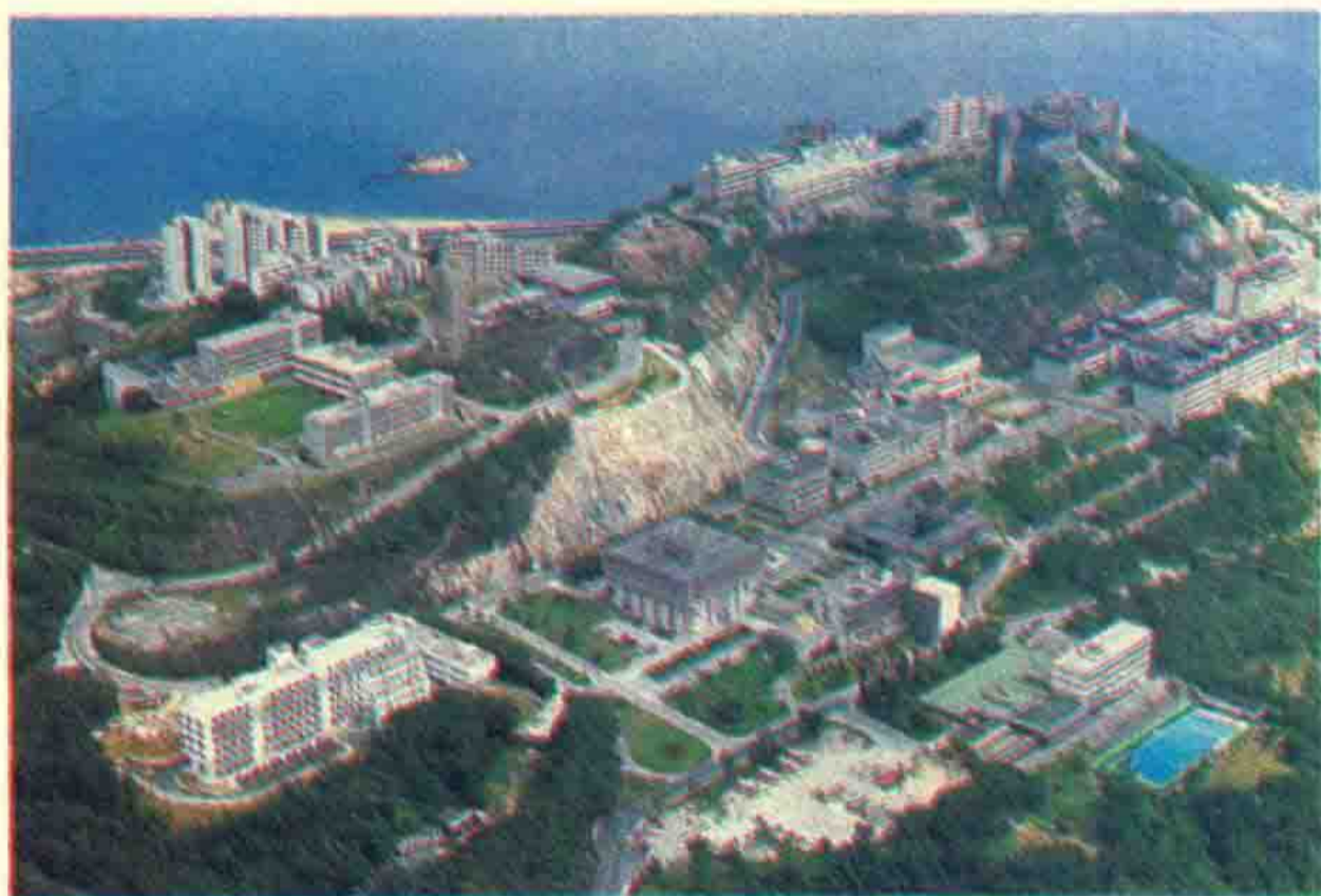
座落沙田的香港中文大学