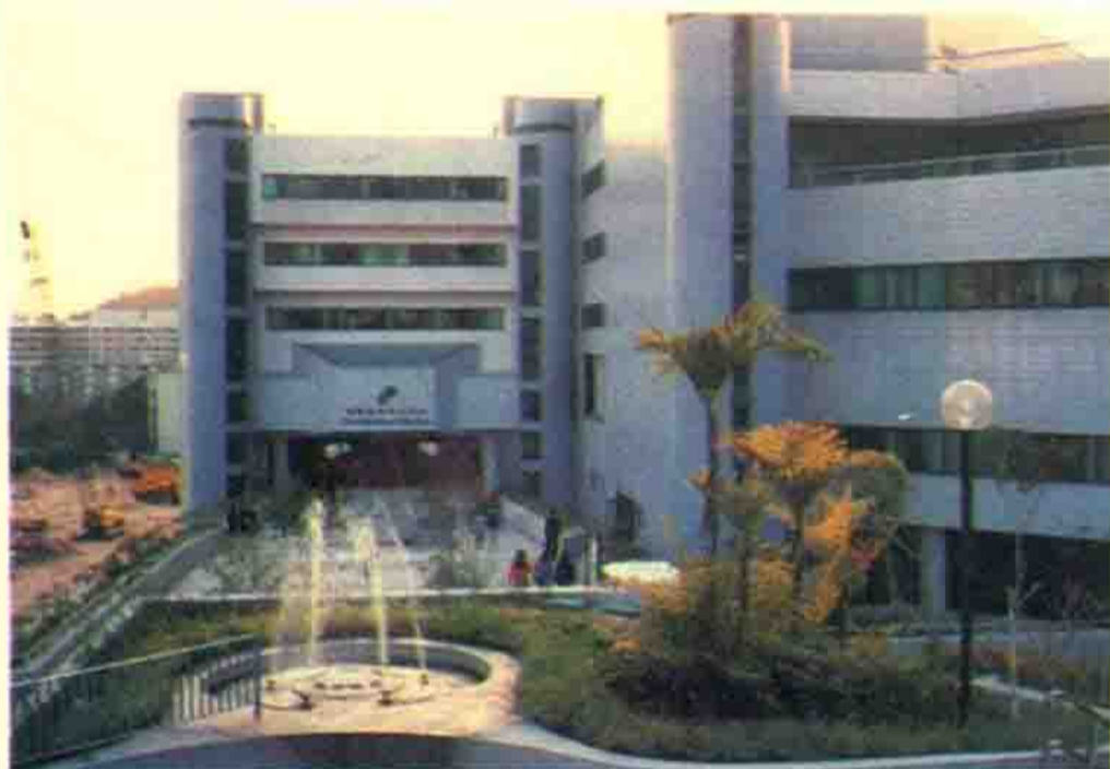
香港城市理工学院