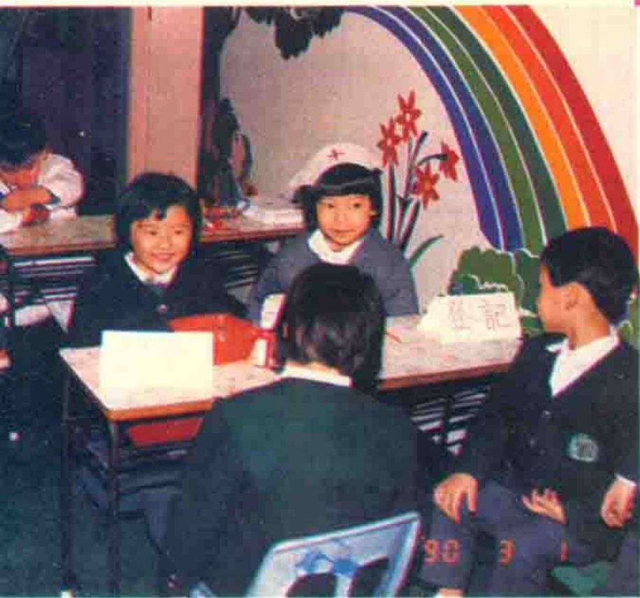
幼儿园摹擬活动： 医生和护士