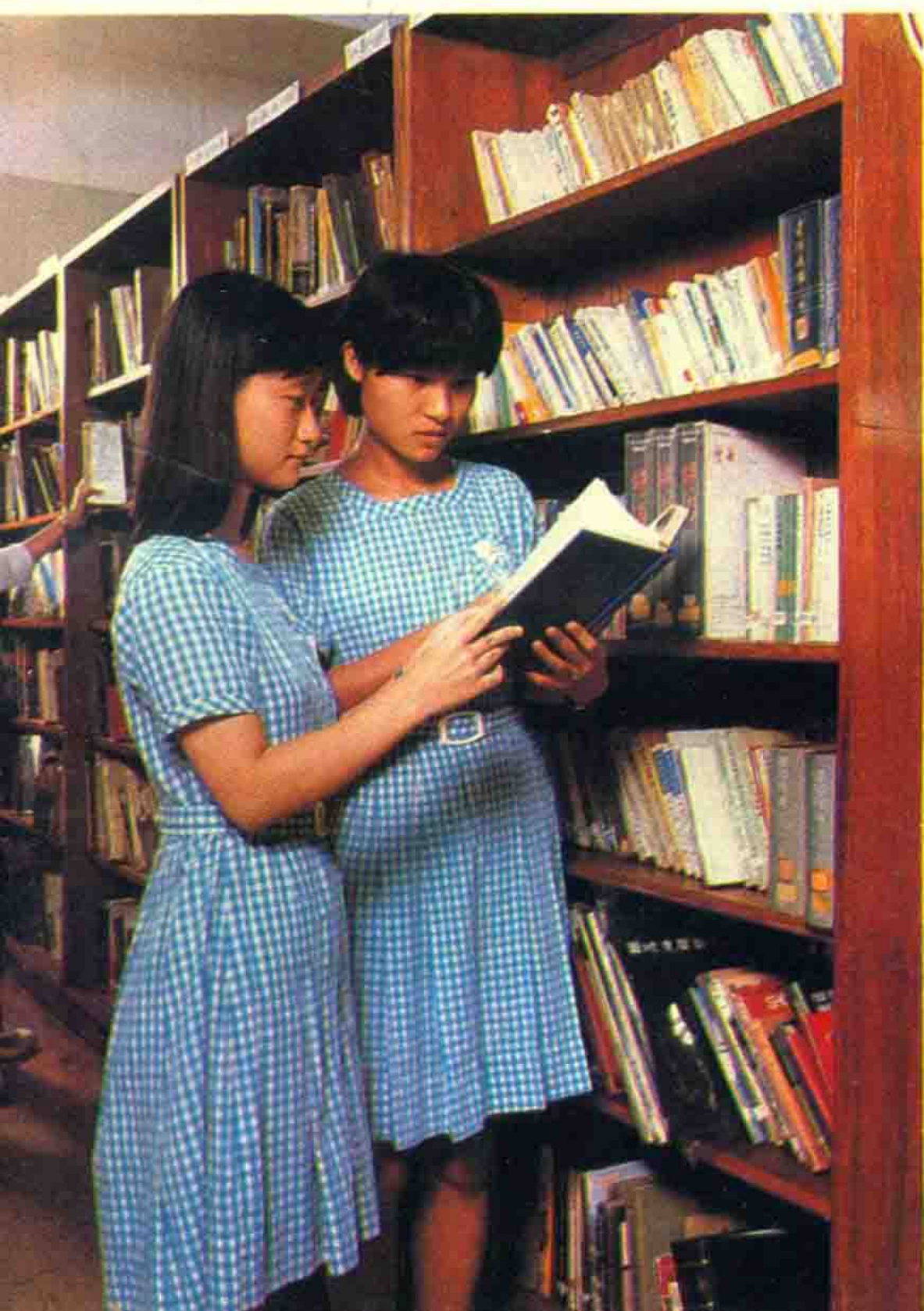
旺角一间政府中学的图书馆，藏书丰富，资料齐备。