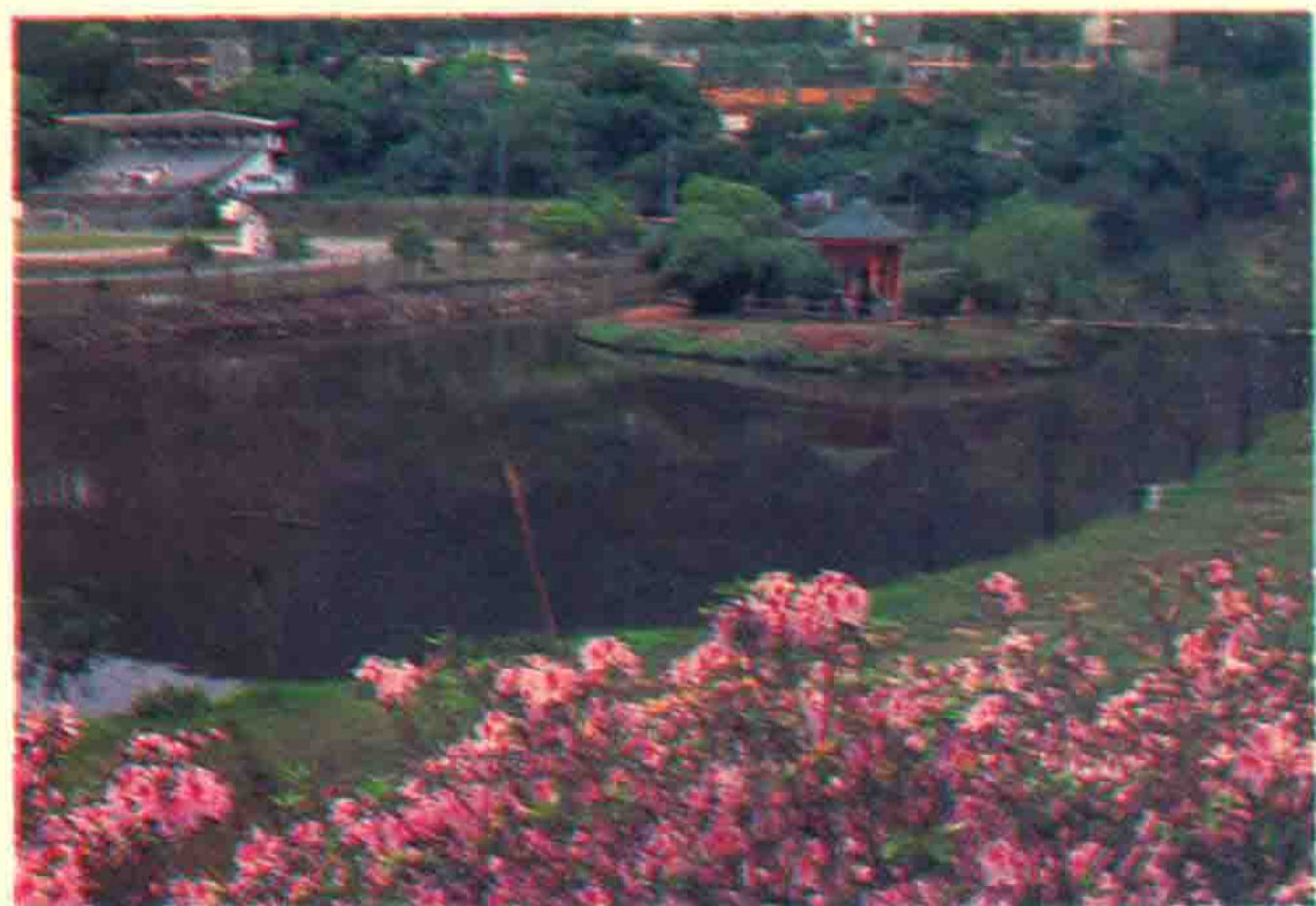
中文大学校园一角