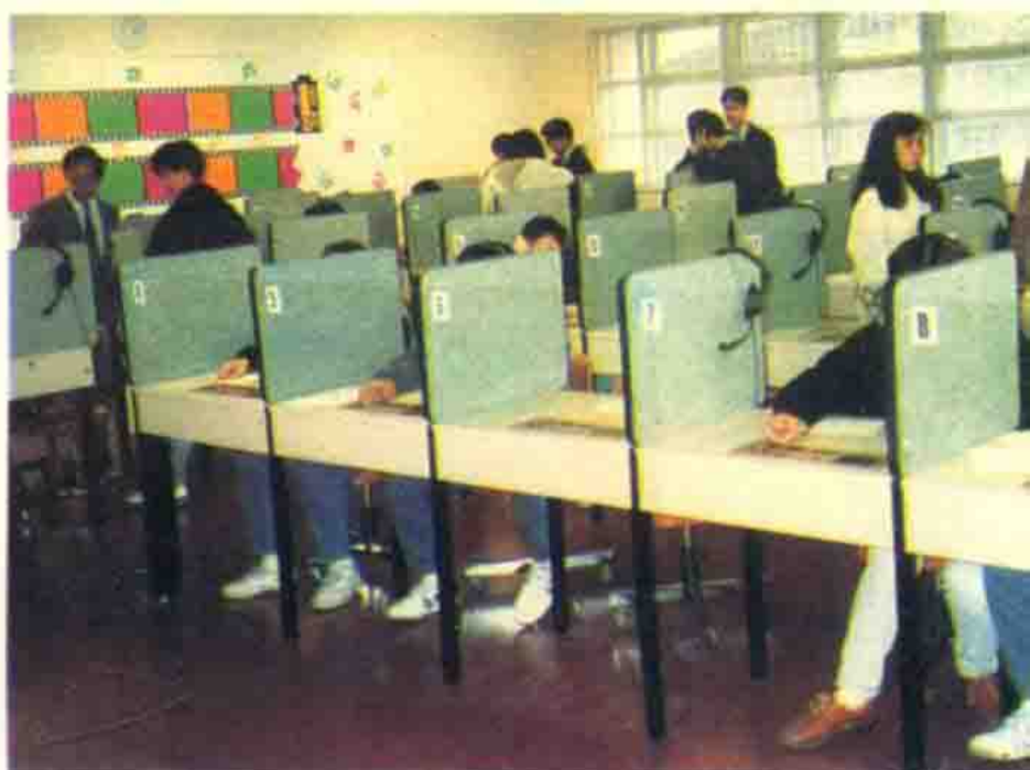
学生在语言实验室学