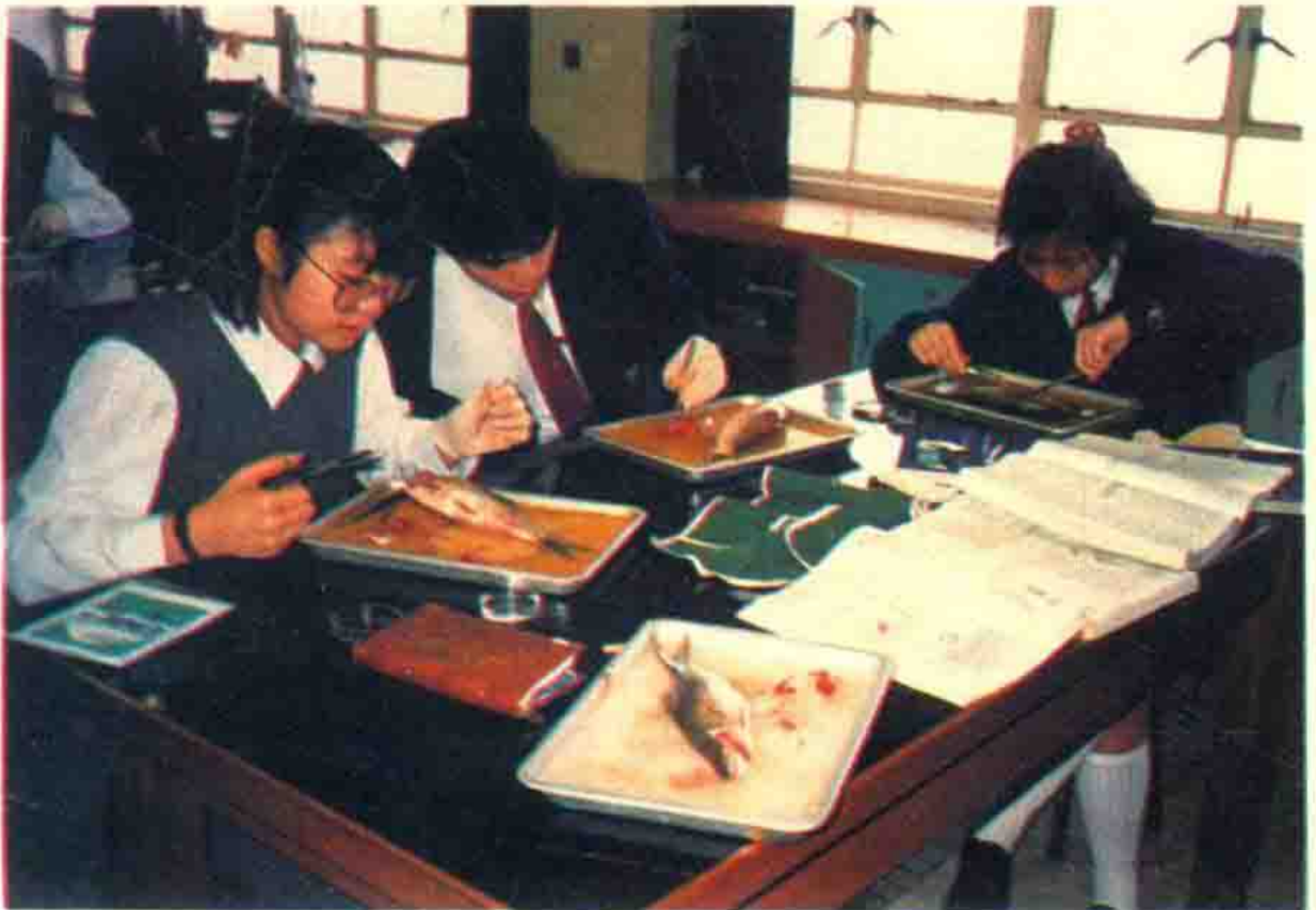
预科学生上生物实验课