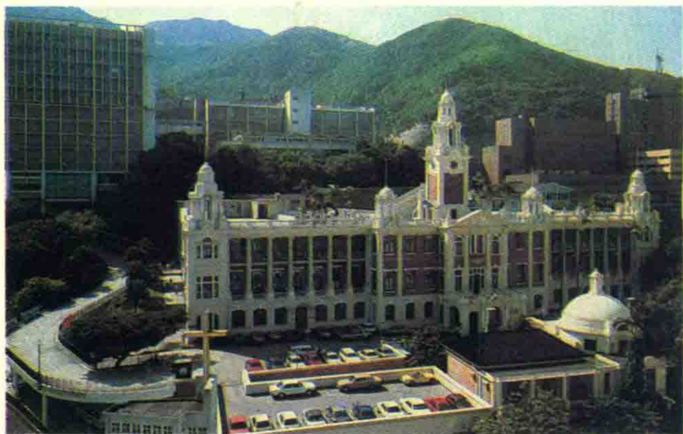
位于薄扶林道的香港大学