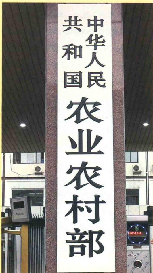
▶ 2018年4月3日，新组建的农业农村部正式挂牌。

雄安新区系列改革政策、扩大对外开放、乡村振兴等方面又推出一连串重大改革。例如，力度空前的党和国家机构改革中央层面的任务已在四个月时间内全部落实到位。总之，各方面改革任务正在按中央全面深化改革委员会确定的实施规划和年度工作要点稳步推进。