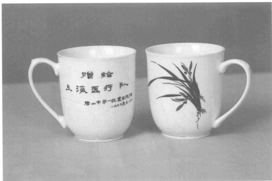
唐山贈送給上海醫療隊的紀念杯