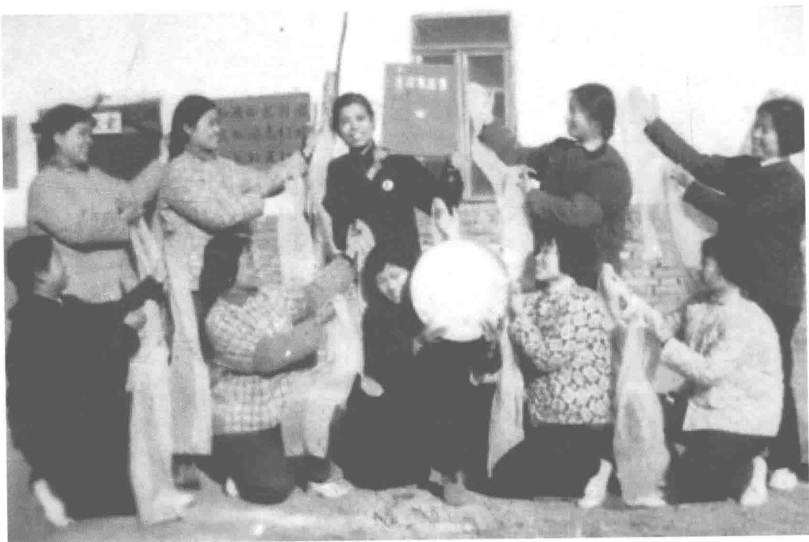
1977年元旦前夕，国妇婴第三批医疗队员表演“我们心中的红太阳”舞蹈