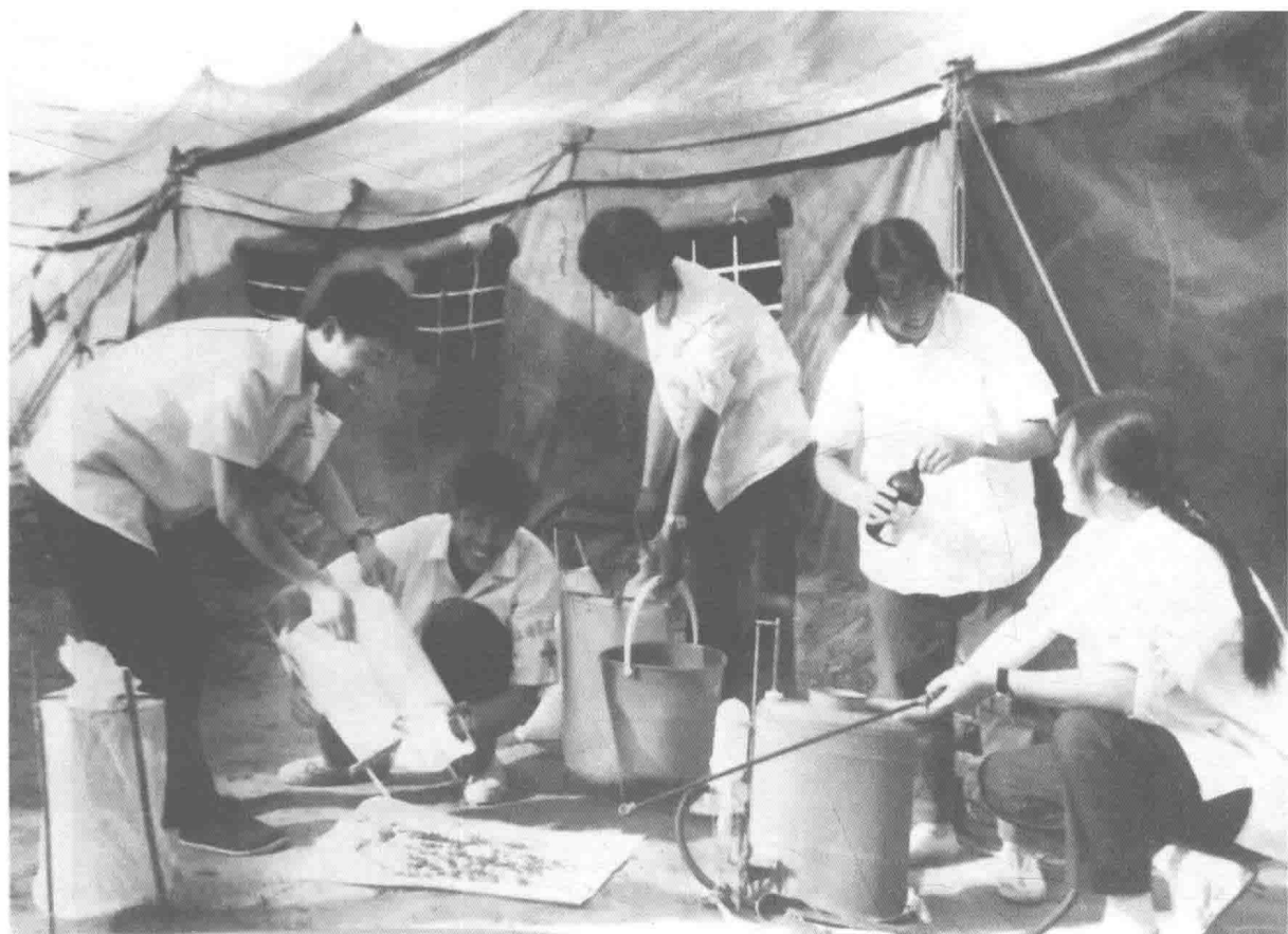
救援队打药消毒场景