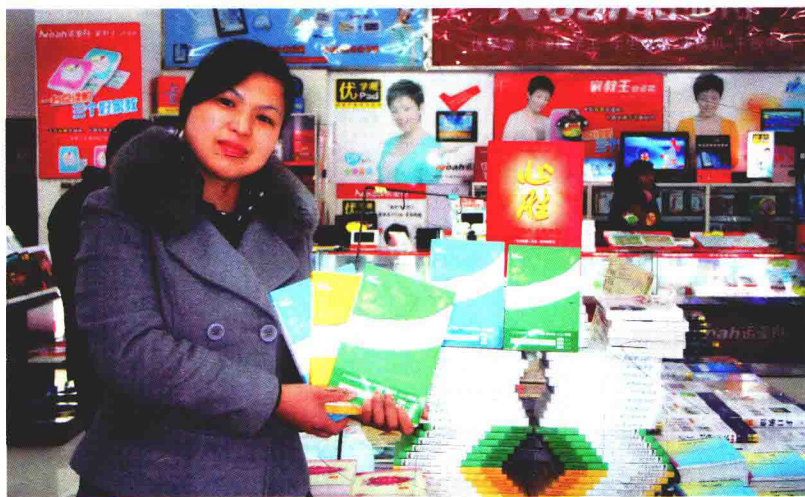
“我的书，我的孩子，我的教育，我的人生”