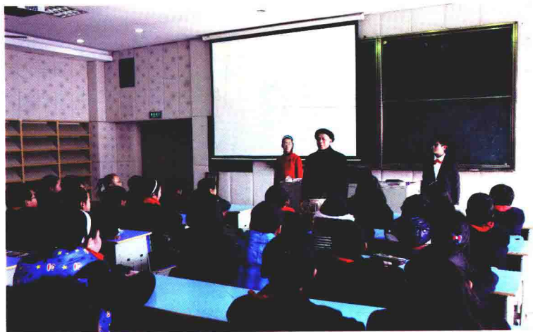
“感动班级年度人物”颁奖典礼