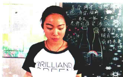
“孩子的成长是我最大的幸福”