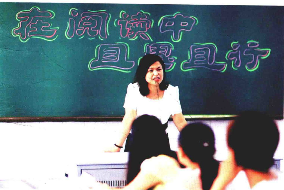
在阅读中且思且行