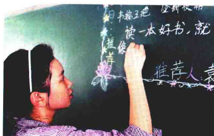
黑板上的“每日推荐”栏