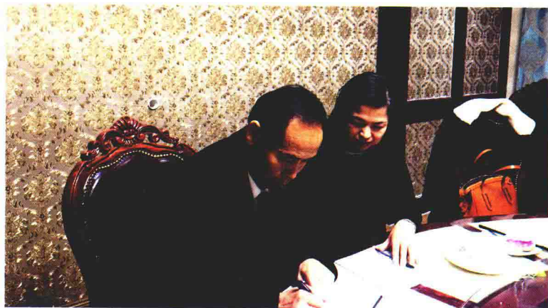
聆听教育家悉心教诲