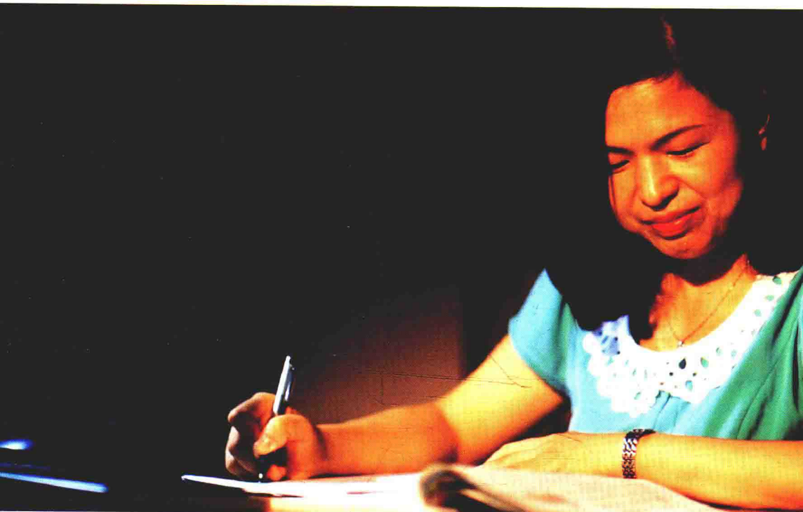
夜灯下，诞生几十万字的教育随笔