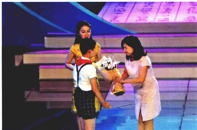
被聘为“教育大阅读导师”