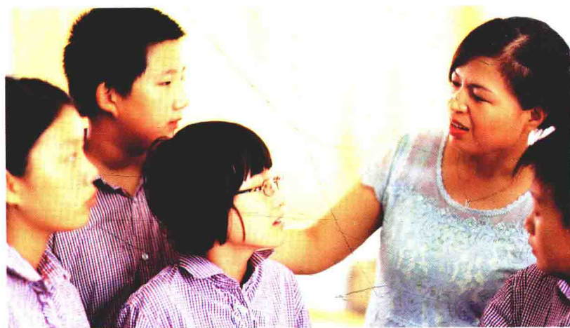
教育是一场“爱的供养”