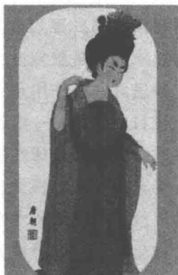
图 1-5 唐朝服饰