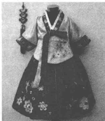
图 1-4 朝鲜族服饰

值观念和审美品位。服装设计的民族文化性包含演变性和继承性两方面。自黄帝垂衣裳而天下治以来,我国的衣冠礼仪一直为人们所遵从。直到封建社会末期,慈禧太后仍认为衣服的样式是祖宗定的,改习洋服是“大逆不道”的行径。然而,随着时代的发展和演变,传统的服饰已经不能为人们提供生活所需的便利,这就需要改变代代相传的穿着方式。社会环境的变迁使人们的审美情趣也发生了变化。唐朝以丰腴为美,衣着宽大、色彩明艳(图1-5);进入宋朝以后,经济稍显萧条,人们更加讲求婉约、清瘦之美,衣着风格合体而淡雅(图1-6)。从中不难看出,民族传统服装反映着不同的民族文化,同时反映着不同民族人们的情感愿望和审美追求。因此,服装设计也必须因时而变,满足现实社会的需求,提取民族文化中与现实符合的精华,但这并不是说要一味地模仿,而是要求在服装设计中有机的融合时代主题与民族元素。