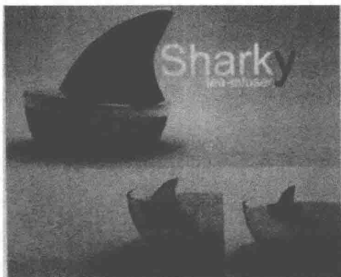
图 1-2 产品设计——泡茶器