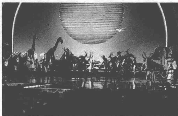
图 1-7 《狮子王》剧照

击力，包括舞蹈、音乐、服装设计、舞美设计等，但更为重要的是内容、题材、手段、形式的完美结合，正是这种完美组合所产生的艺术力量和魅力感动了创作者和观众（图 1-7）。