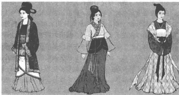
图 1-6 宋朝服饰