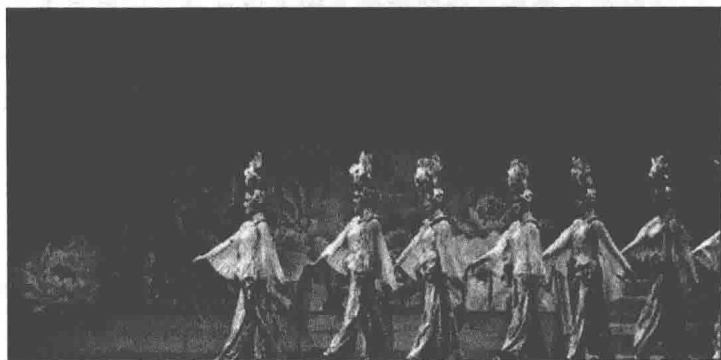
图 1-8 《金舞银饰》剧照