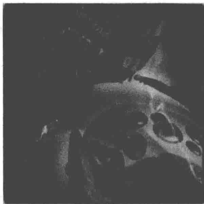
图 1-1 2013 IF 视觉传达设计获奖作品——Trafficshop