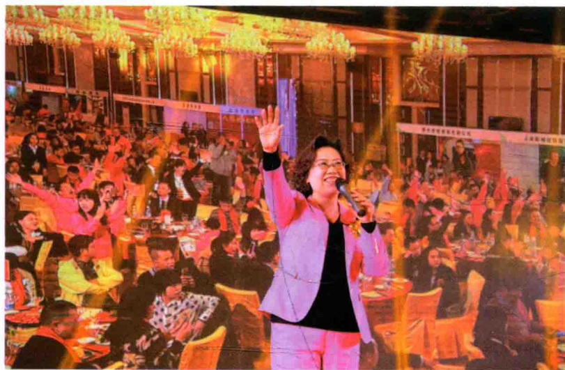
百加在 CFT 十三周年千人庆典致词