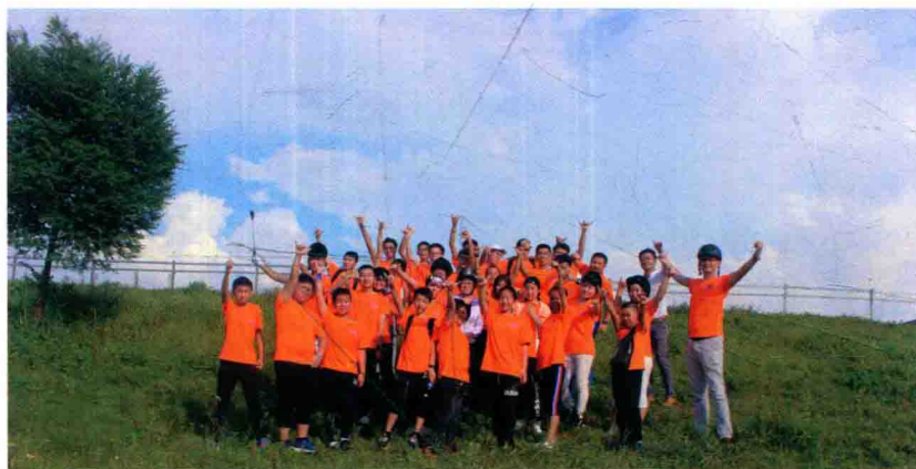
青少年领袖户外骑马体验活动