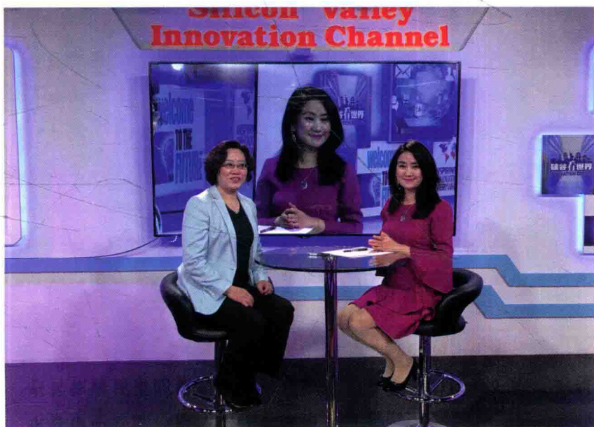
硅谷创新频道丁丁电视《硅谷看世界》现场专访百加