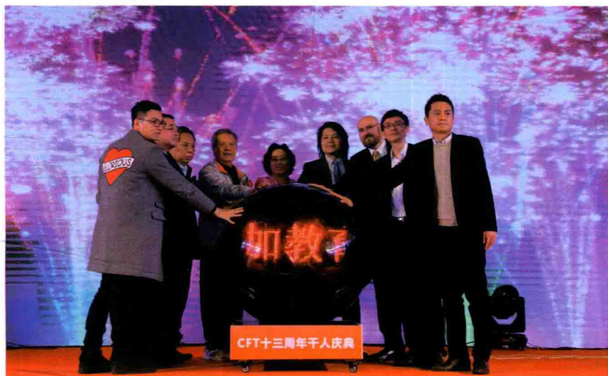
陈百加创始人与贵宾启动百加教育线上学院，正式成立百加教育发展基金