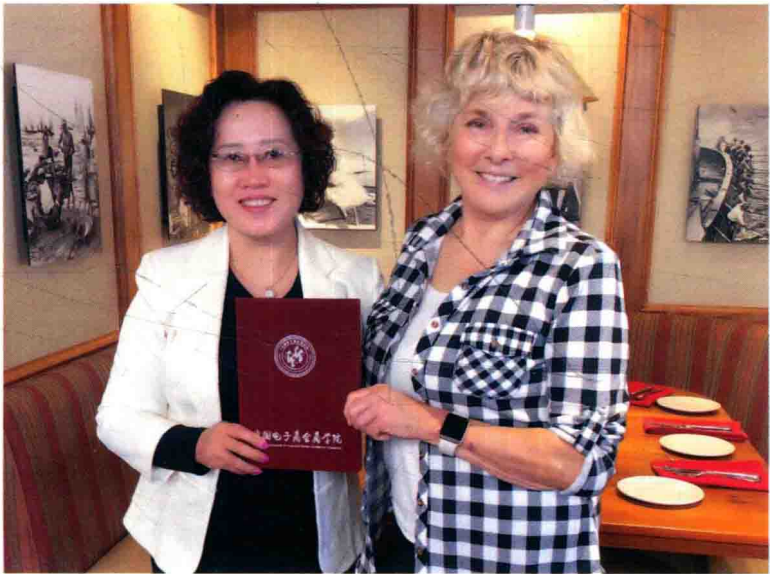
百加聘请《学习的革命》作者——珍妮特博士为中国电子商学院特聘教授