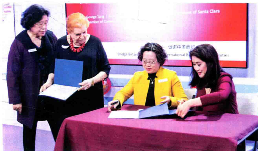
百加被聘请为美中硅谷商会广东筹备会会长