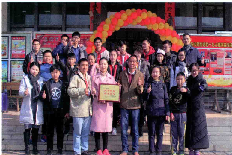
青少年领袖扶贫捐赠活动仪式