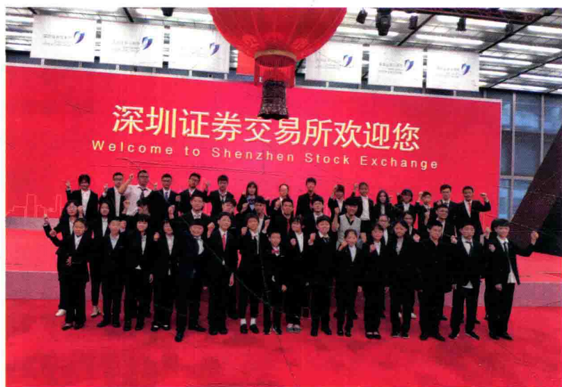
青少年领袖参观深圳证券交易所