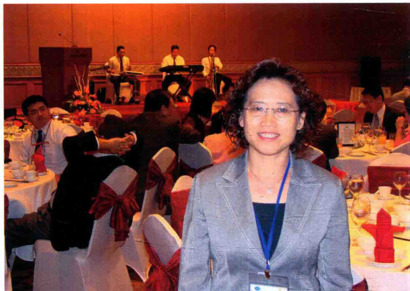
百加参加第十三届 APEC 部长会议