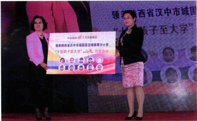
百加教育资助陕西省黄沙小学“十位孩子至大学”公益慈善活动