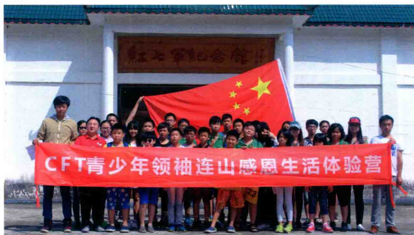
青少年领袖连山扶贫感恩体验营