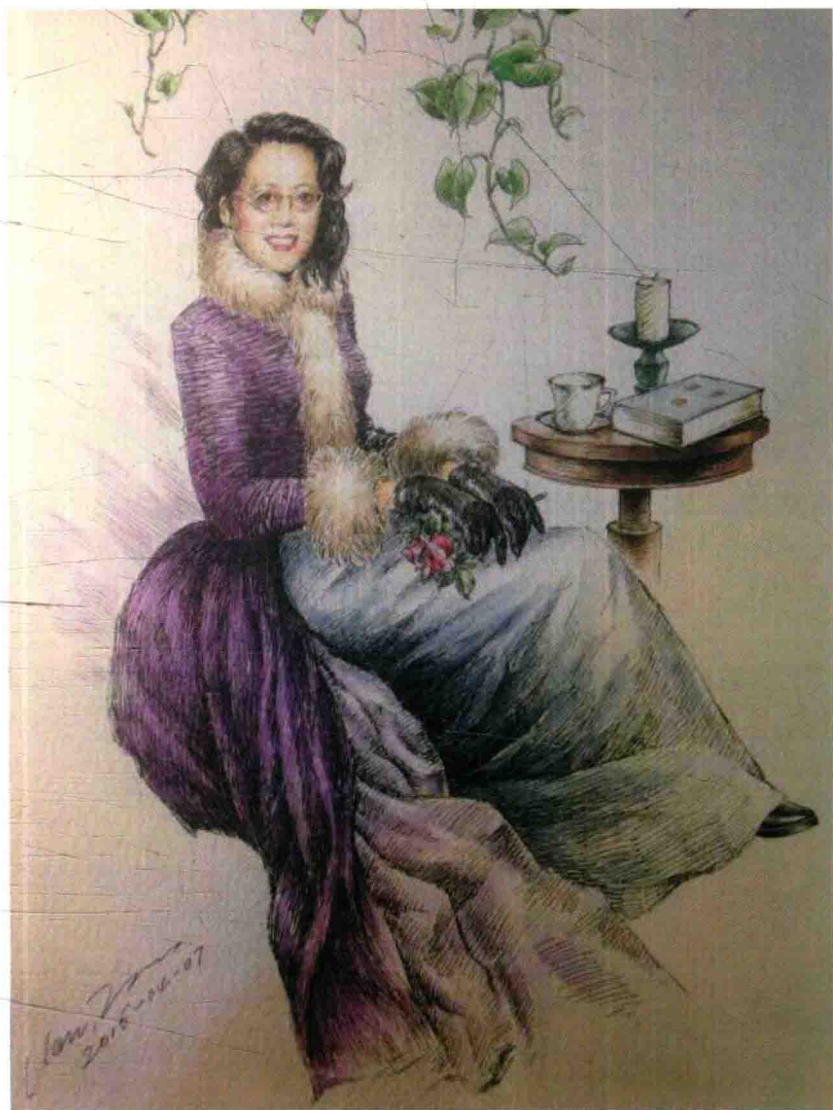
美国第一夫人及著名影星御用服装设计师 Ms.Law 亲自给百加定制肖像画