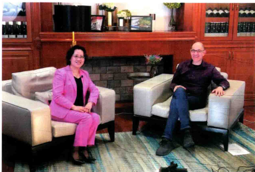
百加与孵化器 Founders Space 创始人、全球畅销书《让大象飞》作者史蒂文·霍夫曼进行家庭教育面对面访谈