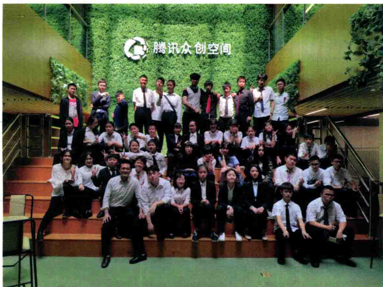
青少年领袖参观腾讯众创空间