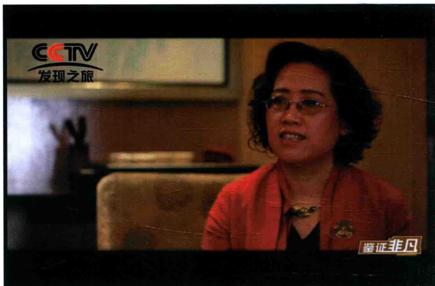
CCTV 发现之旅专访《百加教育梦》