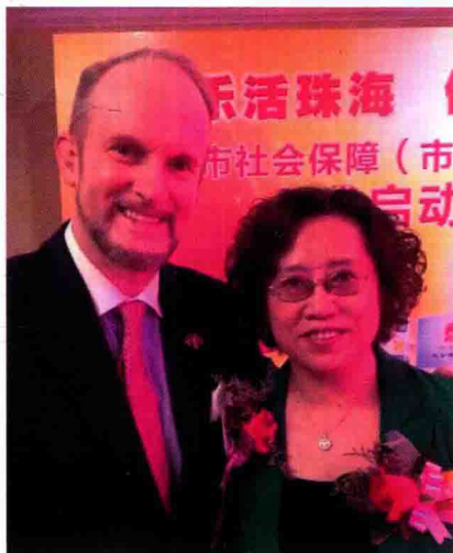
百加与 Google 前全球董事 史雷顿教授