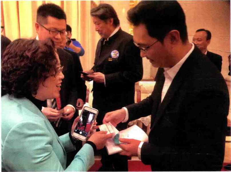
百加与腾讯董事长马化腾交流百加教育并交换名片