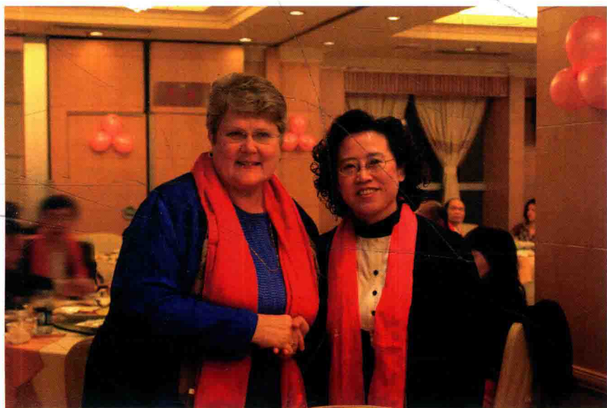
百加与中美交流协会爱德华州教育部长合影