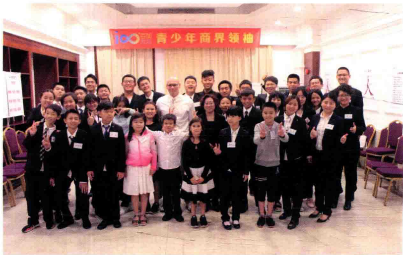
百加与青少年商界领袖学员