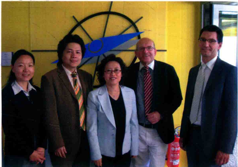
百加、摩西在德国考察 TEMP 公司