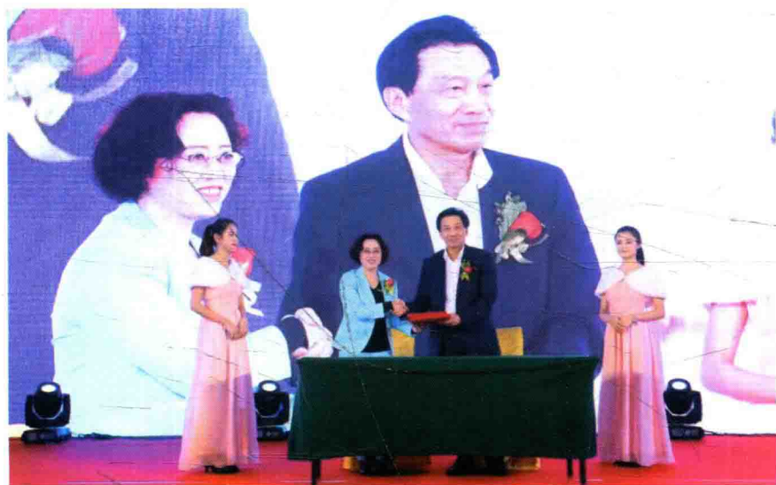
中国电子商会商学院聘请百加为副院长