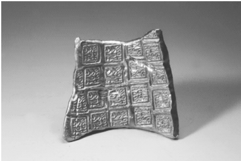
图 1-1 战国时期，楚国郢爰