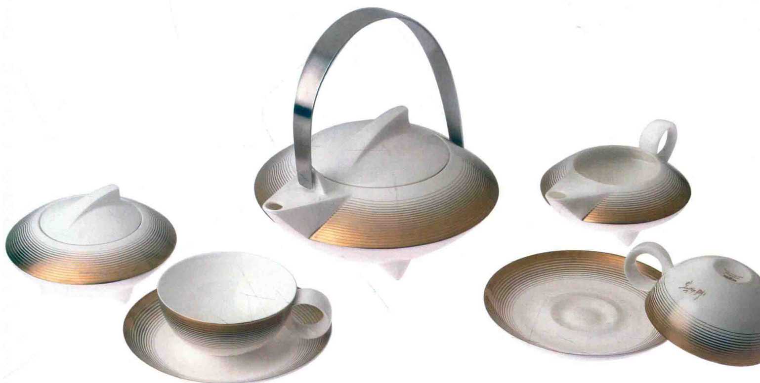
UFO 茶具 张守智