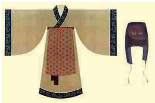
图 1-2 中国传统服饰汉服（二）