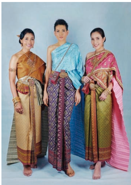
图 1-8 泰国女士纱笼