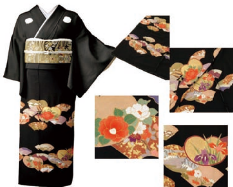
图 1-6 日式黑色传统和服

在中国唐代，随着遣唐使者进入日本，他们把中国的传统服饰也带入了日本。最初，仅仅是得到了达官贵族的青睐，后来这种具有大唐风韵的贵族服饰经过日本人的精美改造，呈现出别具一番韵味的视觉美感。其中，如把衣袖加长加宽、衣身加长、腰部束紧等，使人在穿着时紧贴衣身以体现人体的线条美。在经过这些改造设计后，日本人便将这种服饰确定为日本的民族服饰，即和服。