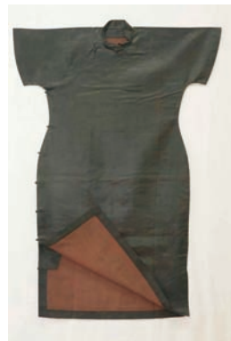
图 1-4 20 世纪 40 年代香云纱单旗袍