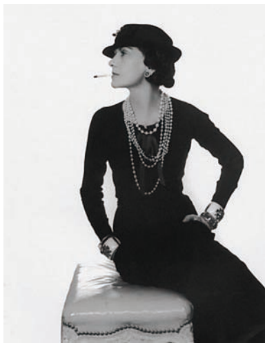
图 1-12 可可·香奈儿 (Coco Chanel)

1920 ~ 1939 年被称为“华丽的年代”，这个时期的西方服装达到了第一个高潮——出现了世界上第一位时装设计大师——可可·香奈儿 (Coco Chanel, 见图 1-12)。可可·香奈儿利用品牌为媒介，通过精致考究的设计，使时装成为社会的潮流。1930 ~ 1939 年期间，相继出现了另外一些讲究典雅风格的时装设计大师，如尼娜·里奇 (Nina Ricci)、阿利克斯·格理斯 (Alix Gres)、梅吉·罗夫 (Maggy Rouff)、马谢·罗查斯 (Marcel Rochas)、明·波切 (Main Bocher)、奥古斯塔·伯纳德 (Augusta Bernard)、路易斯·波澜吉 (Louise Boulanger) 等。在此期间，女性服装的改革核心从黑色上衣转变为宽大的白色上衣，与上一个十年形成鲜明的对比。值得一提的是，此时电影行业也开始有了突飞猛进的发展，并对当时的时装业产生了较大的影响，推动了整个时装产业的发展。