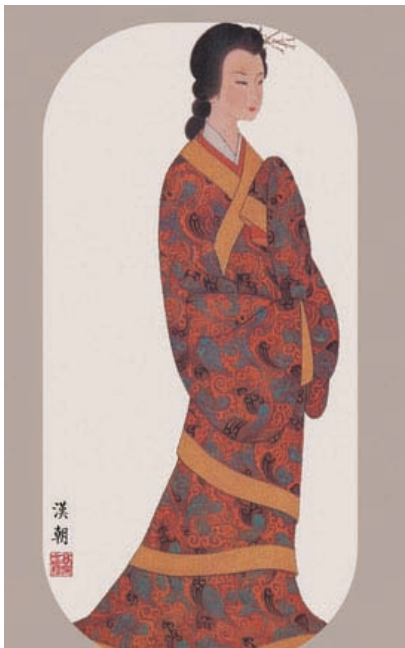
图 1-1 中国传统服饰汉服（一）

彩上，通常是以青、黄、赤、白、黑五色为主，其他间色为辅，有着庄重严肃、古朴大方的特点。同时，服装色彩的使用也有着严格的等级规范，象征着社会身份地位。由此可见，中国传统服饰完全展示了其中庸、矜持、重视礼仪的民族文化，也大大影响了其他东方国家的服饰文化发展。