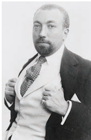
图1-10 保罗·布瓦列特(Paul Poiret)

西方时装起源于法国巴黎,1904年法国服装设计师保罗·布瓦列特(Paul Poiret,见图1-10)通过废除使用了接近200年的紧身胸衣,参照东方和古典欧洲风格的服装而设计出新的女装,并且定期推出自己的时装系列,成为世界上第一位具有现代意义的时装设计师。