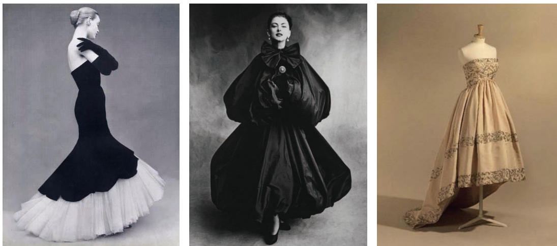
图 1-11 爱德华·莫林诺克斯 (Edward Molyneux) 代表作

1920 ~ 1939 年被称为“华丽的年代”，这个时期的西方服装达到了第一个高潮——出现了世界上第一位时装设计大师——可可·香奈儿 (Coco Chanel, 见图 1-12)。可可·香奈儿利用品牌为媒介，通过精致考究的设计，使时装成为社会的潮流。1930 ~ 1939 年期间，相继出现了另外一些讲究典雅风格的时装设计大师，如尼娜·里奇 (Nina Ricci)、阿利克斯·格理斯 (Alix Gres)、梅吉·罗夫 (Maggy Rouff)、马谢·罗查斯 (Marcel Rochas)、明·波切 (Main Bocher)、奥古斯塔·伯纳德 (Augusta Bernard)、路易斯·波澜吉 (Louise Boulanger) 等。在此期间，女性服装的改革核心从黑色上衣转变为宽大的白色上衣，与上一个十年形成鲜明的对比。值得一提的是，此时电影行业也开始有了突飞猛进的发展，并对当时的时装业产生了较大的影响，推动了整个时装产业的发展。