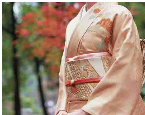
图 1-5 日式粉色传统和服