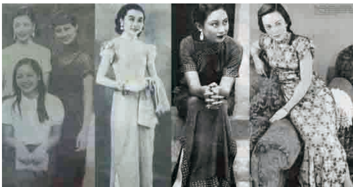
图 1-3 中式旗袍