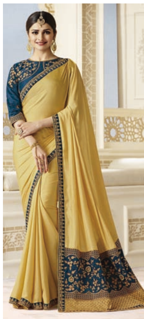
图 1-9 印度女士纱丽

阿拉伯传统男袍通常比较宽松，长及脚踝，男袍多为白色，也有其他浅色，但无深色。当地身份尊贵的男士，或者是在参加正式活动时，还要佩戴一种长可披肩的白色头巾，并在头顶加一圈环箍。阿拉伯男性在穿着传统长袍时，一律只穿拖鞋，且不穿袜子。这是由于阿拉伯国家特殊的地理位置，炎热的气候使得他们只能穿拖鞋。即使是在出席一些正式的重要场合中，他们的双脚也只穿皮拖。虽然长袍款式相近，但是阿拉伯男性穿着的白色长袍并非都是千篇一律的。