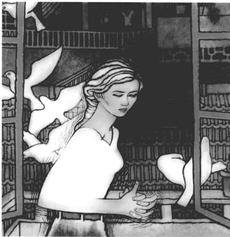
《五环世博》封面字稿 | 25.4x38cm | 2003 | 丝网版色