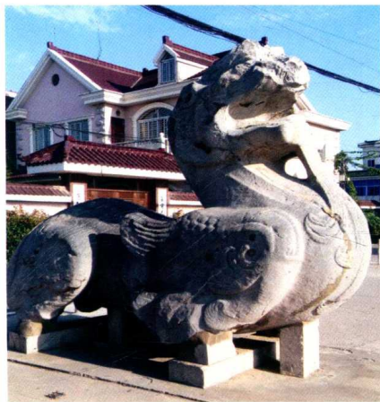
图 1 陵口石刻——天禄

从兴安陵向北走五十几米到建陵。县志载，建陵在县东北二十五里东城村（即现在的三城巷东城村）。建陵葬梁文帝萧顺之，是目前丹阳保存最为完好的南朝皇陵。顺之没有做过皇帝，是他的儿子萧衍当梁武帝后追封的。顺之在