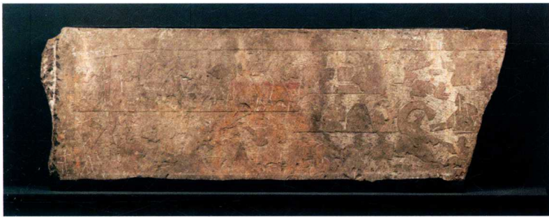
图2 歌舞、嬉戏和庖厨图