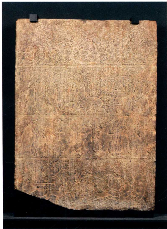
图4 西王母、周成王与孔子见老子图