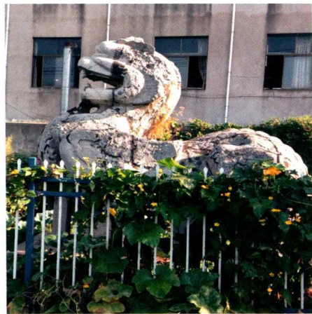
图 2 陵口石刻——麒麟