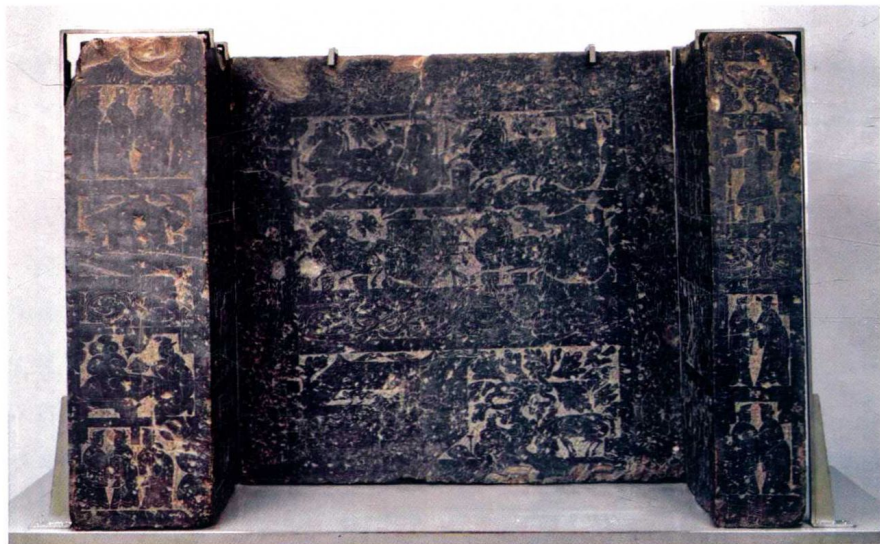
图 1 孝堂山下小石室画像石

东京帝室博物馆原先藏有画像石 10 块，第一石为《歌舞、嬉戏和庖厨图》，嘉祥隋家庄关庙出土，1908 年携至日本。与原保存在山东省立图书馆庚石为一块石头，现断为两节。（图 2）右为六博、长袖吹奏，左为庖厨，杀鱼宰鸡。第十石原为罗振玉藏，山东沂州出土，左端高浮雕羊头，右端为连弧纹和锯齿纹等装饰。（图 3）这与山东南部出土的羊首画像石没有多大差别。第四石到第九石，在嘉祥获得，均为内堀维文的藏石。关于内堀维文的藏石，大村西崖在《中国美术史雕塑篇》中讲述的非常