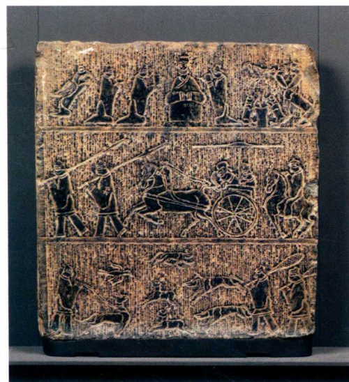
图5 西王母与狩猎图