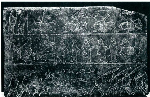
图13 胡汉战争与狩猎图