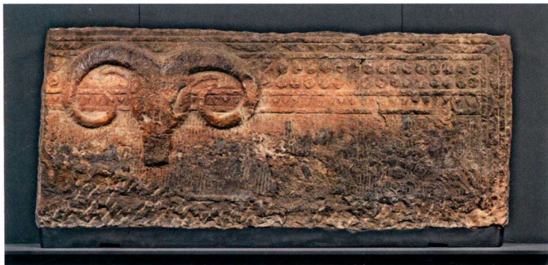
图3 羊头浮雕画像石