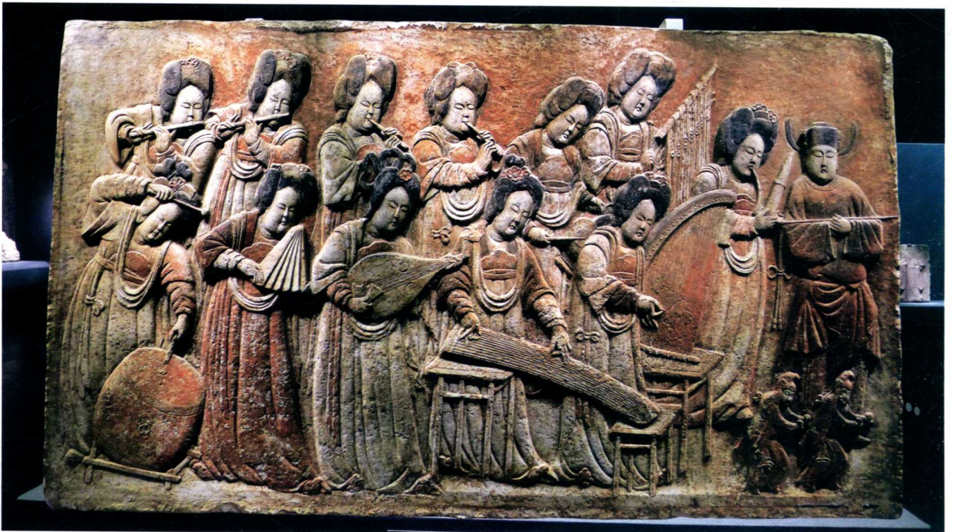
图2 王处直墓彩绘 奉侍图浮雕