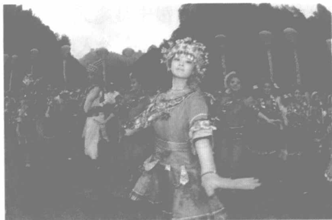
图 1-2 摆手舞