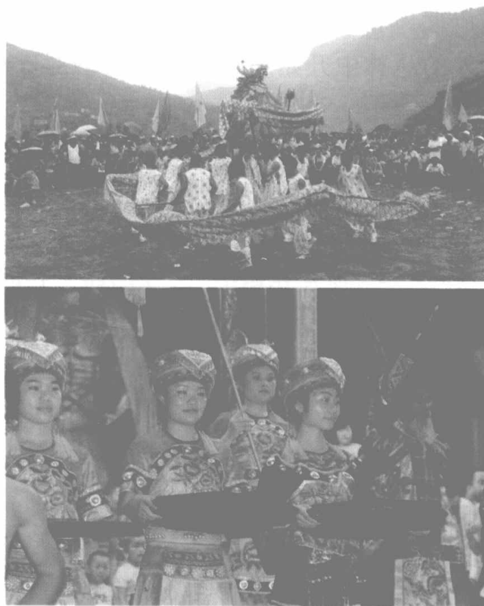
图 1-4 六月六习俗

说看,六月六是土家族的一个重要的纪念性节日。每年六月六日这天,家家户户晒衣服,晒棉被,晒鞋子,称为“六月六,晒龙袍”。一些地方的土家人在每年六月六要杀猪、打糍粑、做豆腐,把亲戚朋友请来欢度节日,举行以祭祀土王为主的摆手祭祖活动。