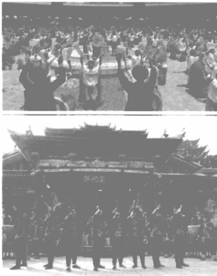
图 1-1 赶年

从腊月除夕吃到新年正月上旬,寓意连年有余。饭后,给家禽家畜、果树喂米饭“过年”,以求五谷丰登、六畜兴旺、瓜果丰硕。过年一定要在自家“守岁”,夜晚,山寨万家灯火,火膛里大火熊熊,一家老小围着火膛取暖,“守岁”到天明。鸡叫头遍,抢先到院坝燃放烟花爆竹,名为“抢年”,有的地方称之为“出天行”,看谁放第一声爆竹,谁来年就会风调雨顺五谷丰登。