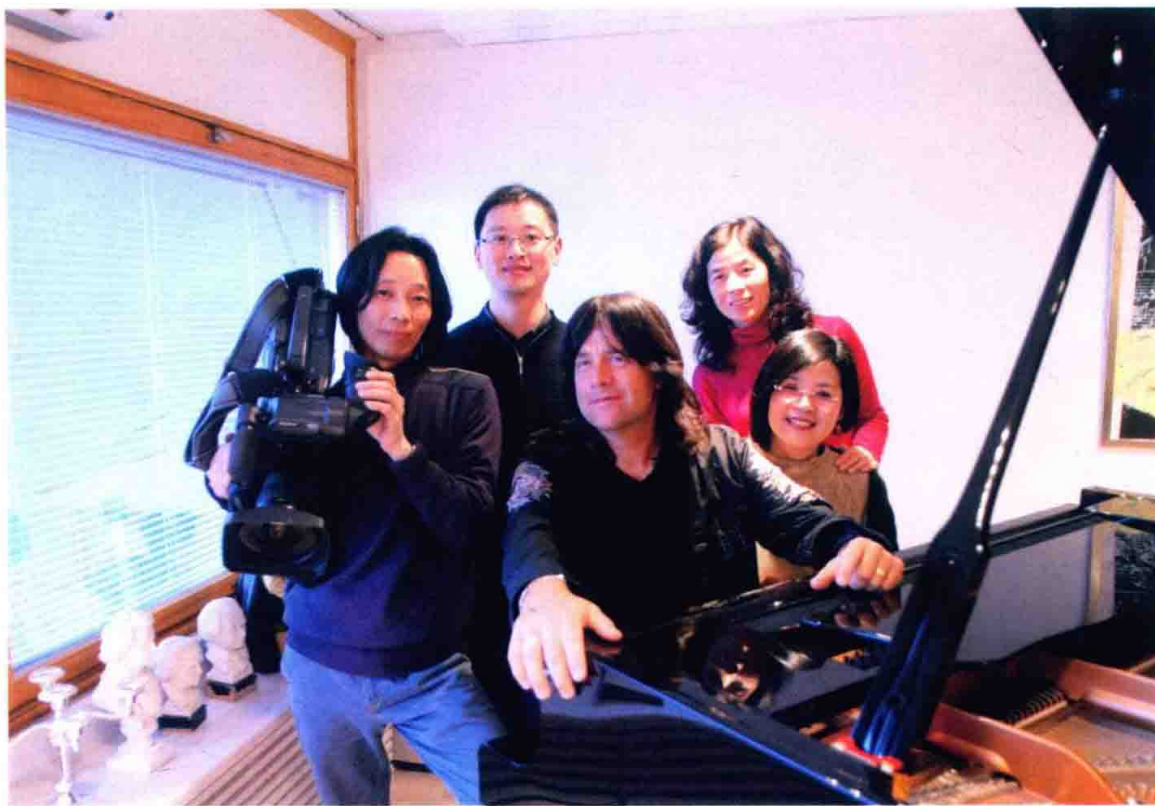
《世博零距离》摄制组与瑞典著名音乐家罗伯特·威尔斯合影

系列片《世博零距离》。《世博零距离》是浙江卫视与瑞典 TV4 集团首度合作完成的电视系列片，影片紧扣 2010 年上海世博会“城市，让生活更美好”这一主题，用历史纵向的线索，展示世博历史的发展和人类文明的进程；而在横向的空间里，则以中国、瑞典、英国、法国、德国等不同国度的城市里同步发生的世博筹办事件为叙事点，挖掘其背后的精彩故事，深度阐释上海世博会各国家馆的设计理念和主题，表达民众和社会各界对上海世博会的期盼，用影像书写了世界各国人民对城市生活的体会和对城市未来的思考。