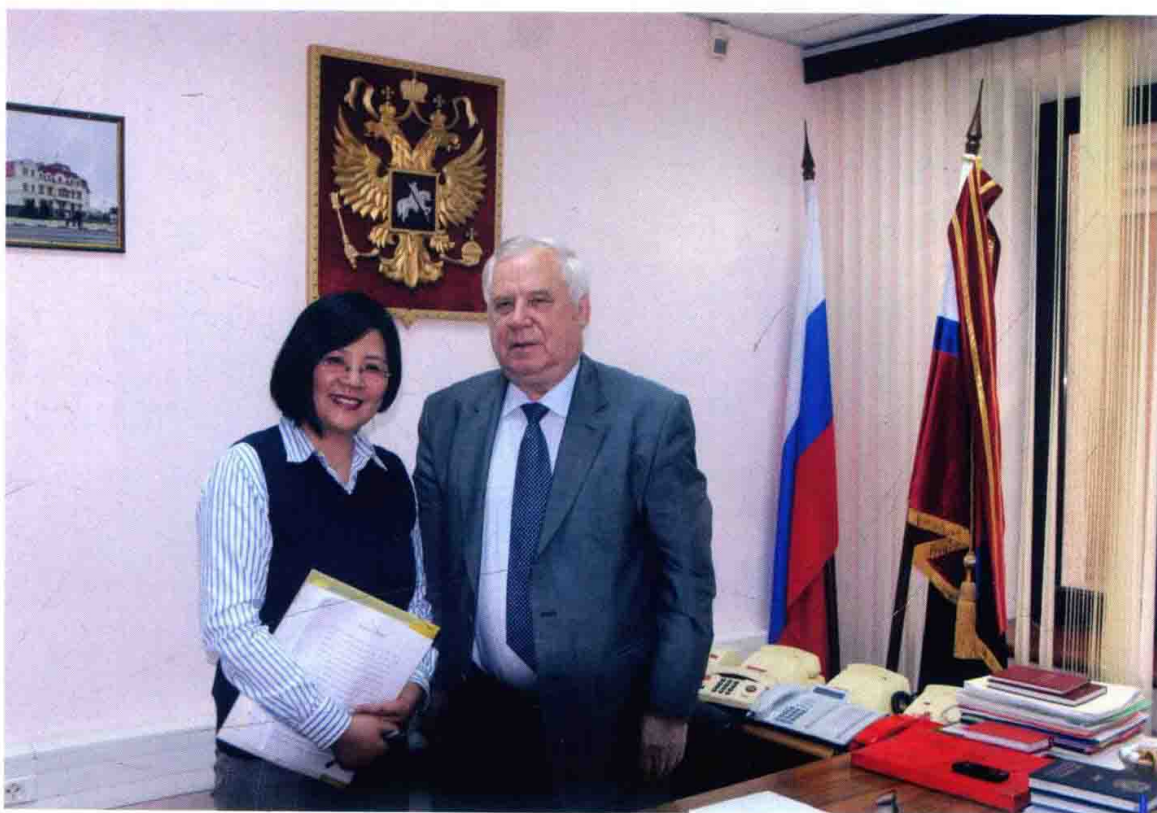
与原苏联部长会议主席雷日科夫合影