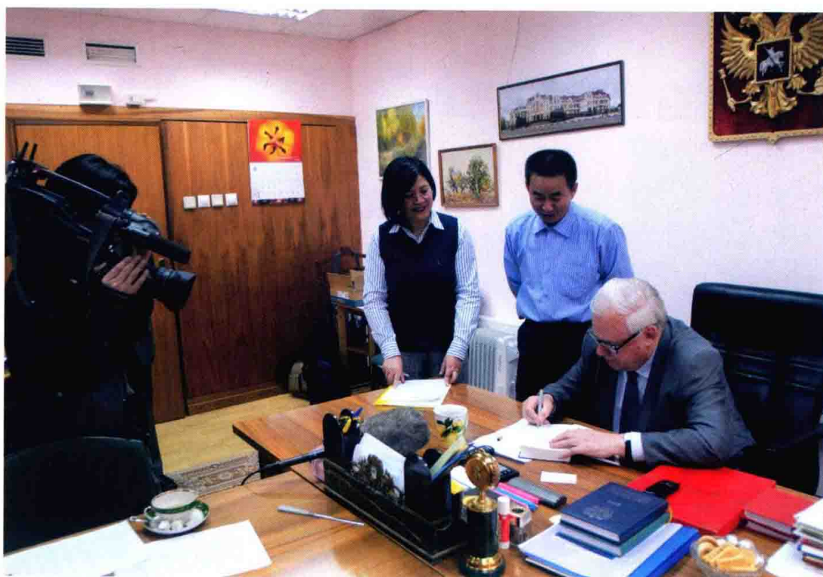
原苏联部长会议主席雷日科夫为摄制组签名留念