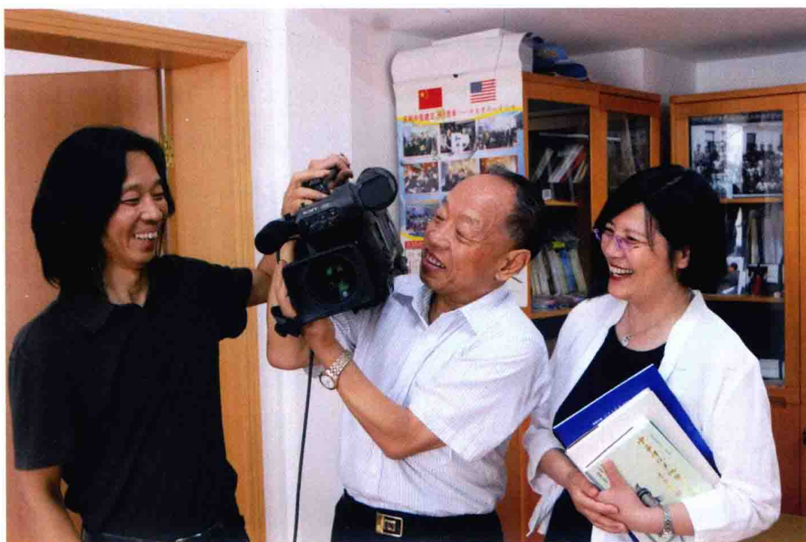
采访外交部原部长李肇星的间隙