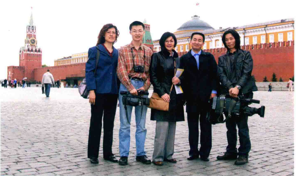
摄制组在莫斯科红场合影