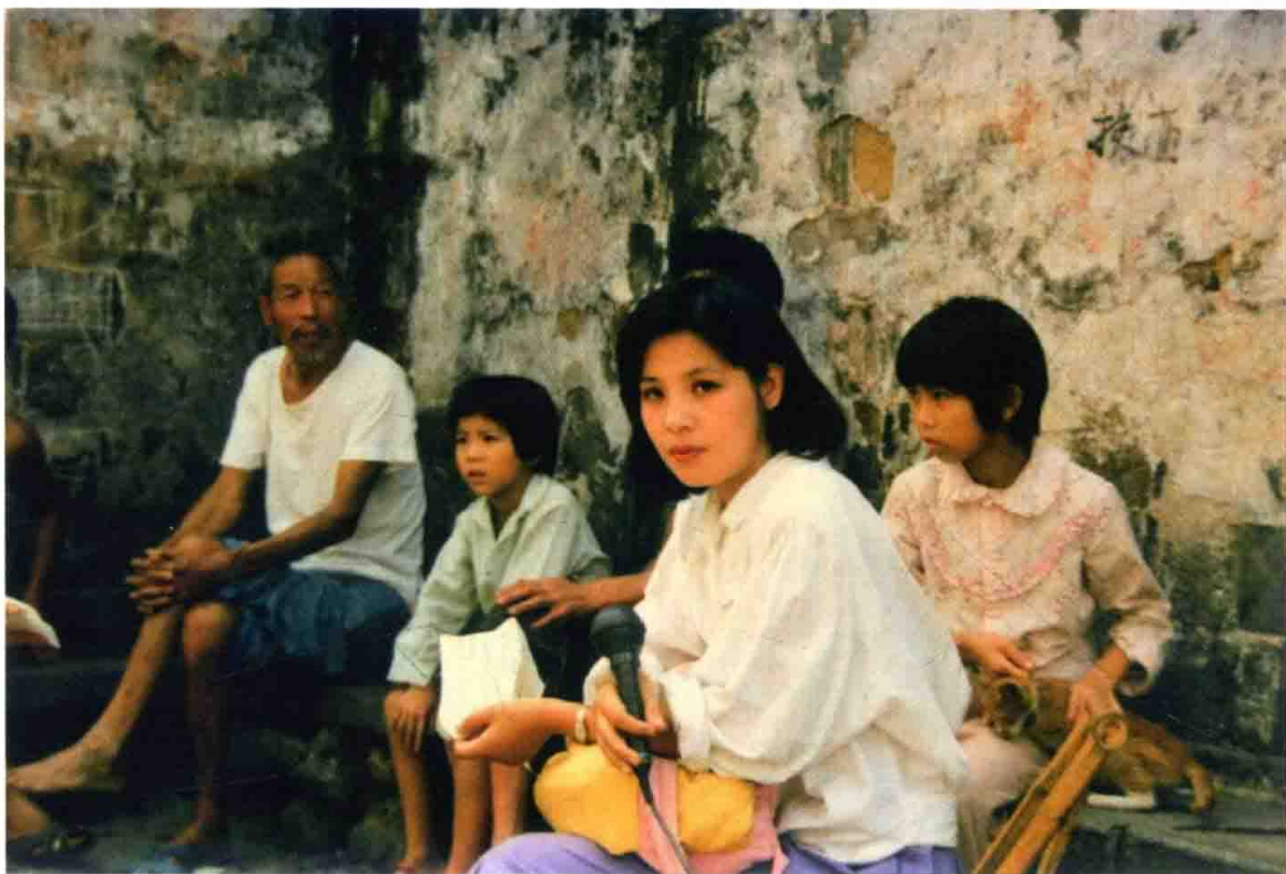
在浙江富阳农村采访

我的梦想，并不是当导演，而是做演员。18岁那年，我的同学有些考上了北京电影学院、解放军艺术学院和中央戏剧学院表演系，他们正在实现明星梦的道路上前行。我很是羡慕，也想去报考，可是我的军人父亲并不赞同。几经挣扎，最后我屈服了。我见不得父亲失望的眼神。