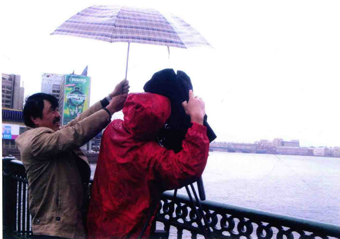
在莫斯科街头拍摄