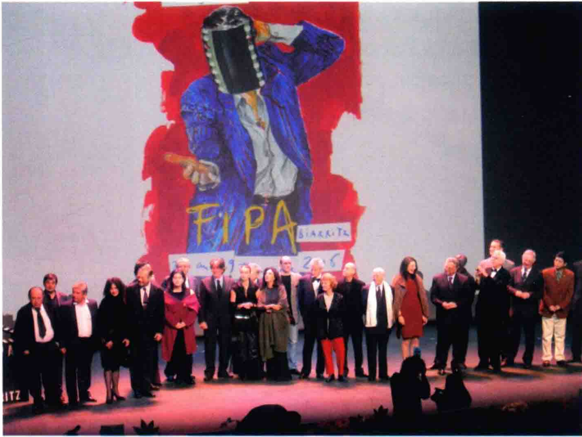
参加 2006 年法国国际试听影视节 ( FIPA )