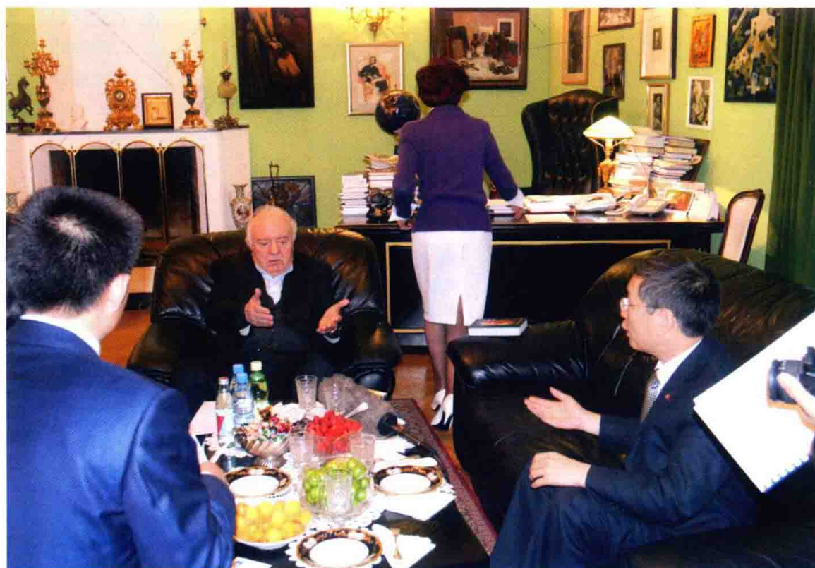
采访谢瓦尔德纳泽现场