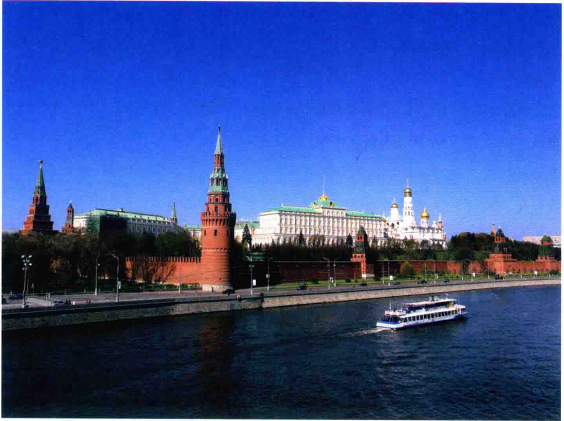
莫斯科河畔的克里姆林宫