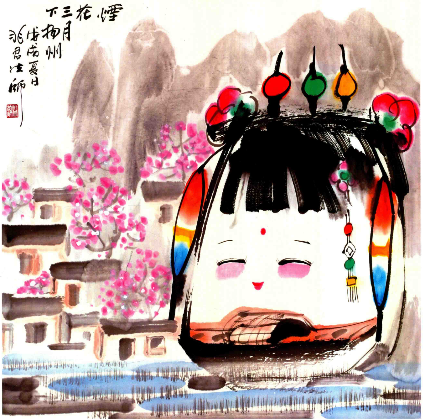
© 烟花三月下扬州 2018年 纸本设色 67cm × 67cm