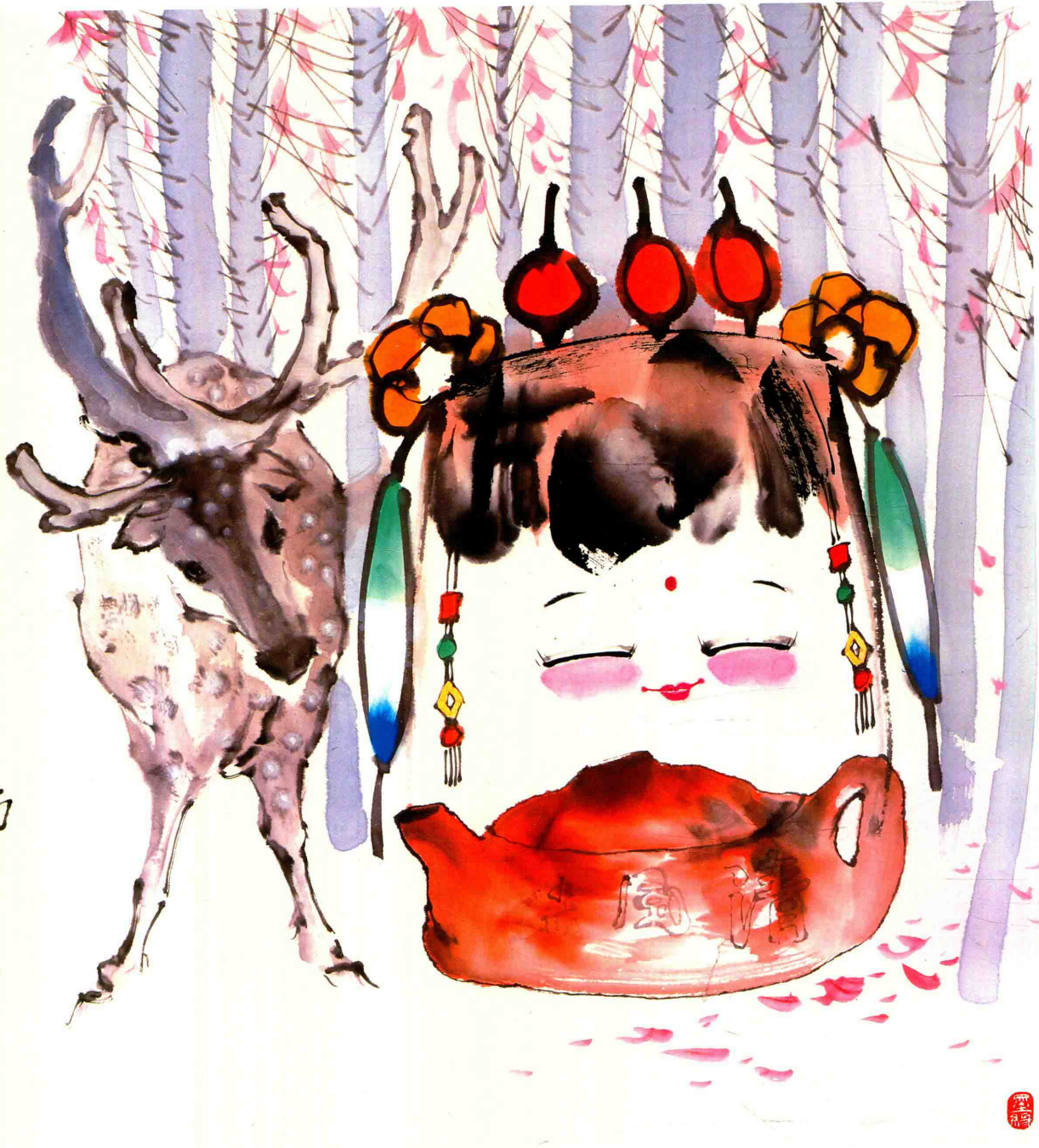
© 童梦北国 2018年 纸本设色 67cm × 67cm