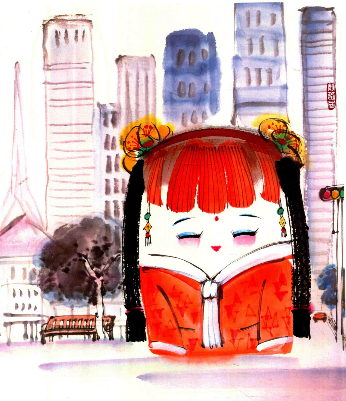
© 都市印象 2018年 纸本设色 67cm × 67cm