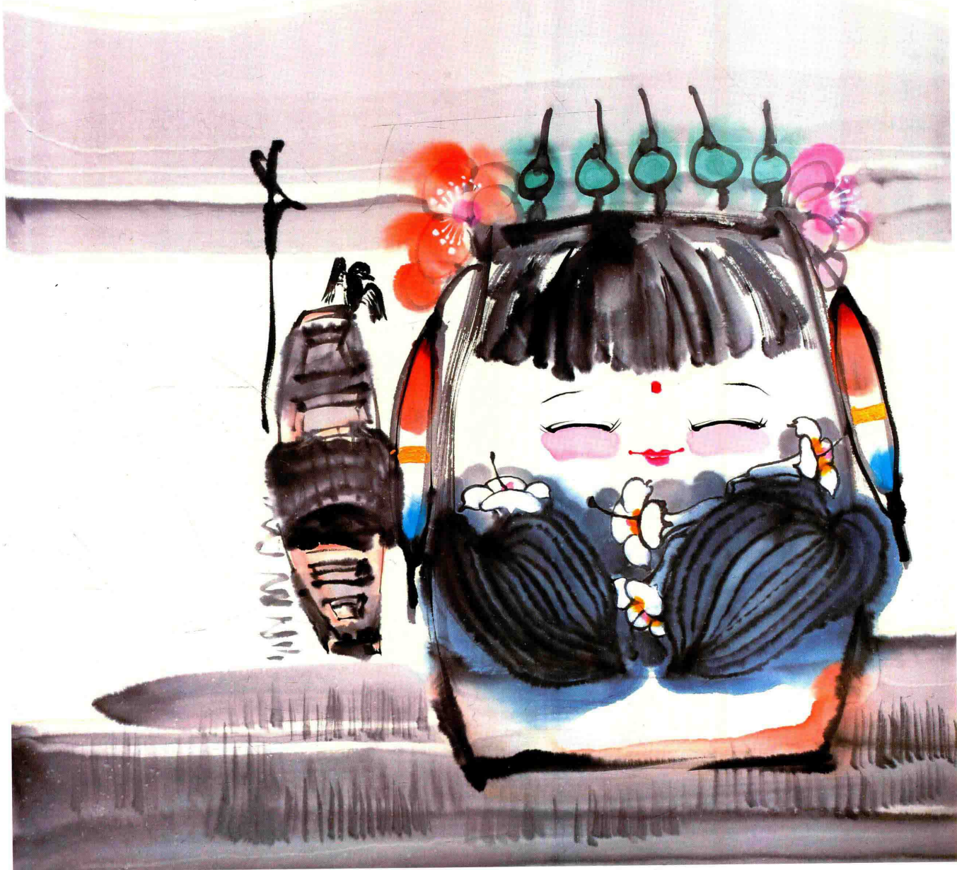
◎ 故乡的小河 2018年 纸本设色 67cm × 67cm