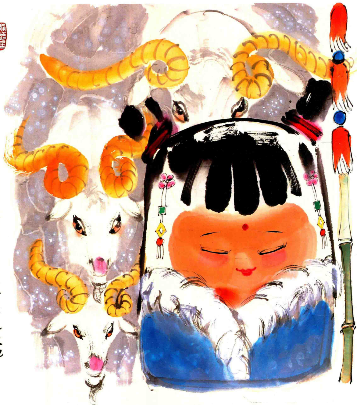
◎ 三羊开泰 2018年 纸本设色 67cm × 67cm