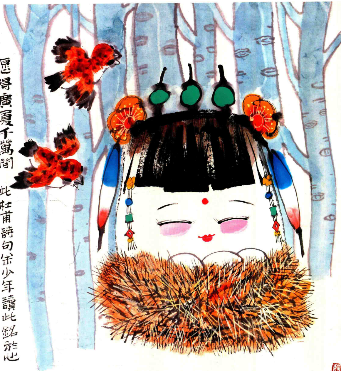
© 家 2018年 纸本设色 67cm × 67cm