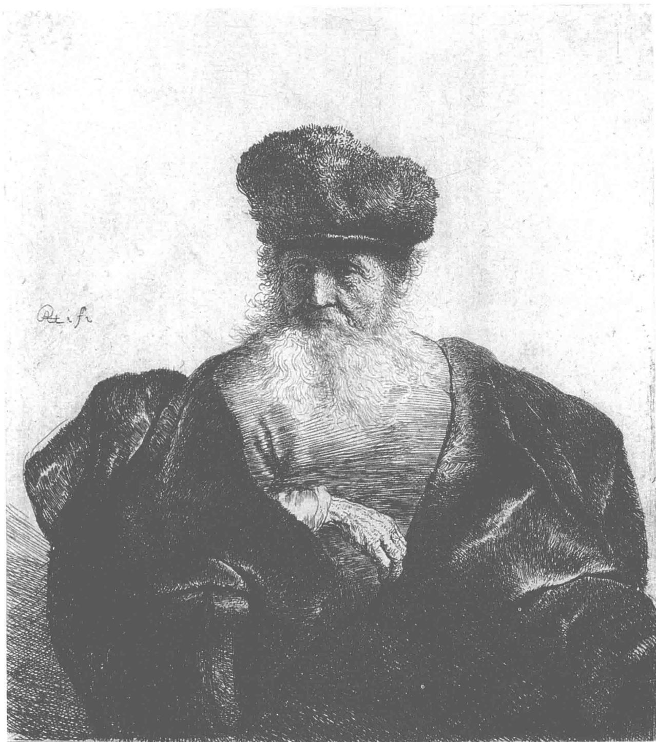
戴皮帽、穿天鹅绒大衣的有胡须的老人 约1632年 14.6cm × 12.8cm