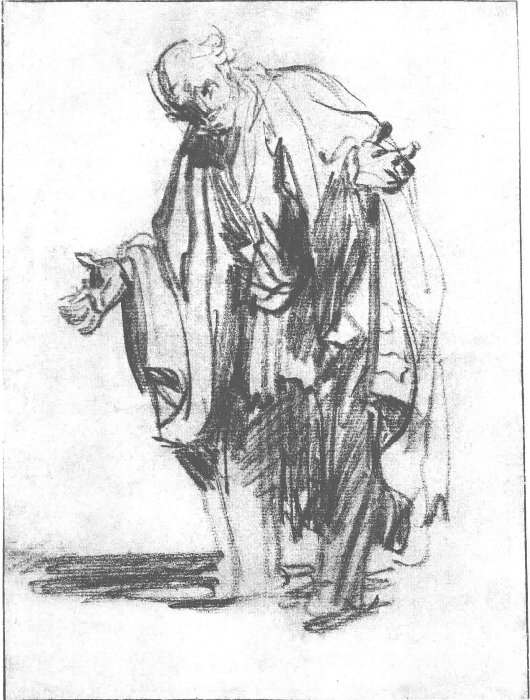
圣彼得习作 约1629年 25.4cm × 19cm