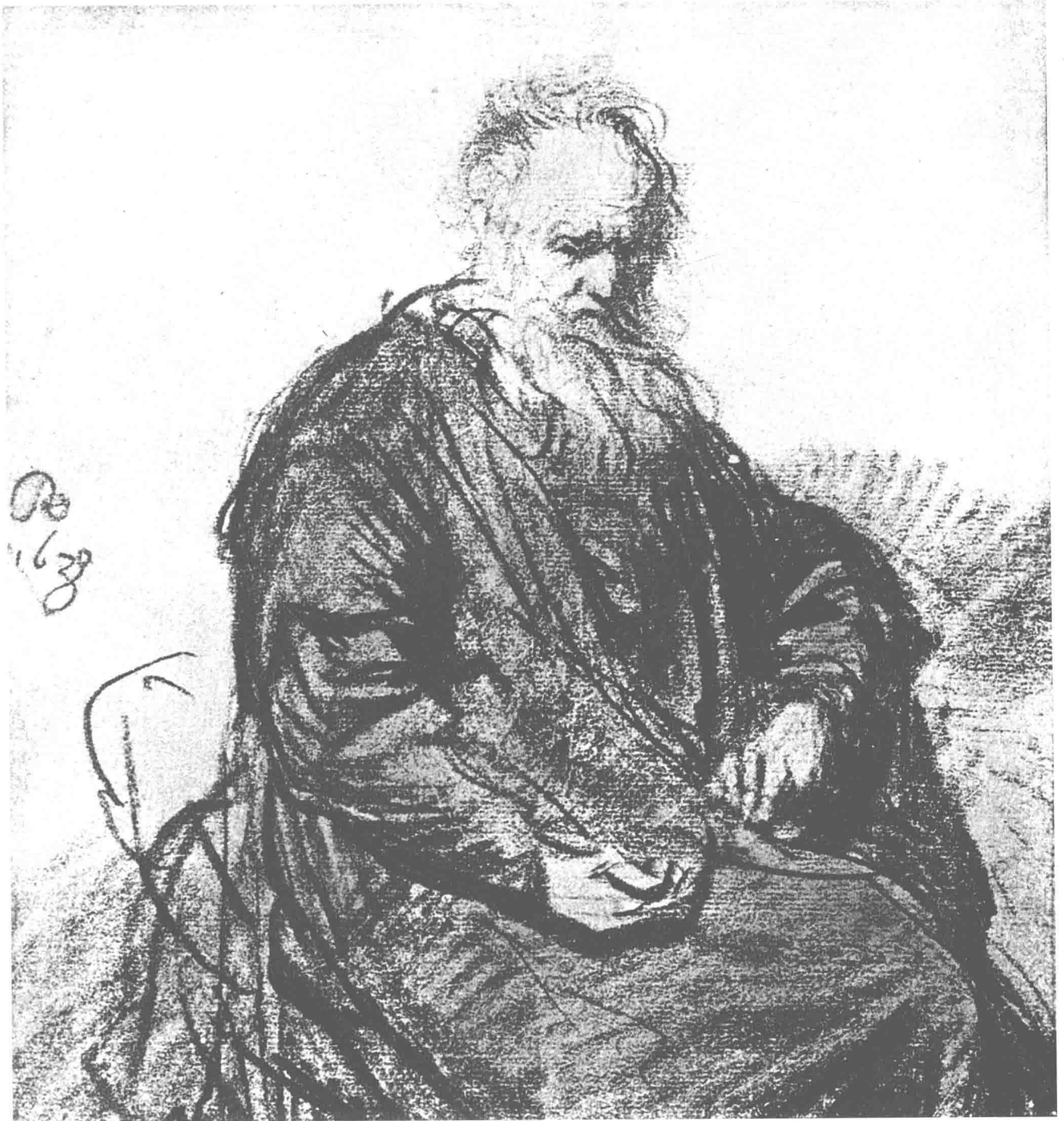
坐着的老人 1630年 15.7cm × 14.7cm