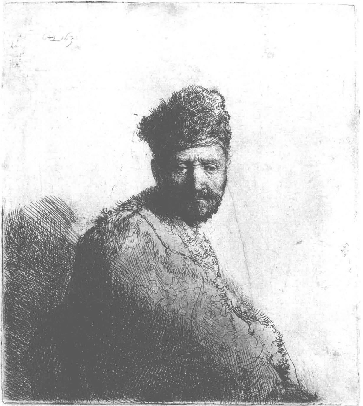
Portrait d'homme à barbe courte :