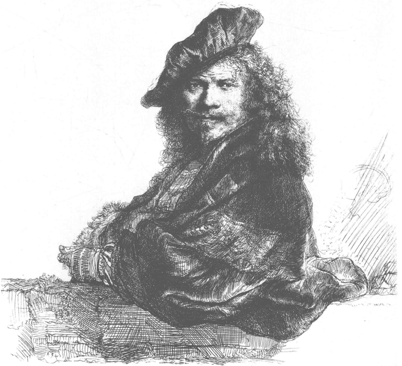
戴帽子的男子 1639年 20.6cm × 16.6cm