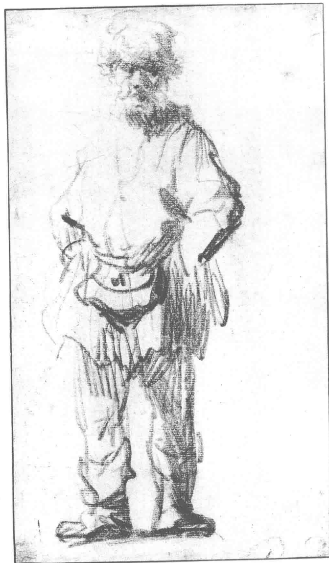
拉绳的男人 1627—1628年 27.3cm×17.6cm