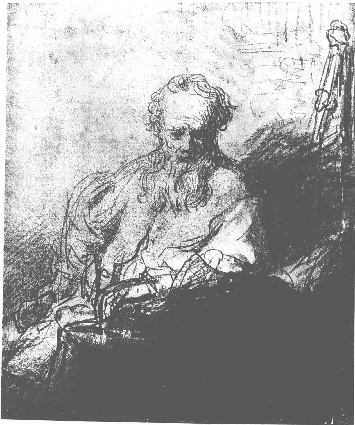
圣保罗习作 约1629年 23.6 cm × 20.1 cm