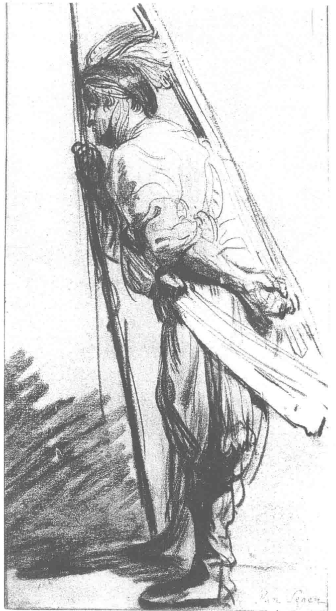
弓箭手习作 1627—1628年 27.7 cm × 17.7 cm