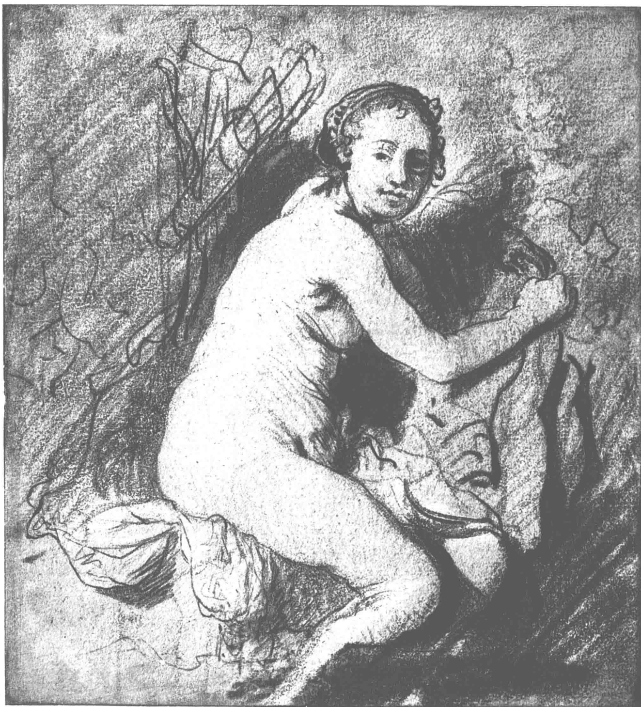
浴室中的狄安娜 1630—1631年 18.1cm × 16.4cm