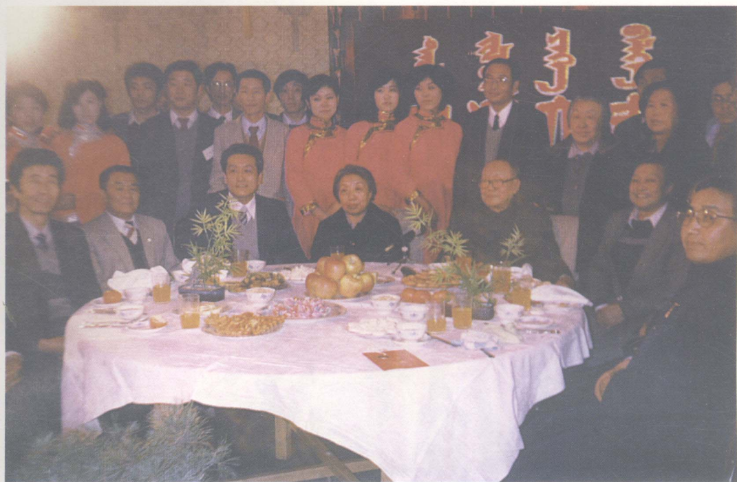
▲ 国家副主席乌兰夫在内蒙古驻京办事处参加庆祝内蒙古自治区成立40周年文艺演出活动，并同办事处负责同志和工作人员合影。