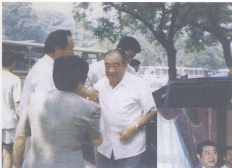
▲ 1997年4月7日，全国人大常委会副委员长布赫到驻京办事处视察工作。