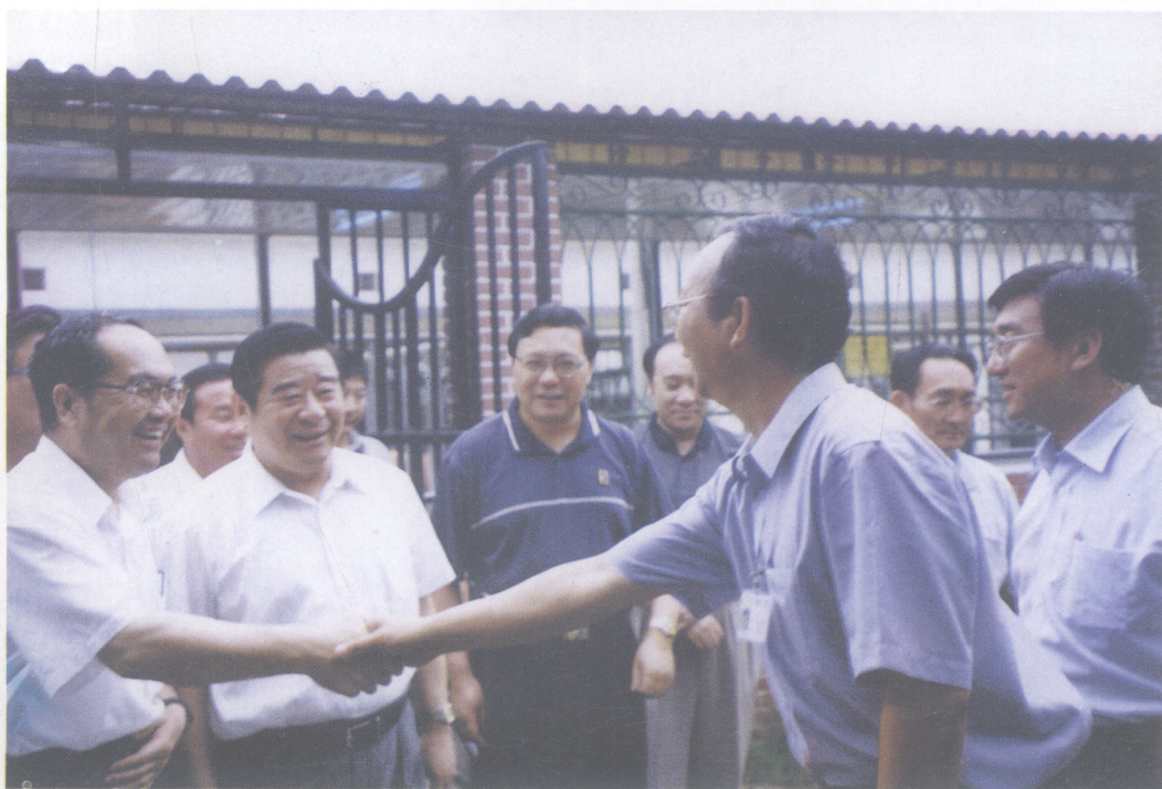
▲ 自治区党委书记、人大常委会主任刘明祖，自治区党委副书记、主席云布龙在北京市有关领导和驻京办事处负责同志陪同下参观考察北京市高科技农业开发。