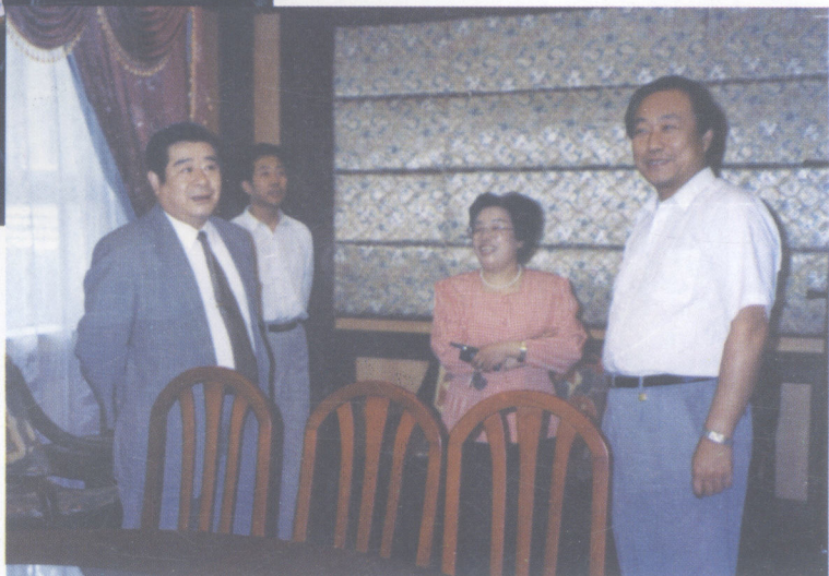
▲ 1997年5月22日，自治区党委书记、自治区人大常委会主任刘明祖到驻京办事处视察工作。