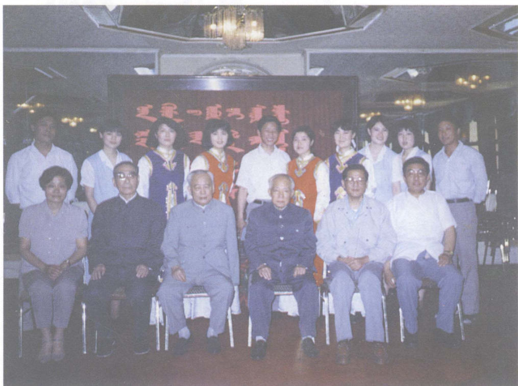
▲ 1991年6月6日，余秋里、陈丕显、倪志福、康世恩等中央领导同志在内蒙古驻京办事处同有关负责同志和宾馆服务员合影。