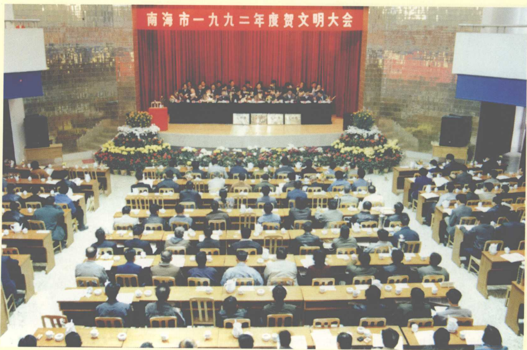
1993年1月15日，南海市召开1992年度贺文明大会。