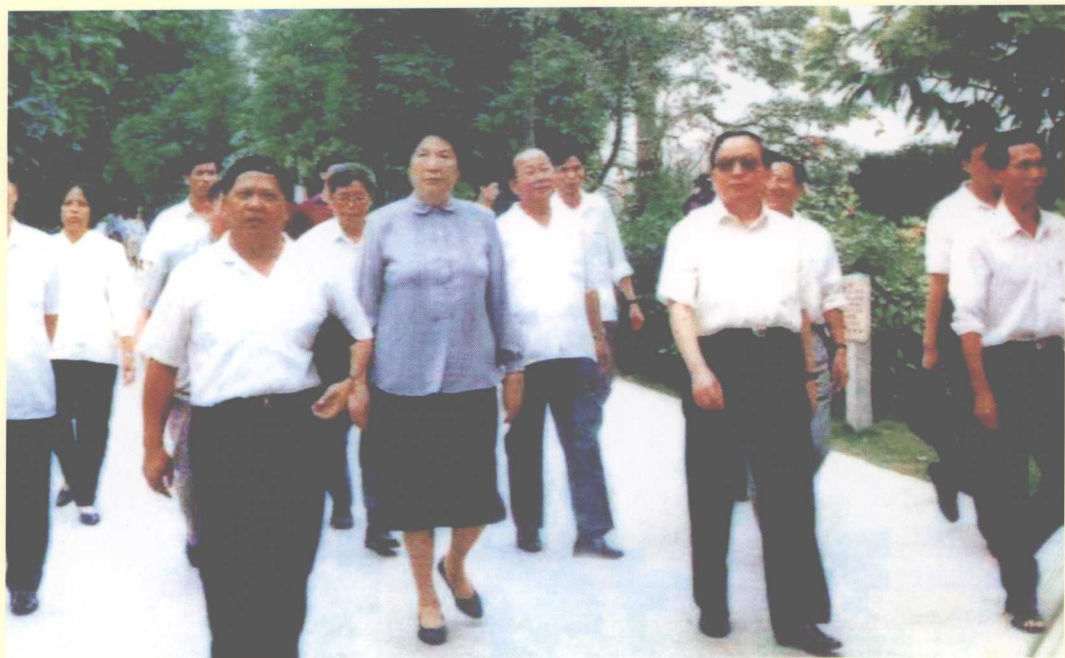
1991年10月14日，中共中央政治局委员、国务院副总理田纪云（前排右二）、全国人大常委会副委员长陈慕华（前排右三），在广东省副省长于飞等陪同下视察里水管理区精神文明建设。