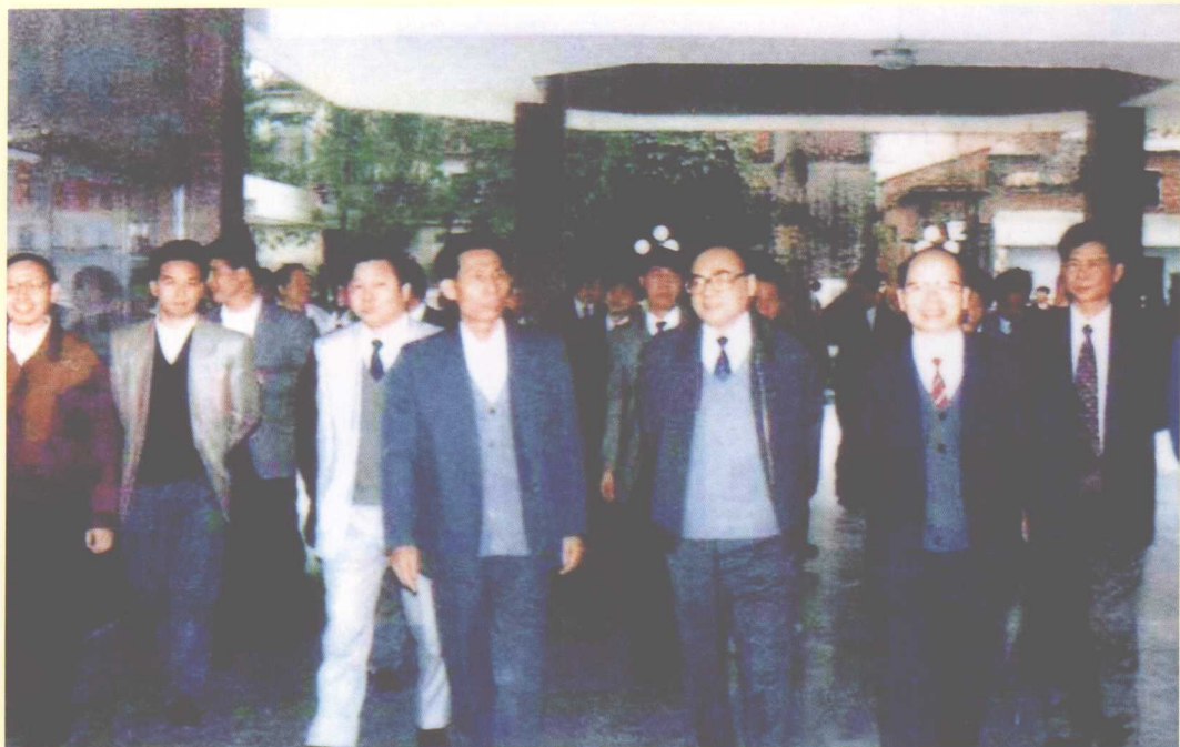
1995年3月27日，中共中央政治局委员、中共中央书记处书记、中宣部部长丁关根（右三）在中共广东省委书记谢非（右二）陪同下视察里水管理区“两个文明”建设。