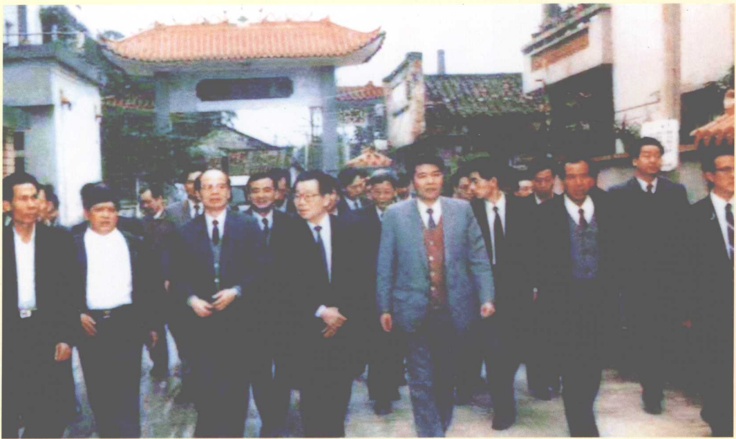
1992年3月18日，中共中央政治局常委、书记处书记李瑞环（前排左四）在广东省委书记谢非（前排左三）、佛山市委书记欧广源（前排左五）、南海县委书记李景滔（第二排右四）等陪同下，视察里水管理区精神文明建设。