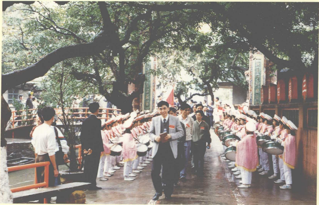
1992年4月9日，参加广东省创建文明户、文明村镇经验交流会的代表到桂城叠南管理区江头村参观“文明村、户”建设。