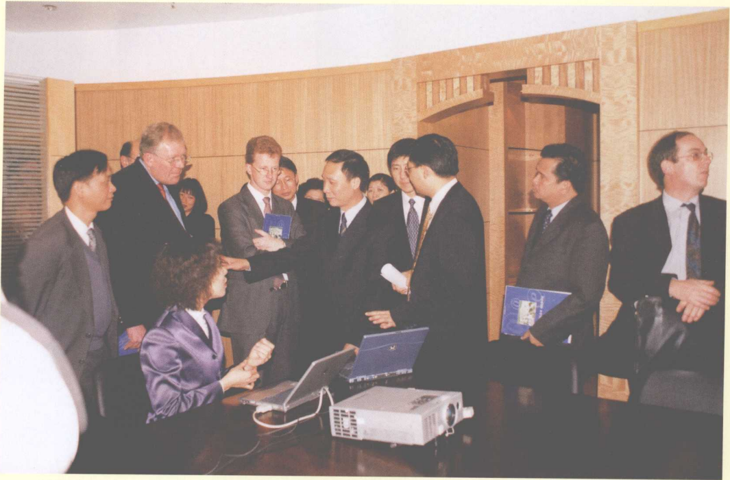
2001年1月19日，15国驻穗领事团参观南海市精神文明建设信息中心。