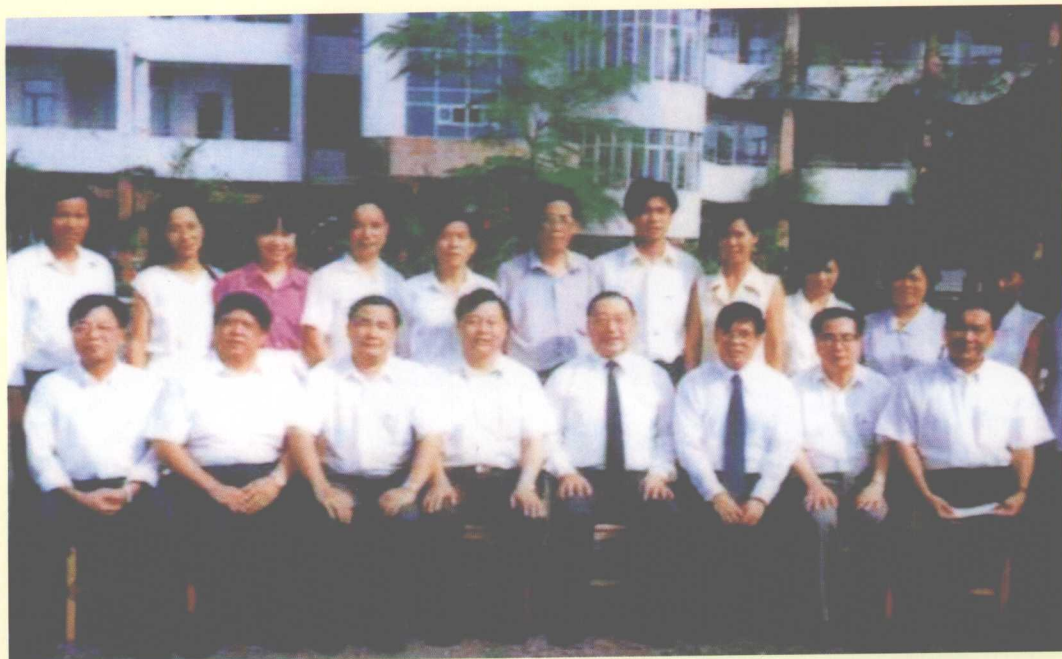
1994年10月17日，国务院副总理、国家教委主任李岚清（前排右四）到里水管理区视察。