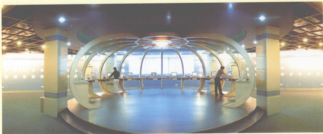
2001年1月18日，南海市精神文明建设信息中心成立。

2000年4月6日，中共广东省委副书记、省文明委常务副主任黄丽满（左二），中共广东省委常委、宣传部长、省文明委副主任于幼军（右一），在中共南海市委书记邓耀华（左一）的陪同下，参观大沥沥东豪美新村农民公寓。