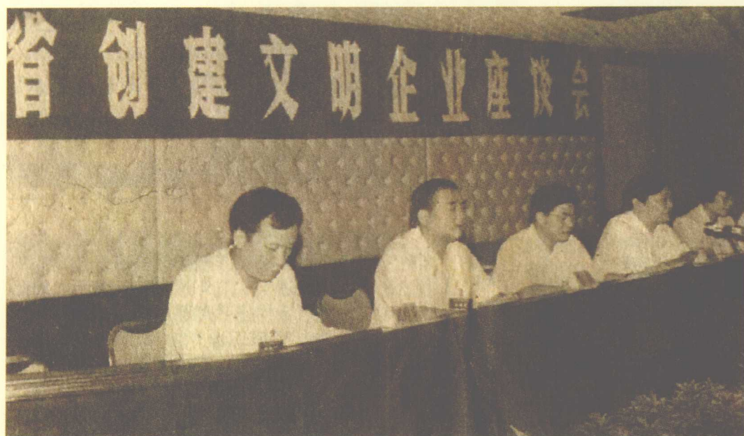
1995年8月29日至9月1日，广东省创建文明企业座谈会在西樵山旅游度假区西樵大酒店召开。出席此次座谈会的有中共广东省委副书记、省精神文明建设委员会主任黄华华（右三），中共广东省委常委、宣传部长、省精神文明建设委员会副主任于幼军（右二）。