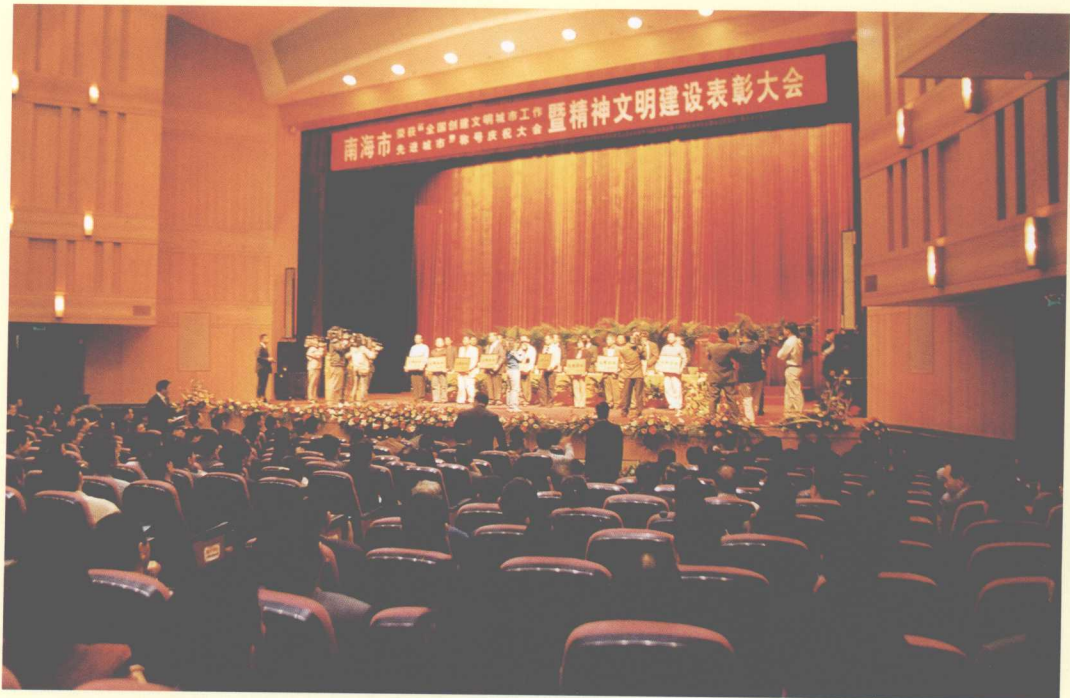
2002年11月5日，市委、市政府召开南海市荣获“全国创建文明城市工作先进城市”称号庆祝大会暨全市精神文明建设表彰大会。