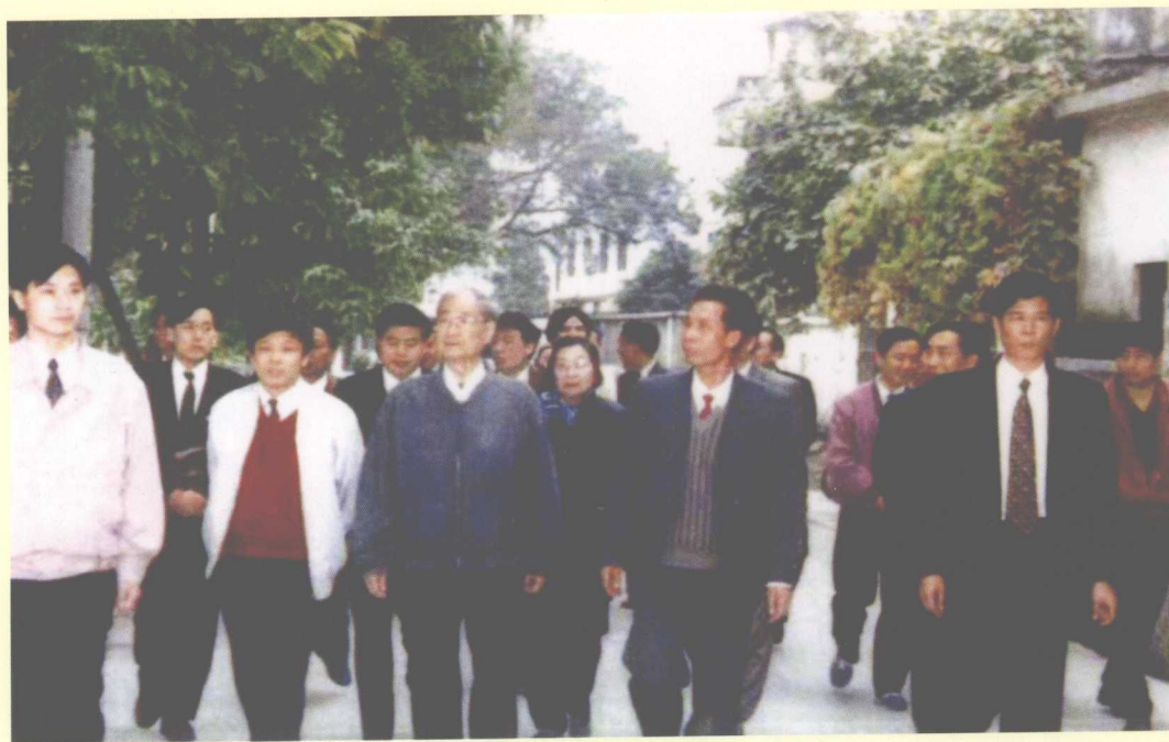
1995年1月21日，原中共中央政治局常委宋平（前排右三）到里水管理区视察“两个文明”建设。