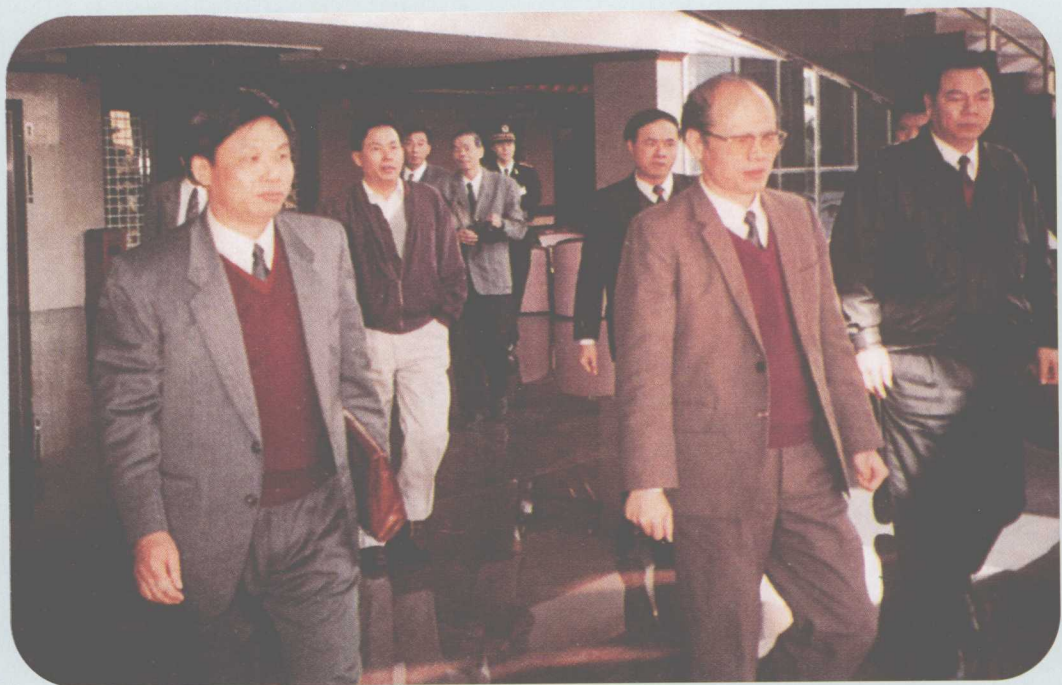
▲ 1993年12月22日，中共中央政治局委员、广东省委书记谢非（前排左二）到南海视察。