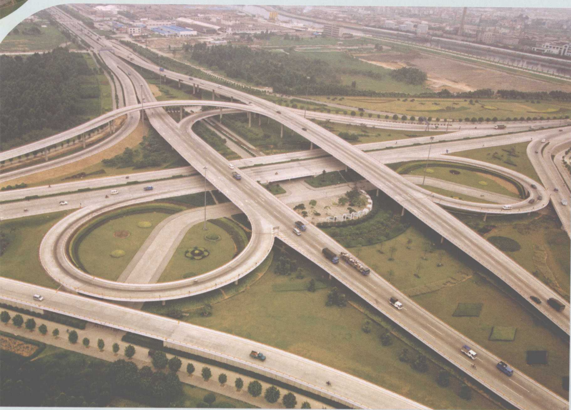
▲ 桂江立交桥，位于桂城海八路，是一座苜蓿叶加定向组合式城市型完全互通式立交桥。桥长1851.37米，由三层19座桥梁组成。工程占地171333平方米，总投资约1.7亿元，于1997年9月23日竣工通车。