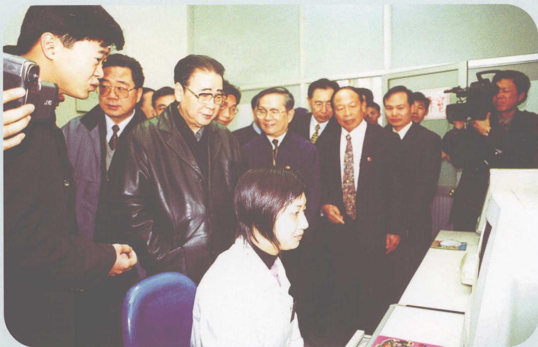
↑ 2000年8月15日，中共中央政治局常委、全国人大常委会委员长李鹏（前排左二）在西樵轻纺城考察工作。