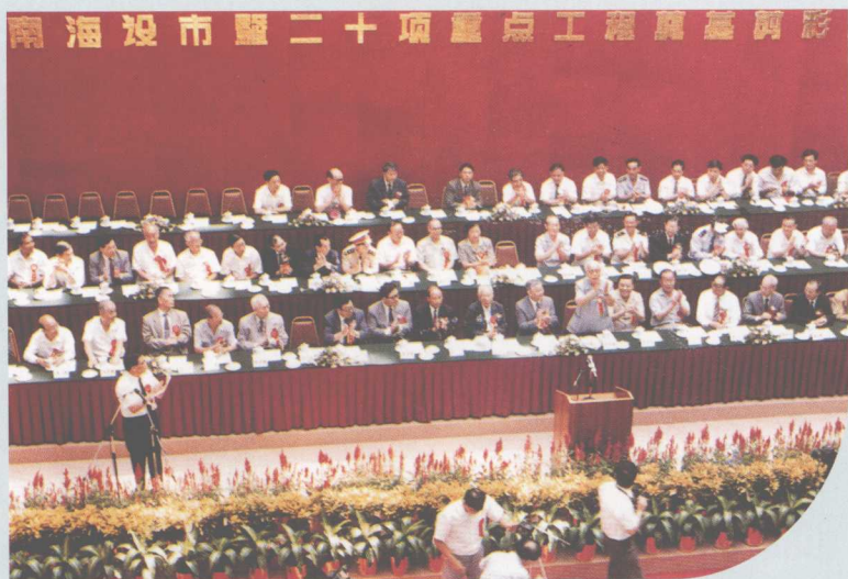
◀ 1992年9月23日，南海设市暨二十项重点工程奠基剪彩庆典。