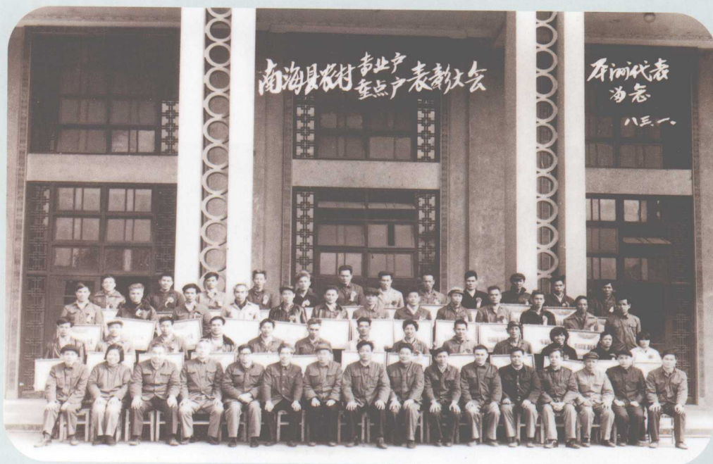
↑ 1983年1月，南海县召开农村专业户重点户表彰大会。图为大会的部分代表合照。