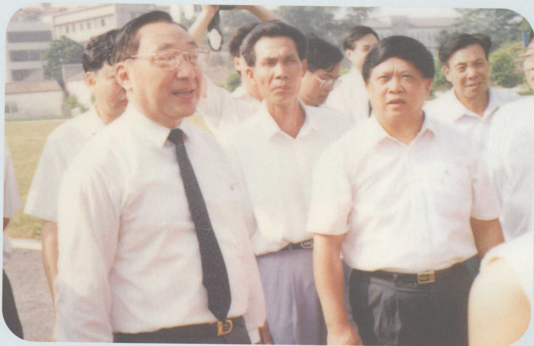
▲ 1994年10月16日，中共中央政治局委员、国务院副总理李岚清（左一）视察南海里水镇文明村和里水小学。