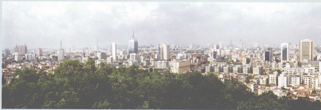
↑ 20世纪80年代中期开始兴建的南海城区——桂城