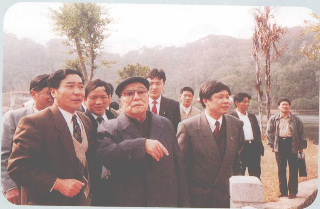
↑ 1993年2月9日，国家主席杨尚昆（前排中）由佛山市委常委梁国聚（左）、南海市市长林浩坤（右）陪同，到南海市西樵山旅游区视察。