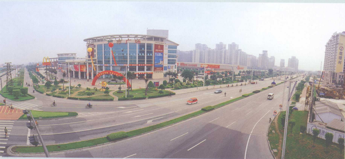
↑ 城市广场，位于桂城桂澜路与桂平路交汇处，是南海市中心城区规划发展的商业中心之一，占地约11万平方米，于2002年5月开业。