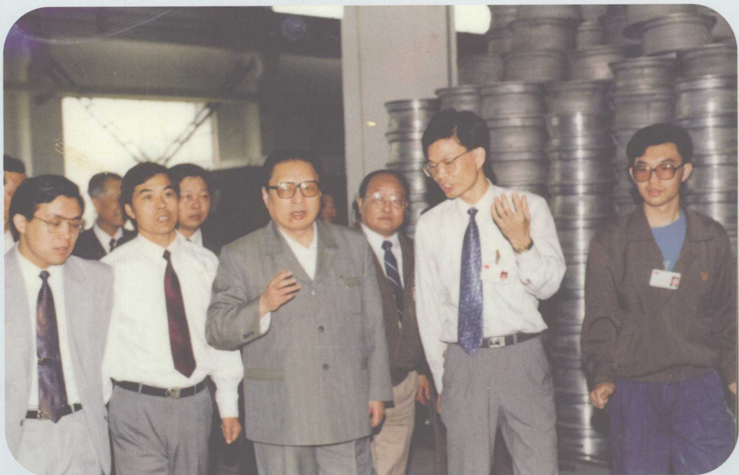
↑ 1993年4月18日，中共中央政治局常委、全国人大常委会委员长乔石（前右三）视察南海中南铝合金轮毂厂。