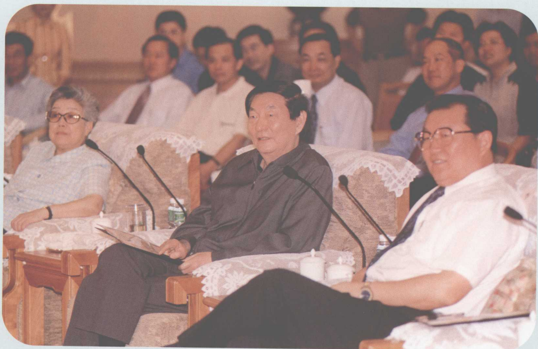
▲ 2001年10月17日，中共中央政治局常委、国务院总理朱镕基（前排左二）由中共中央政治局委员、广东省委书记李长春（右一），中共中央政治局候补委员、国务委员吴仪（左一）陪同在南海考察工作。