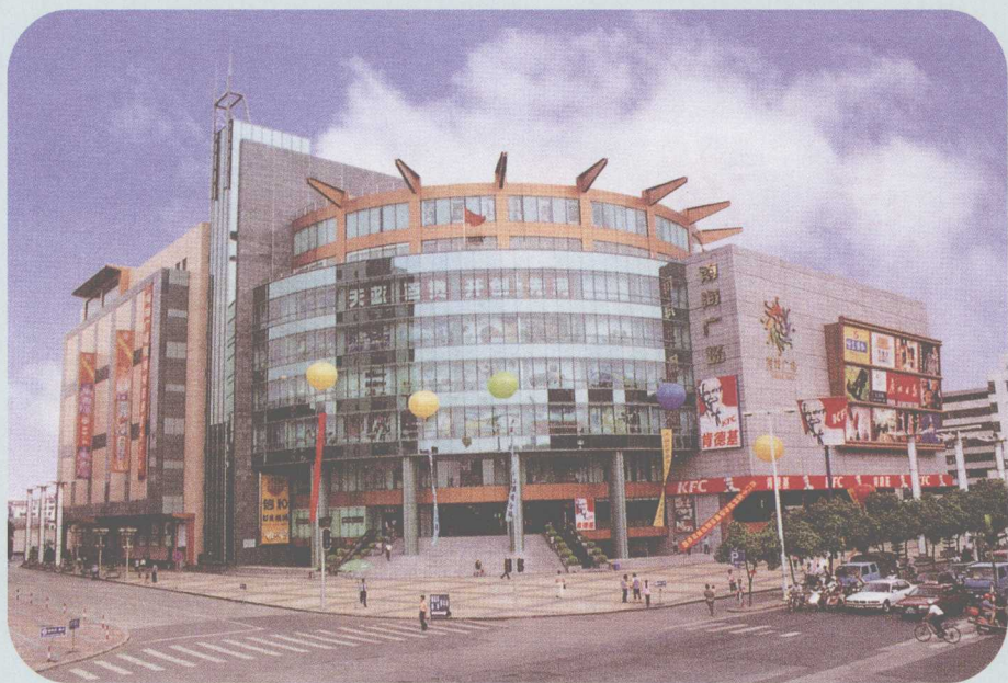
▲ 南海广场，位于桂城南海大道，是一座大型多功能现代化商厦，建筑面积8万平方米，楼高10层，总投资4.5亿元，于2000年9月23日试业。