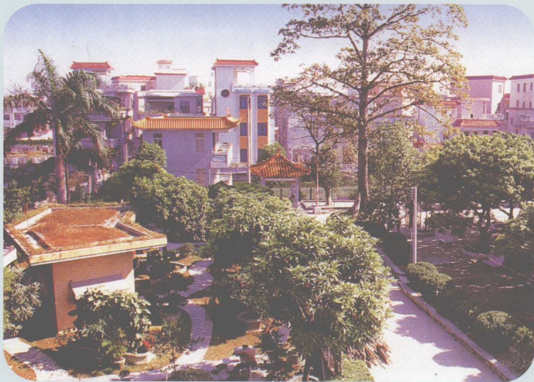
▲ 里水镇里水文明村，2002年为全国村镇文明建设先进单位，居佛山市“十佳文明村”榜首。（选自《南海老干》）