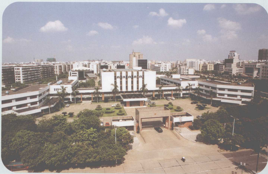
▲ 坐落于桂城南海大道的南海领导机关大院，右为政府办公大楼。