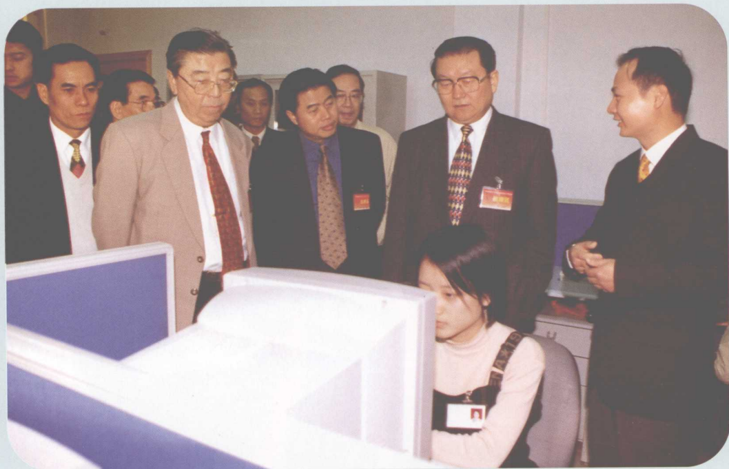
▲ 2000年11月20日，中共中央政治局委员、广东省委书记李长春（右二）到南海市考察工作。