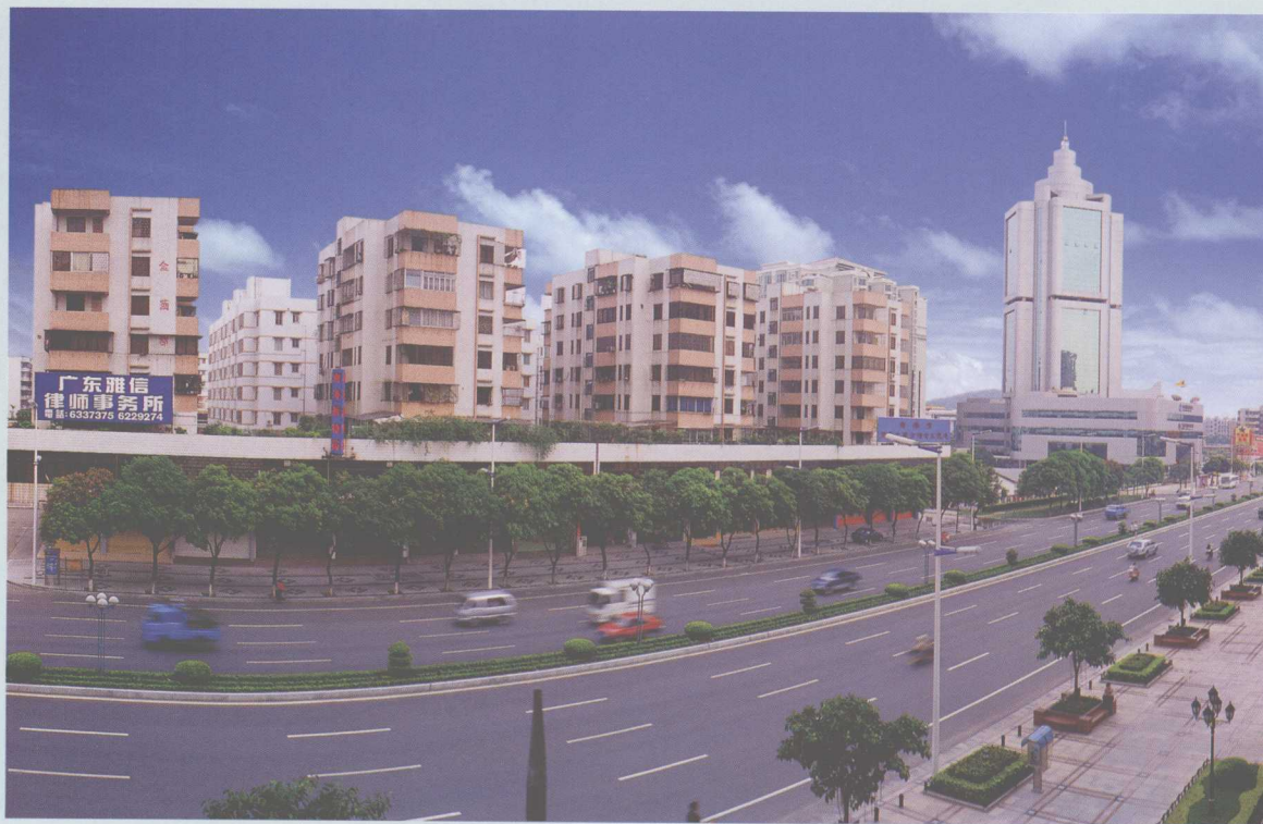
↑ 桂城南海大道车流畅顺。