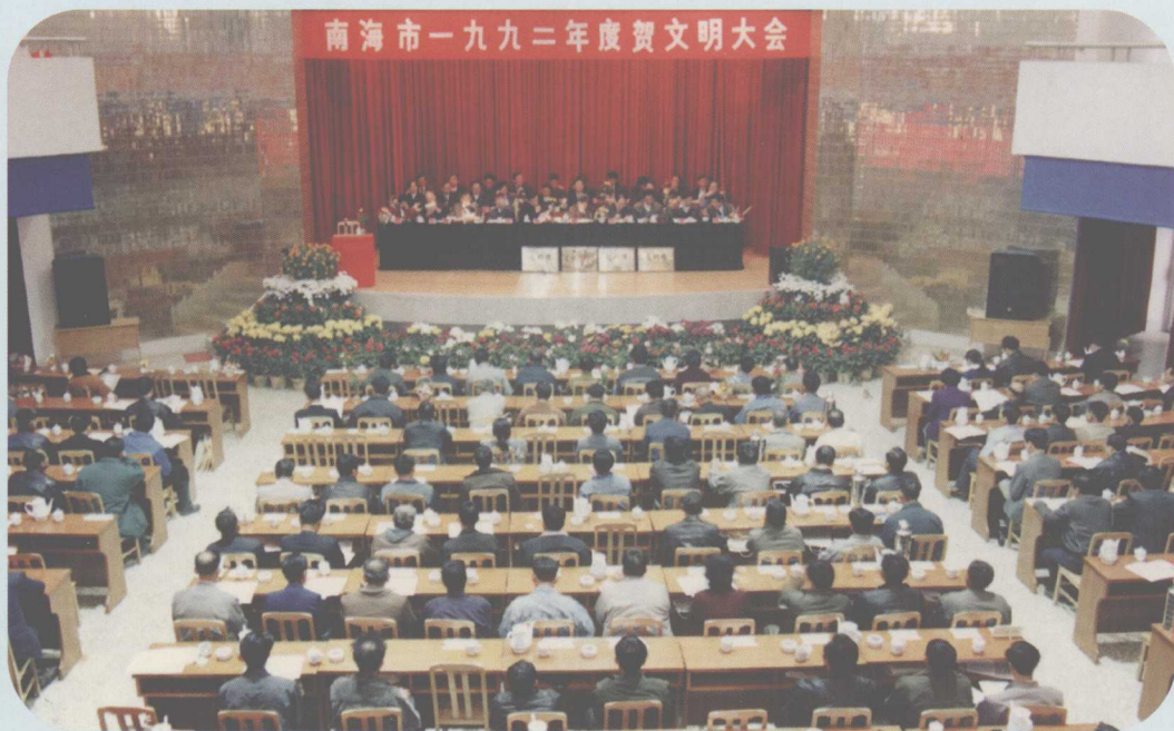
▲ 1993年1月15日，南海市1992年度贺文明大会在市科学馆举行。