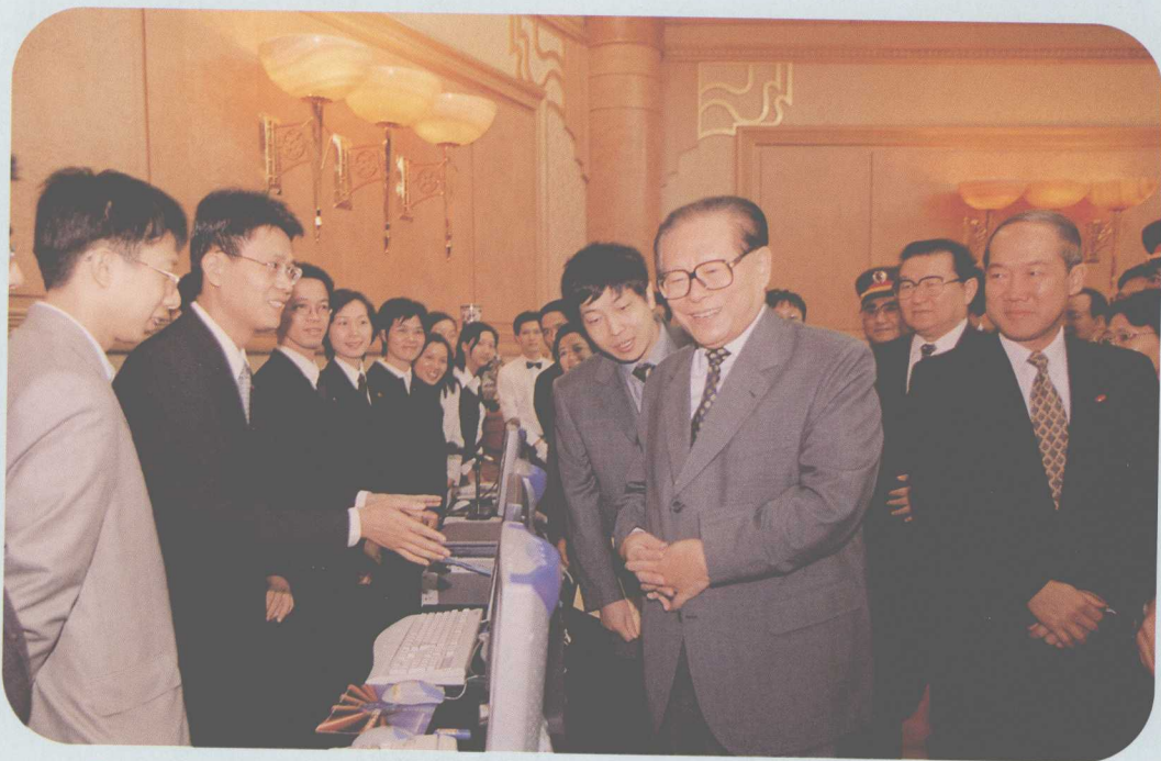
↑ 2001年11月11日，中共中央总书记、国家主席、中央军委主席江泽民考察南海市信息化建设。图为江总书记与信息管理系统操作人员亲切交谈。