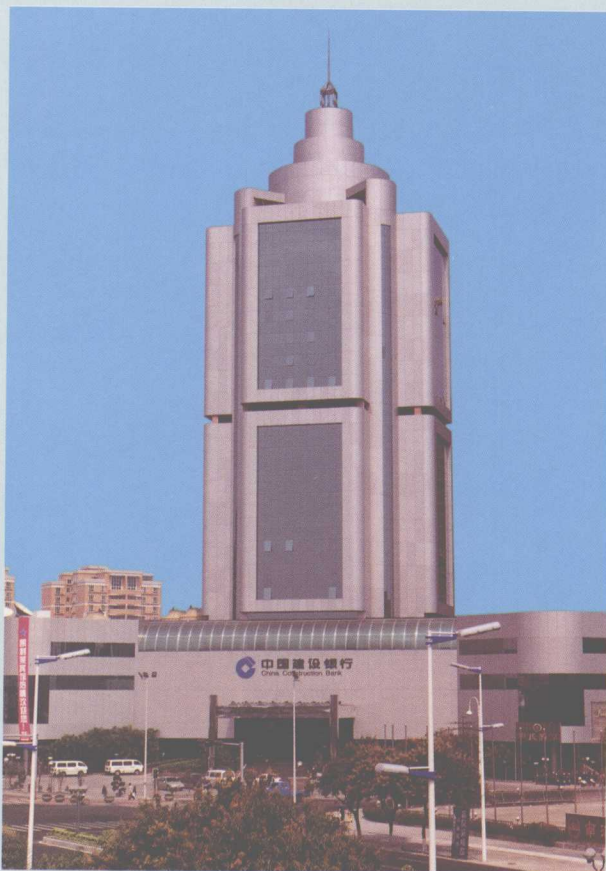
↑ 建设银行南海市支行大楼位于桂城南海大道，始建于1992年，楼高23层。