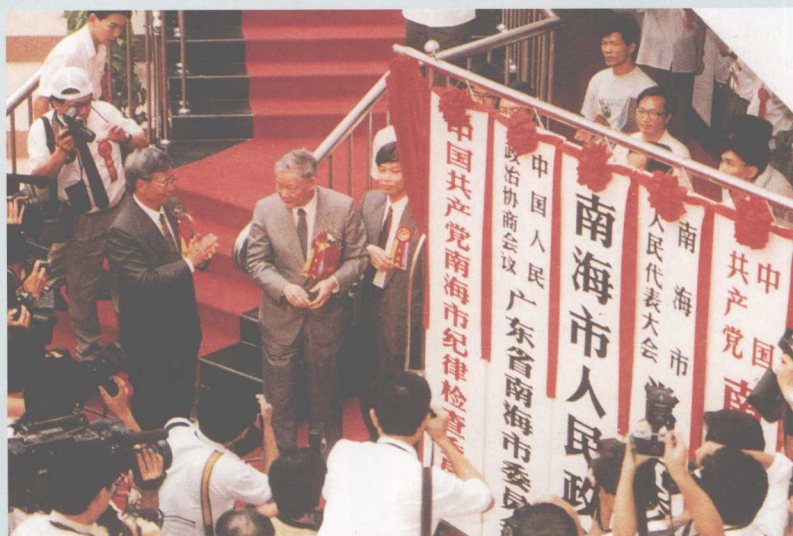
▶ 1992年9月23日，在市政府大楼举行南海市五套领导班子牌匾揭幕仪式。图为全国政协副主席叶选平为牌匾揭幕。