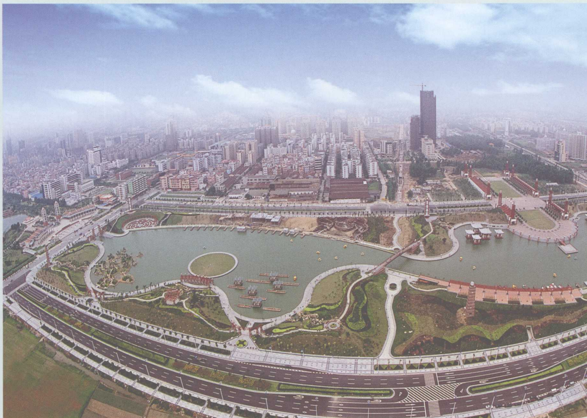
▲ 千灯湖，位于桂城，占地约201333平方米，是城市开敞公园，始建于2000年。图为千灯湖鸟瞰。