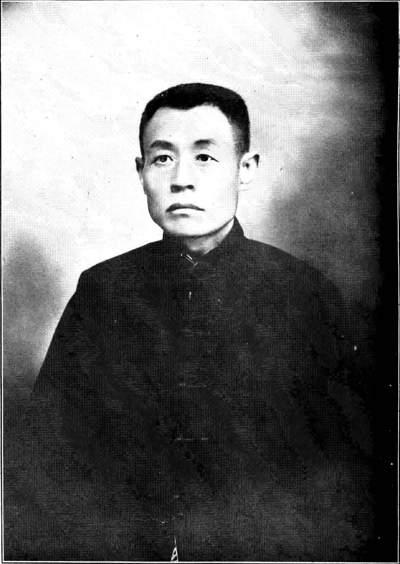
營口市政公所兼辦營口臨時防疫會辦事處