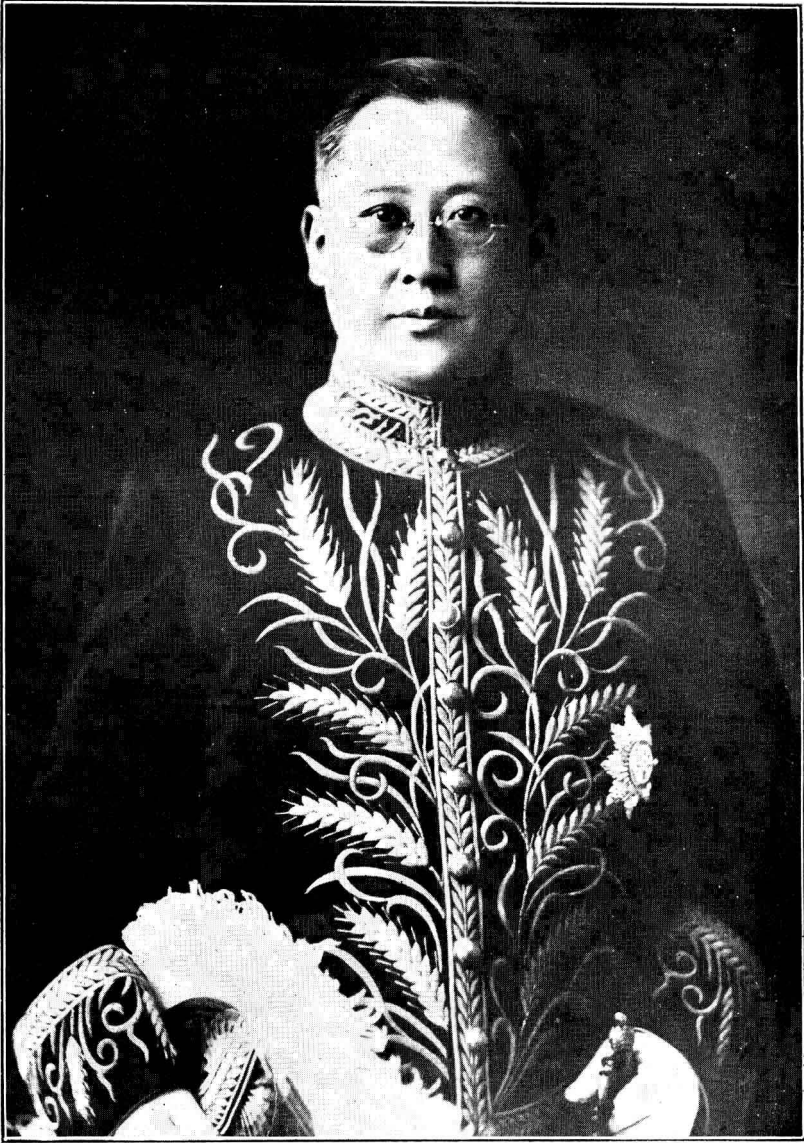
奉天遼瀋道尹兼營口臨時防疫總辦