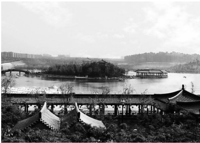
图 1-2 今日曲江池

唐代国力强盛,所建园林规模更为宏大,仍取宫苑结合、前宫后苑的形式,著名的有西内(太极宫)、东内(大明宫)和南内(兴庆宫),并在骊山建华清宫。禁苑内除离宫别馆外,还有“球场”,当时在贵族中盛行骑马击球,这是我国园林中出现较早的体育活动场地。在城的东南角有“曲江池”(图 1-2),也是帝王游乐之所。环江有观榭、宫室、紫云楼、采霞亭等,据说每年还定期向市民开放 3 天,是我国最早出现带有“公园”含义的园林胜境。