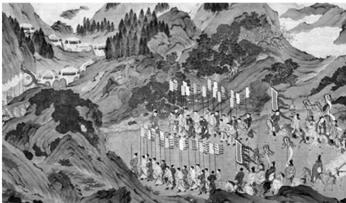
图 1-1 明代院派画家《汉武帝上林出猎图》

除皇家园林以外,西汉时期还出现了私家园林,但并不普遍。《西京杂记》记述了汉武帝时期茂陵富人袁广汉所筑私园的情况:“东西四里,南北五里,激流水柱其内,构石为山,高十余丈,连绵数里。”可见,私家园林的建设也以山水为主要构建元素。