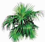
palm tree 棕榈树