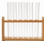
test tubes 试管