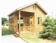
log cabin 小木屋