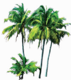
coconut trees 椰子树