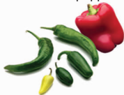
hot peppers 辣椒