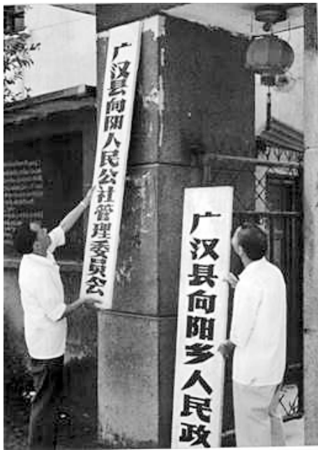
1980年9月，向阳公社在全国率先摘下人民公社的牌子，挂上广汉县向阳乡人民政府的牌子

牌子，挂上“广汉县向阳乡人民政府”的牌子。1980年12月23日，广汉县委向四川省委和温江地委呈送了《关于农村体制改革的请示》。1981年1月30日，四川省委对广汉的请示作了批复，同意在全县试点。此后，省委将这一改革措施在新都县、邛崃县推广。