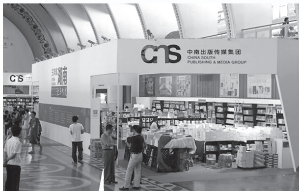
2013上海书展暨“书香中国”上海周活动湖南展区

出版湘军凭借着厚重的湖南文化底蕴，带着敢于拼搏、不惧挑战的湖南人精神特质，创造了一个又一个出版佳绩：2012年湖南出版投资控股集团实现汇总口径营业收入130亿元、利润9.19亿元，同比分别增长18.8%、24.5%；中南出版传媒集