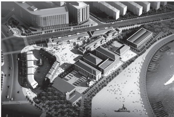
如火如荼的长沙创意产业

抓机遇，乘势而上，依托工程机械、轨道交通设备、电工电器、汽车及零部件等产业现有的基础和竞争优势，进一步做大做强；在电子信息核心技术、基因工程、纳米材料、动力电池—混合动力车、传感器、数控机床、新型工程机械和中药现代化等方面实现技术重点突破，培育一批成长性