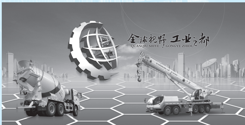
长沙被誉为新“工业之都”

以新型工业化推动社会经济持续健康发展，是湖南省富民强省的主要战略措施。推进新型工业化是长株潭城市群发展的产业支撑，也是两型社会建设的重要途径。长株潭城市群两型社会建设的首要任务，就是要走一条以两型产业为支撑的新型工业化的路子。