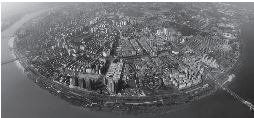
株洲高新区全景图

株洲，驶出了我国第一台电力机车，诞生了我国第一台航空发动机，被誉为“电力机车的摇篮”、“动力之都”。株洲高新区是国家轨道交通装备高新技术产业化基地，聚集了电力机车、时代电气、南车电机等一大批整车及关键核心设备制造企业。株洲是目前我国唯一的中小型航空发动机、直升机传动系统、轻型燃气轮机研发中心和生产基地。以南车时代电动汽车和南方宇航两家企业为核心的株洲新能源汽车产业集群正在加速形成。