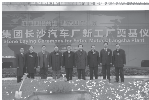
北汽福田长沙汽车厂新工厂奠基