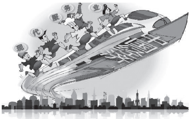
现代服务业助中国经济腾飞

的商业模式、服务方式和管理方法基础上的服务产业，一般分为生产性服务业和生活性服务业。现代服务业具有智力要素密集度高、产出附加值大、资源消耗低、环境污染少、产业关联性强等特性，是破解资源能耗与环境承载力约束难题的必然选择。