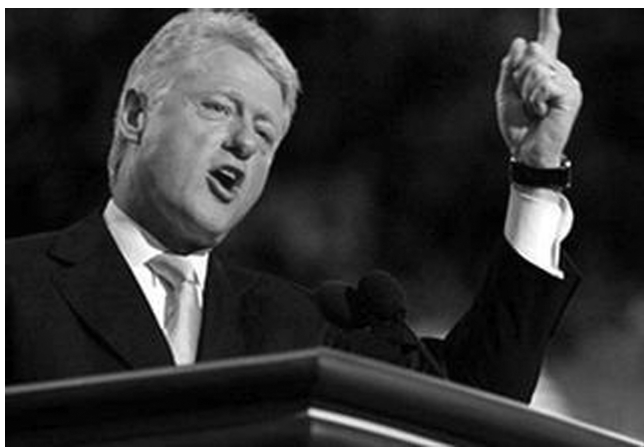
比尔·克林顿，1992年成功当选为美国总统， 1996年，成功连任

诚然，老布什在海湾战争中功不可没。但是在1991年海湾战争结束后，美国经济陷入其自20世纪80年代后的严重衰退中，经济增长速度下滑，通货膨胀严重。人们探究导致经济衰退的原因，发现一方面是因为英美推出的巴塞尔协定 I（Basel I）。巴塞尔协定 I，首先依照信用风险的水平，将银行的表内资产划分了五个类别，分别赋予0%到100%的风险权重，例如：国家的借款风险权重为零，而一般公司借款的权重为100%。其次，通过新划分的风险权重，计算极为重要的变