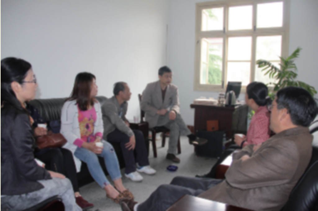
兴平市档案局来户县学习方言建档工作经验