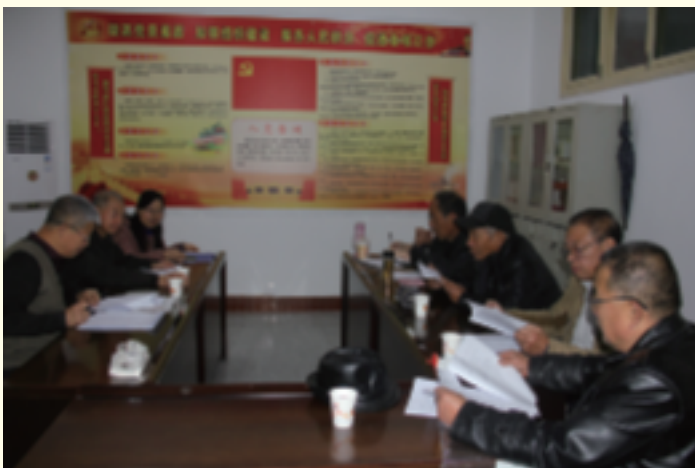
方言建档发音人培训