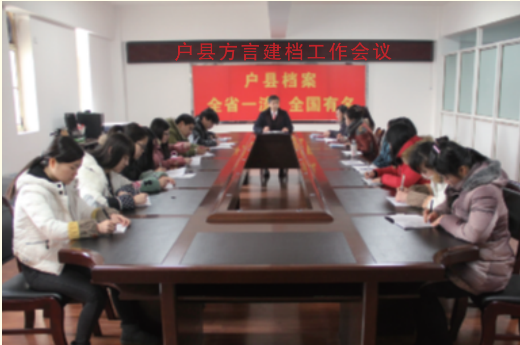
户县方言建档工作会议