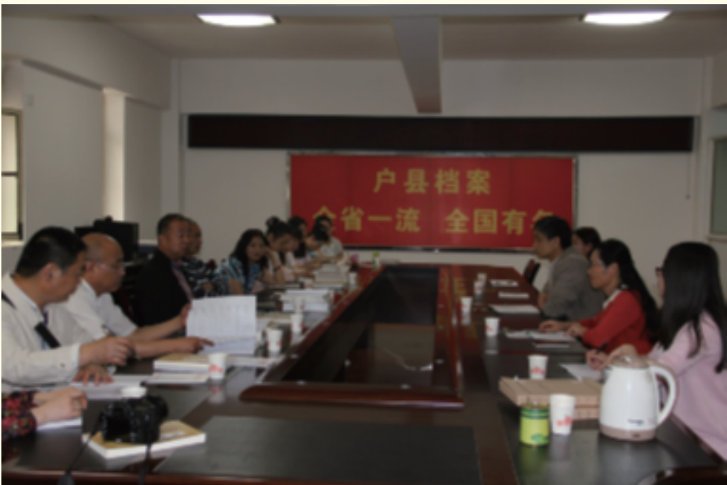
西安市雁塔区档案局来户县学习方言建档工作经验