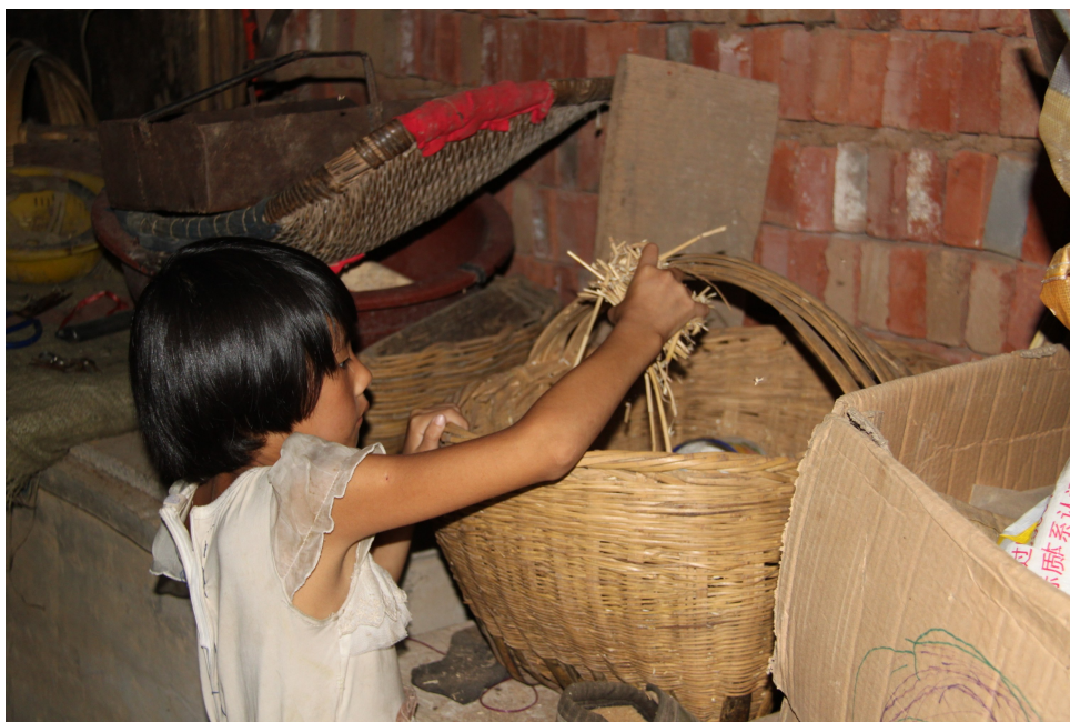
小小的年纪不轻的担子