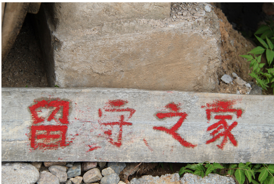
“留守阿舅”的“留守之家”