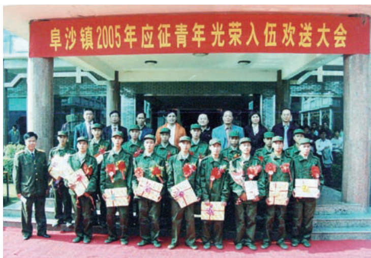
2005年冬季征兵，阜沙镇有16名青年应征入伍。图为阜沙镇党政领导班子成员与新兵在阜沙镇政府会议楼前合影