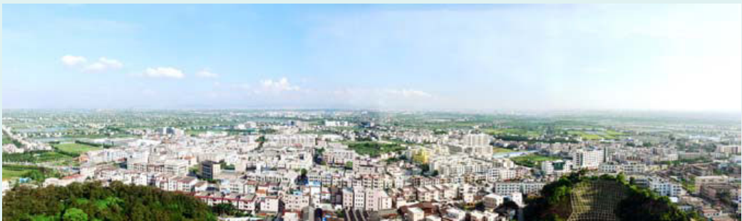
2005年阜沙镇中心城区