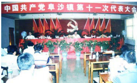
2002年7月22日，中共卓沙镇第十一次代表大会召开，选举卓沙镇党委书记、副书记、委员