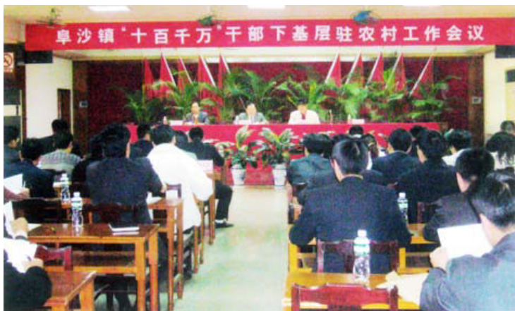
2005年12月30日，阜沙镇召开“十百千万”干部下基层驻农村工作会议