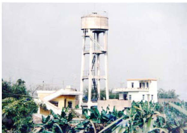
1983年5月建成的横迳自来水厂