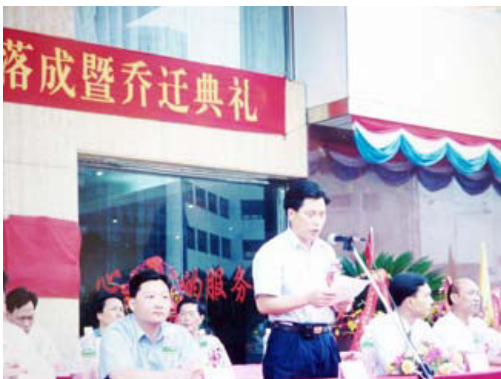
2000年6月16日，阜沙镇召开行政执法责任制试点工作总结大会