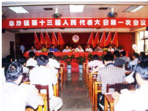
2002年8月，卓沙镇召开第十三届人民代表大会，选举卓沙镇人大正、副主席，镇政府正、副镇长