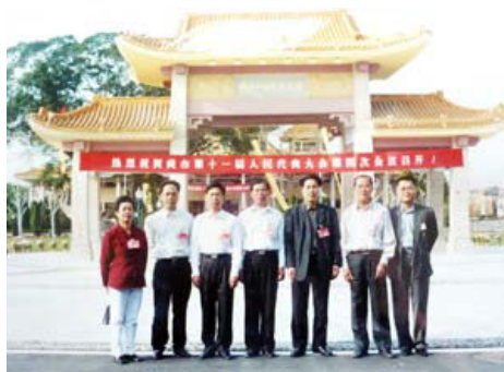
2002年3月1日，出席中山市第十一届人民代表大会第四次会议的卓沙镇代表合影留念