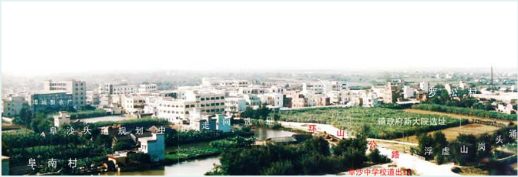
1990年的阜沙镇新城区及部分规划标记