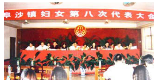
2003年9月6日，阜沙镇召开妇女第八次代表大会，选举阜沙镇妇联正、副主席