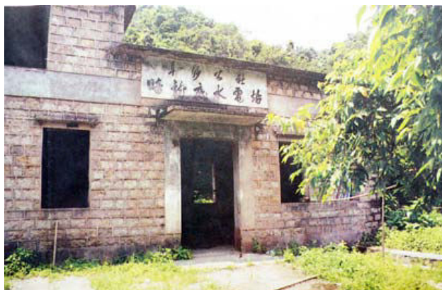
20世纪70年代，阜沙公社在五桂山兴建的暗龙底水力发电站遗址