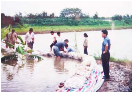
1998年6月，丰联村“杨东山围仔”抗洪