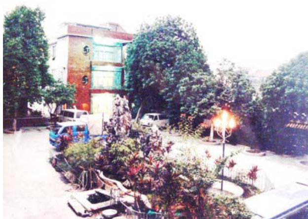
20世纪80年代初期，位于永红街的阜沙镇党委政府办公楼