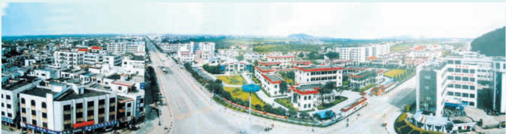
2000年阜沙镇中心城区西部 (中前是镇政府办公大院，直道是东阜公路阜沙大道)