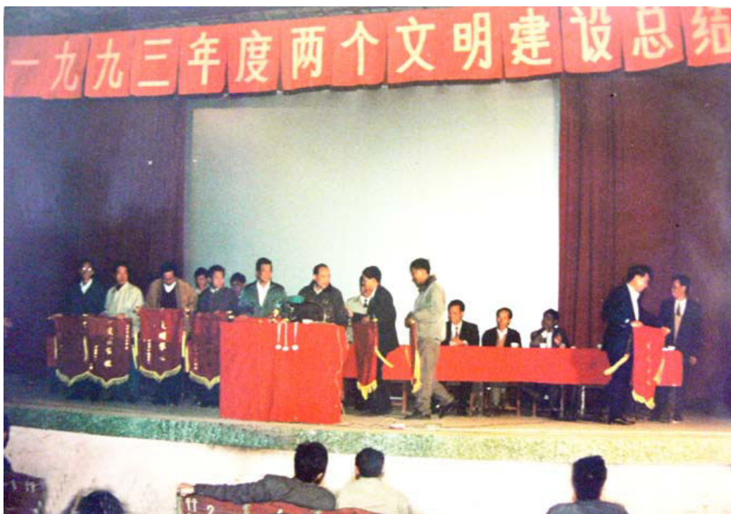
1994年1月28日，阜沙镇召开一九九三年度“两个文明”建设总结会