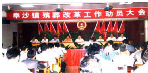
2003年4月，阜沙镇召开殡葬改革工作动员大会