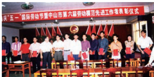
2003年4月30日，阜沙镇召开庆“五一”国际劳动节暨中山市第六届劳动模范先进工作者表彰仪式