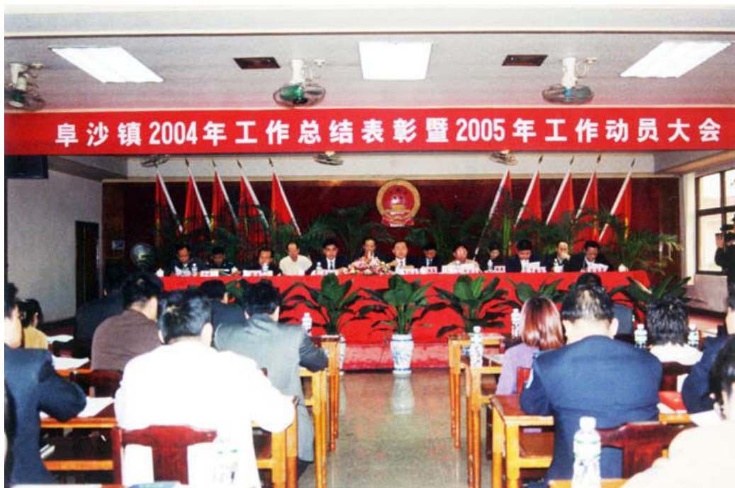
2004年12月，阜沙镇召开2004年工作总结表彰暨2005年工作动员大会