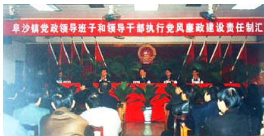
2003年9月10日，阜沙镇召开党政领导班子和领导干部党风廉政建设责任汇报会