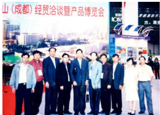
2001年6月，参加中山（成都）经贸洽谈暨产品博览会的阜沙镇代表团成员合影