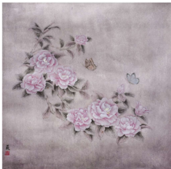
作品名称\初识茶花——粉茶 作者\邹晨晨 指导老师\梁卫民