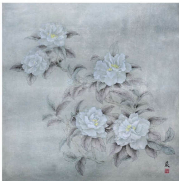
作品名称\初识茶花——白茶 作者\邹晨晨 指导老师\梁卫民