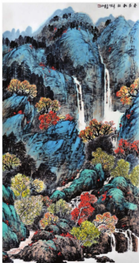
作品名称\秦岭秋韵 作者\王茜 指导老师\季玉民