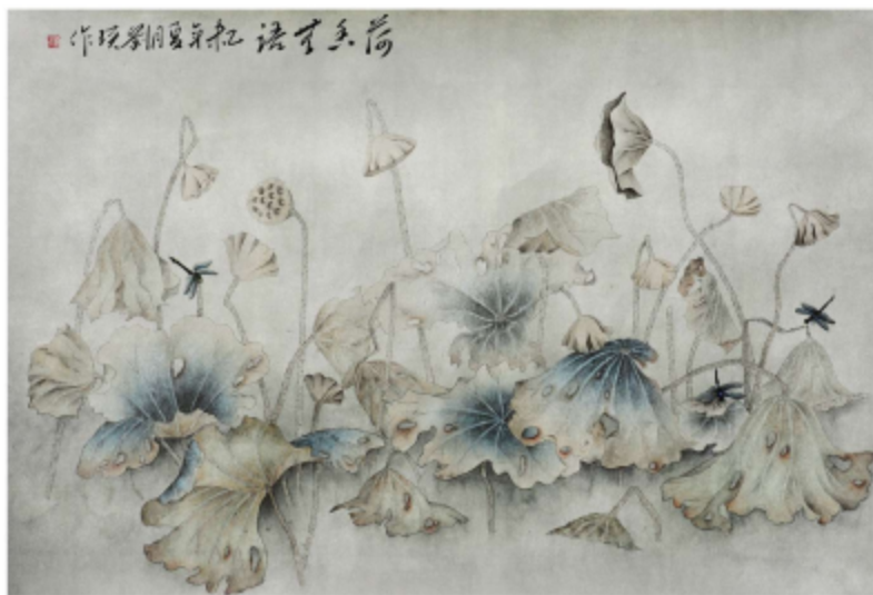
作品名称\荷香无语 作者\刘瑛 指导老师\梁卫民