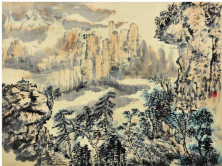
作品名称\此山此地此风景 作者\周静 指导老师\季玉民