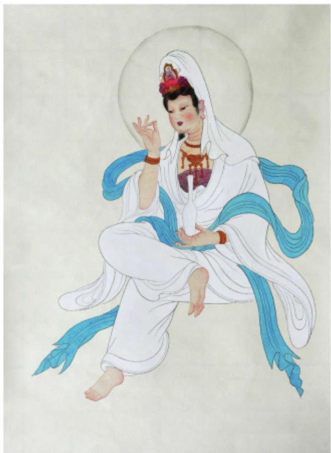
作品名称\观音 作者\陈永静 指导老师\殷晓克