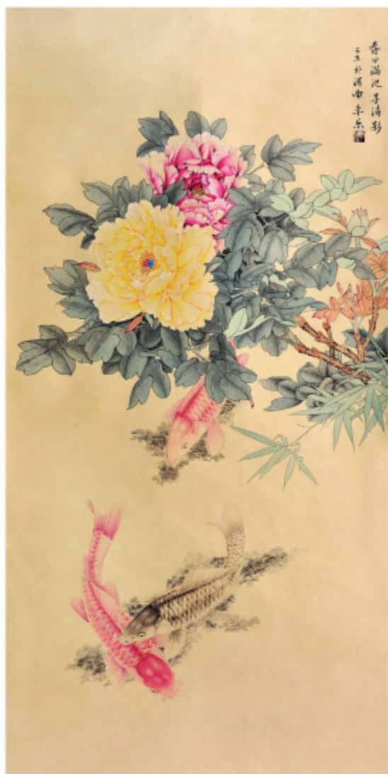
作品名称\鱼牡丹图 作者\李乐 指导老师\梁卫民