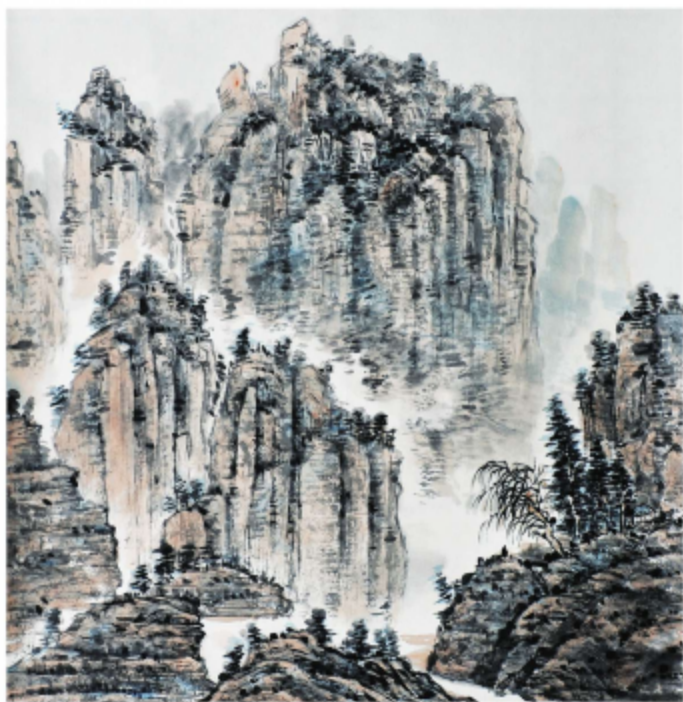
作品名称\秋山高瀑图 作者\陈世鹏 指导老师\季玉民