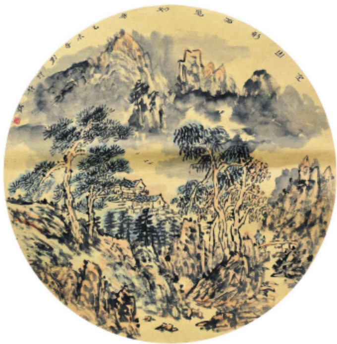
作品名称\空山新雨见知音 作者\刘许静 指导老师\季玉民