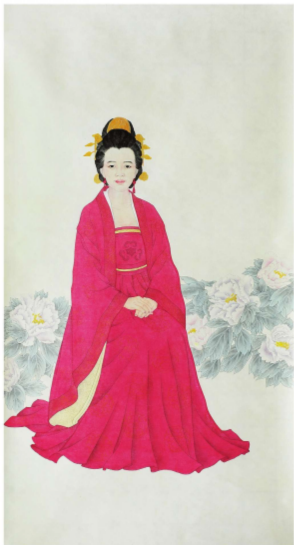
作品名称\仕女图 作者\薛寒飞 指导老师\殷晓克