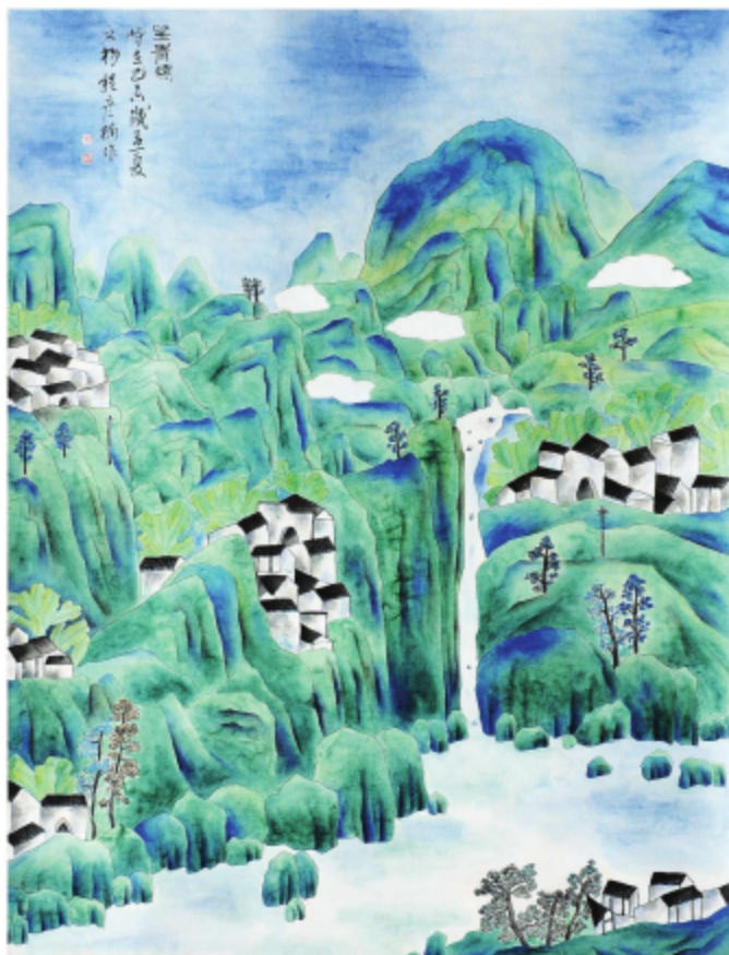
作品名称\望青螺 作者\程彦楠 指导老师\季玉民