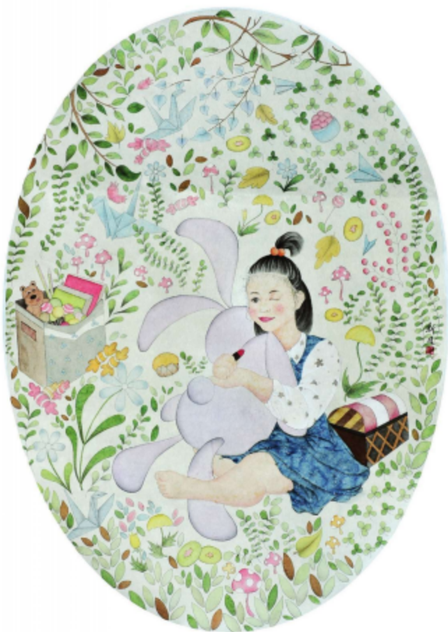
作品名称\童趣 作者\李新月 指导老师\梁卫民