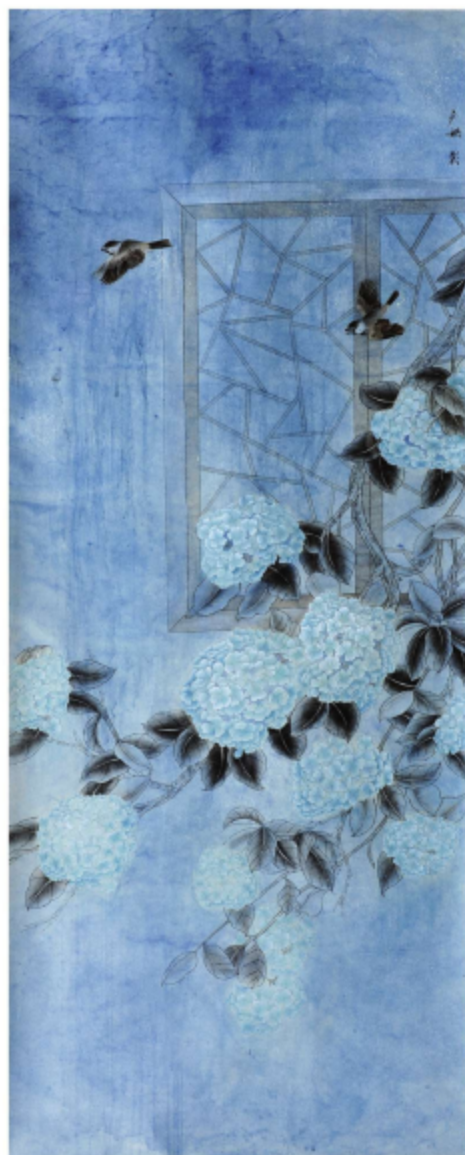
作品名称\静谧 作者\卢珊 指导老师\梁卫民