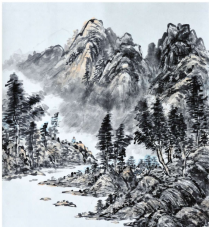
作品名称\行人远眺图 作者\戴喜道 指导老师\季玉民