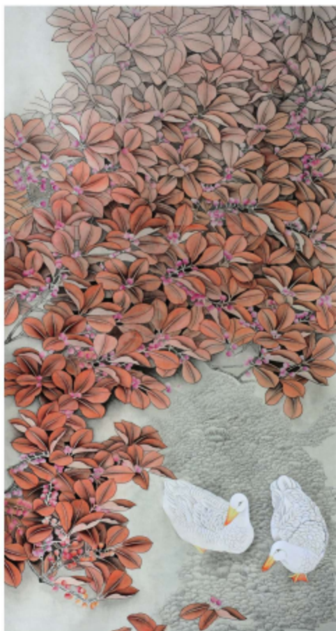
作品名称\果甜细语 作者\陈宇月 指导老师\殷晓克