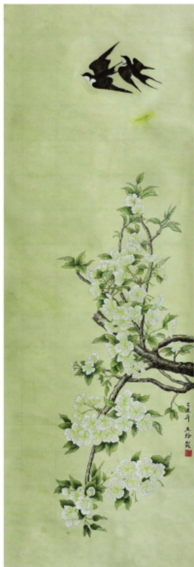
作品名称\梨花春暖燕双飞 作者\王珍 指导老师\梁卫民