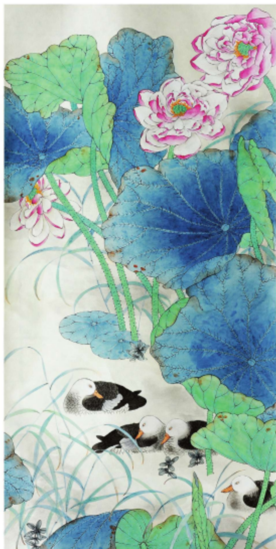
作品名称\荷 作者\黄佳怡 指导老师\殷晓克