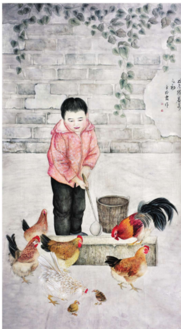
作品名称\农家乐 作者\李玲霞 指导老师\梁卫民