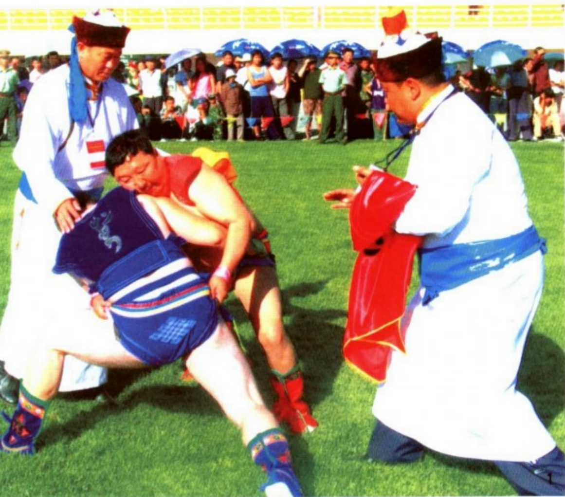
2—3. 4-дөр 5-дөр 1. 6-дөр 7-дөр 8-дөр