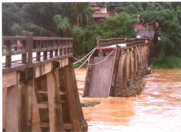
五华县华城镇华西桥坍塌现场。