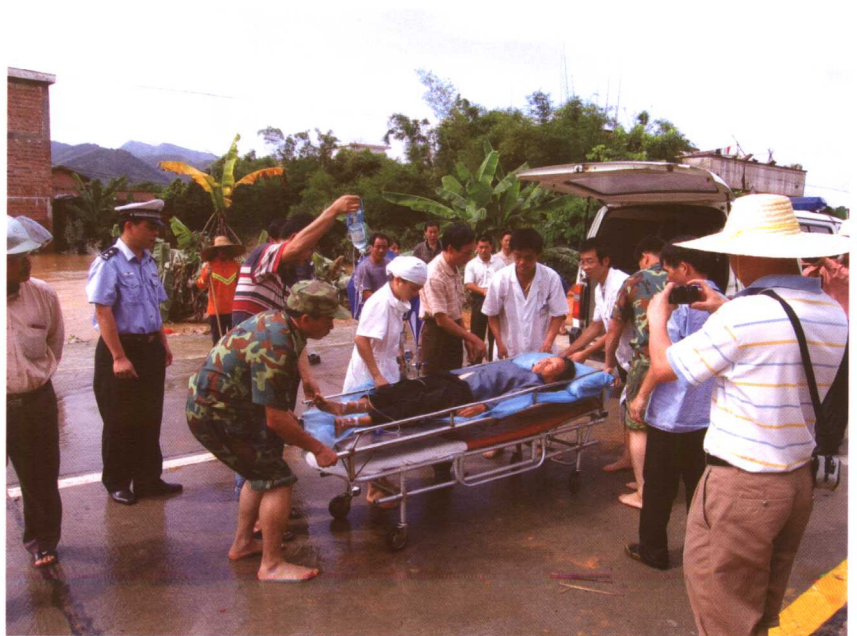
省卫生厅派出的医疗防疫队队员在河源灾区抢救受灾群众。