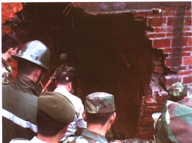
河源市龙川县枫林镇因山体滑坡造成房屋倒塌。

4月25~26日，广东省普降暴雨，梅州、茂名等市出现8~12级雷雨大风，部分地区受灾。