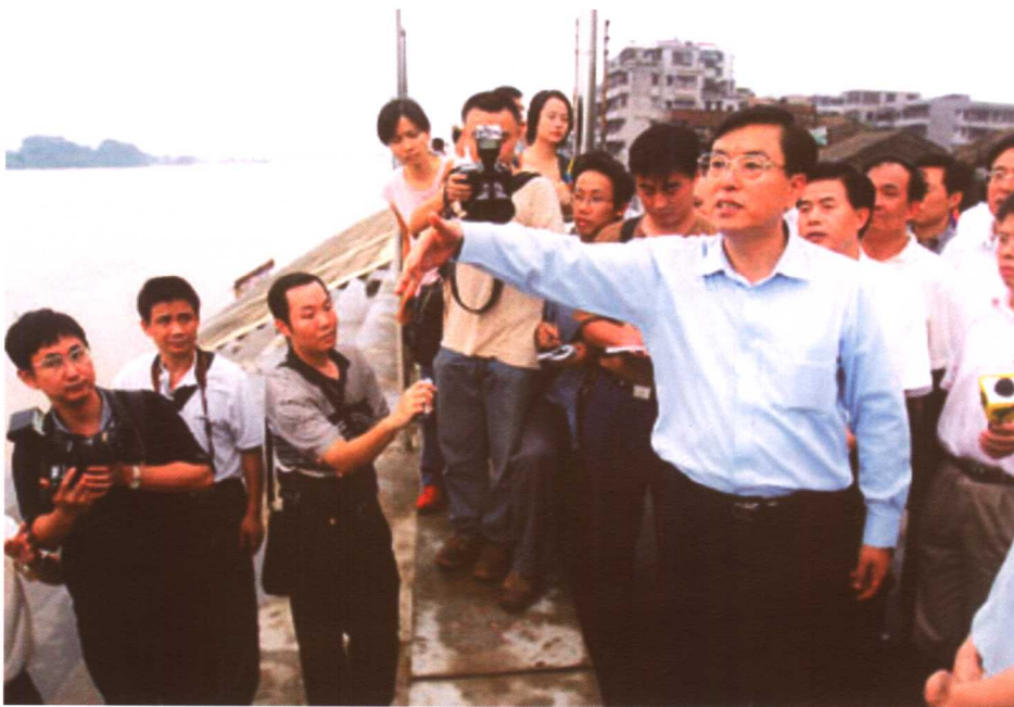
中共中央政治局委员、省委书记张德江和省长黄华华在一线指挥抗洪。