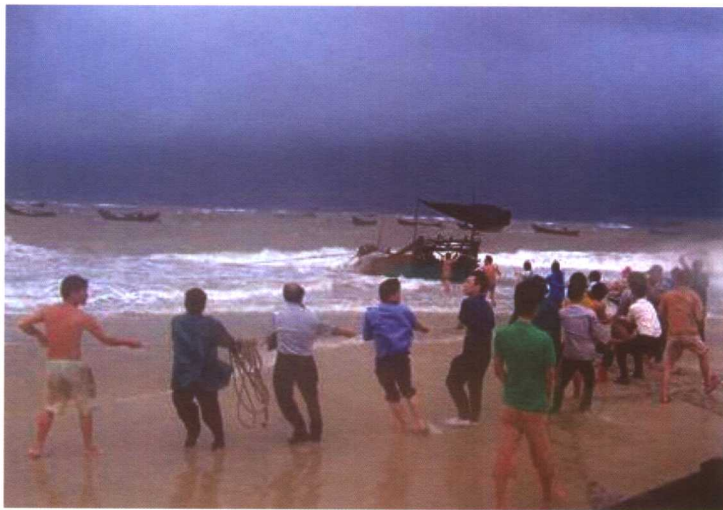
电白渔政大队和电白船东互保代办处人员与渔民一起防风抗灾。

9月26日4时，第0518号台风“达维”在海南省万宁市沿海地区登陆。受其影响，湛江、茂名、阳江、江门、汕尾5市、19个县、132个乡镇（镇）、75.46万人受灾，全省直接经济损失4.25亿元，其中湛江市损失3.33亿元。