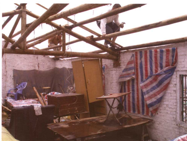
6月28日，佛山市南海区大沥沥中教心村出现龙卷风。图为沿街店铺（左图）和居民房屋（右图）受损情形。