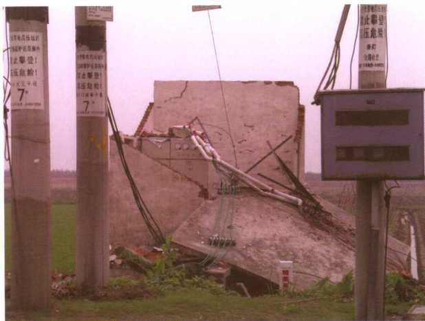
广州市番禺区横沥镇被大风损毁的变电站。