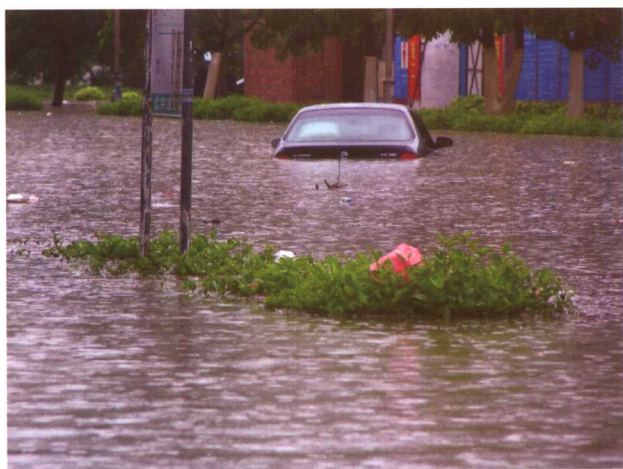
珠海市街道上浸泡在深水中的车辆。