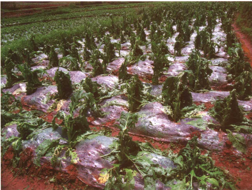
乐昌市受灾的黄烟。