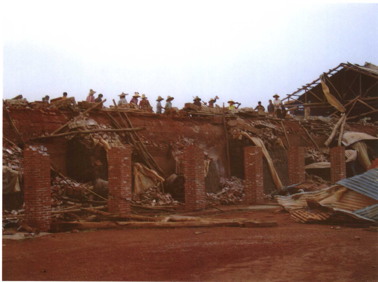
7月13日，徐闻县下桥镇南华农场砖厂出现龙卷风，目测风力阵风12级以上。龙卷风造成该厂7人受伤，一台手扶拖拉机从坡地被卷到稻田里，一幢厂房被毁。图为被毁的厂房。