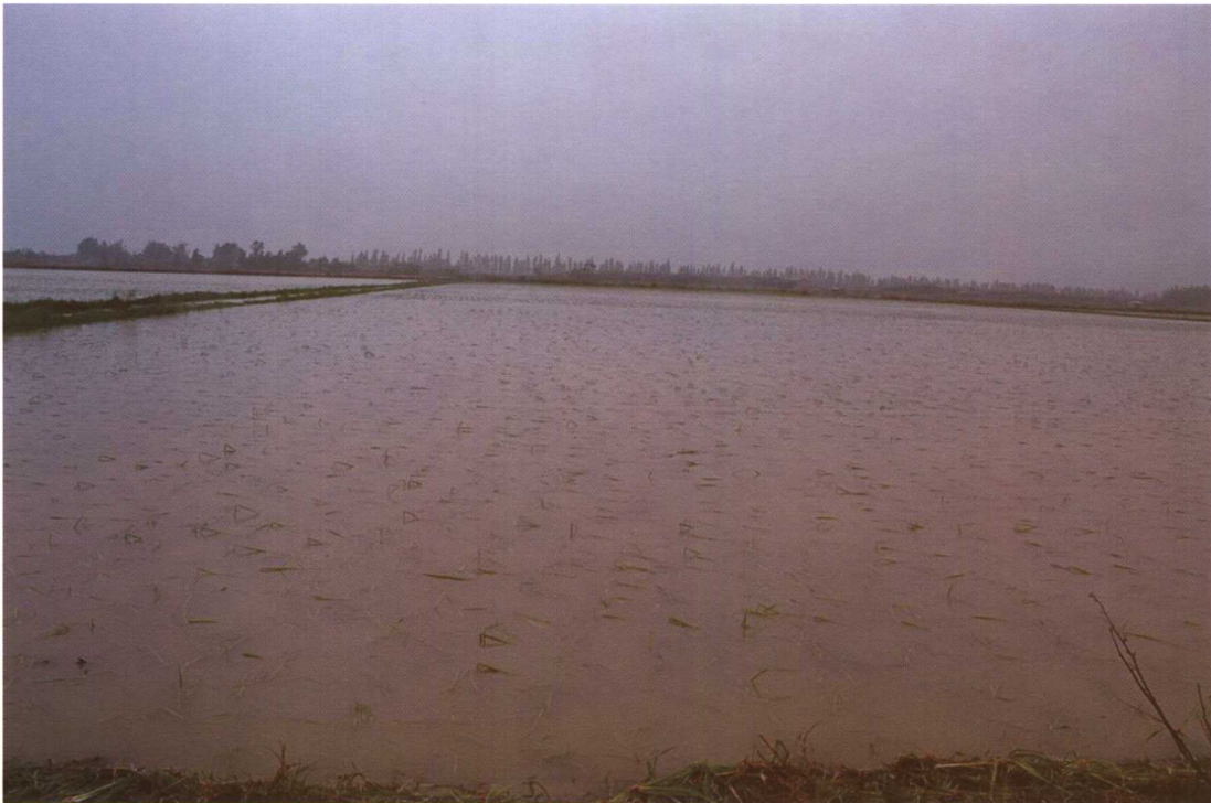
粤东沿海稻田一片汪洋。

8月13日，第0510号强热带风暴“珊瑚”在汕头市澄海区盐鸿镇登陆。“珊瑚”使汕头、潮州、梅州和揭阳4市、21个县(市、区)、185个乡镇、148.81万人受灾，全省直接经济损失3.136亿元。