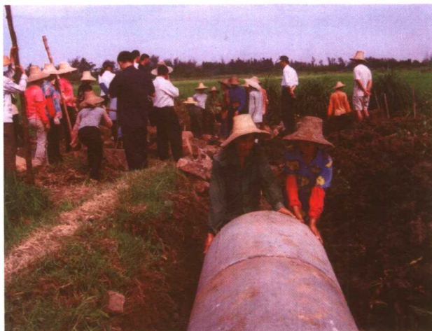
徐闻县南山镇芒海村群众排队等水（左图）和兴修水利抗旱情景（右图）。