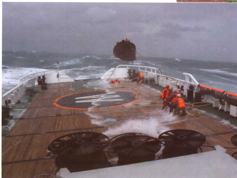
“粤陆丰61088”渔船在汕尾东南海面燃油耗尽，又恰逢“达维”影响，情况危急。经省海上搜救中心组织救助两天两夜后，5名遇险人员被安全救起。图为救助现场。