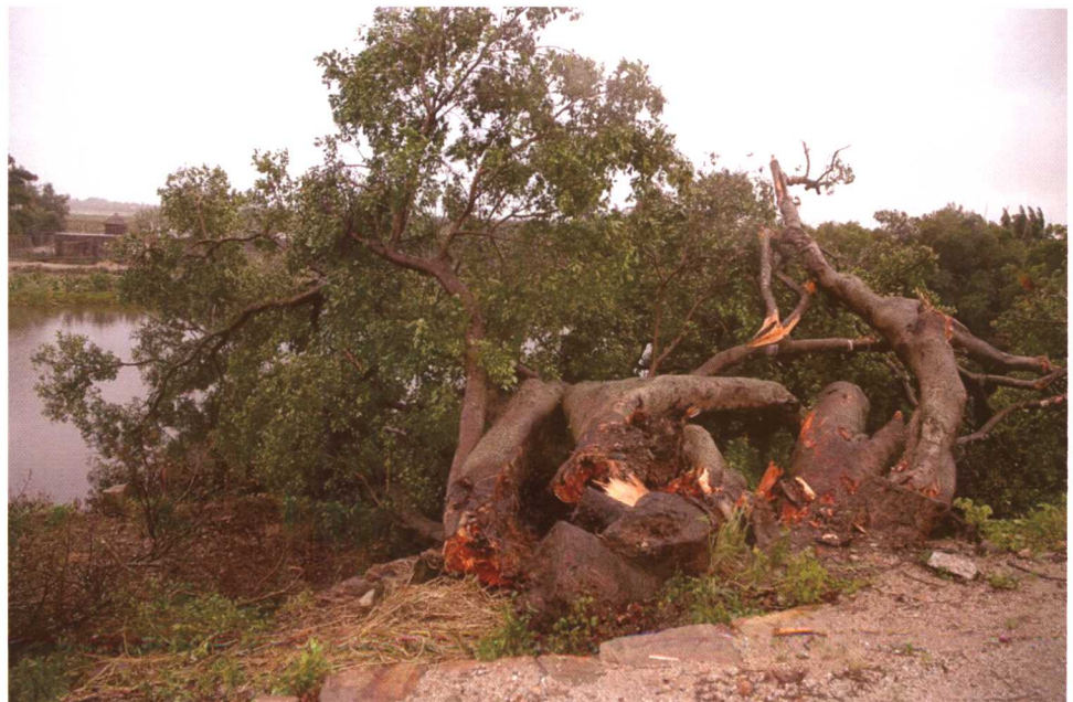
粤东沿海大树折断。