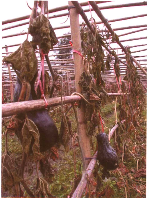
成长中的砍瓜瓜秧被冻死。