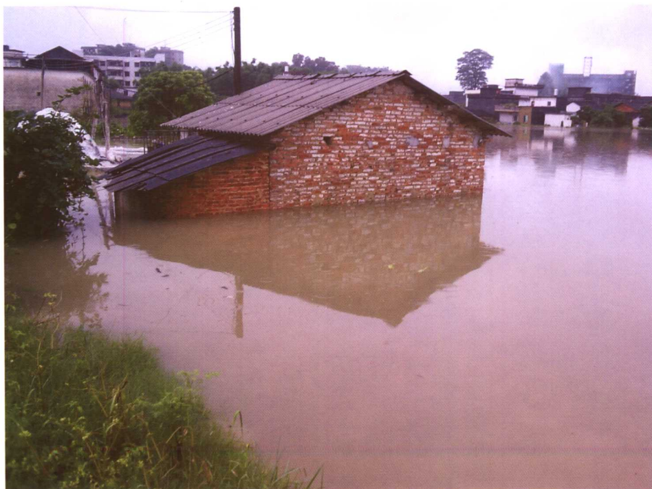
龙门县汪洋中的民房。