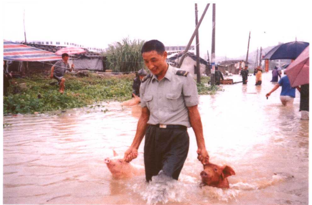
解放军驻粤某部战士在抢救群众财产。