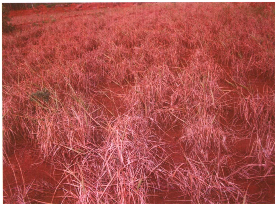
徐闻县南山镇东沟岭良姜早死情景。