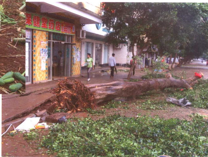
徐闻县大树被连根拔起。