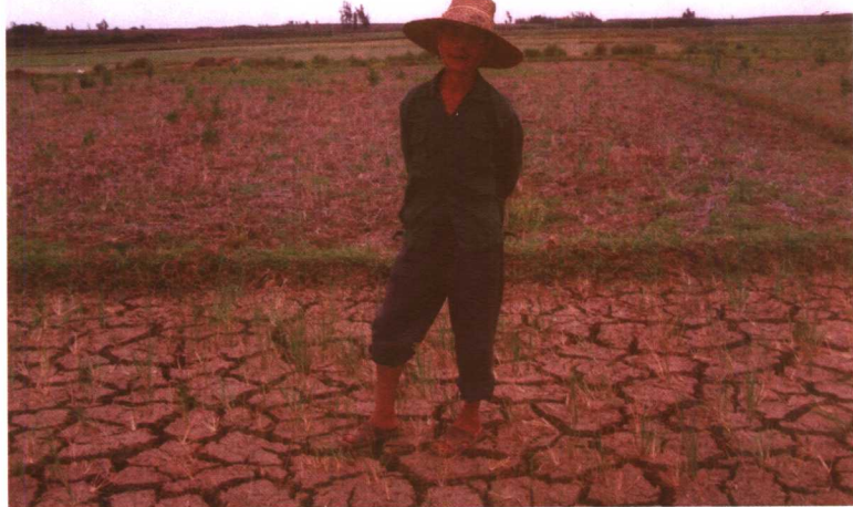
徐闻县曲界镇仙安洋水稻全部早死。

2004年秋至2005年初夏，雷州半岛遭遇特大干旱。徐闻县从2004年9月24日开始连续248天无“透雨”，打破1902年以后的记录，各地出现严重灾情。