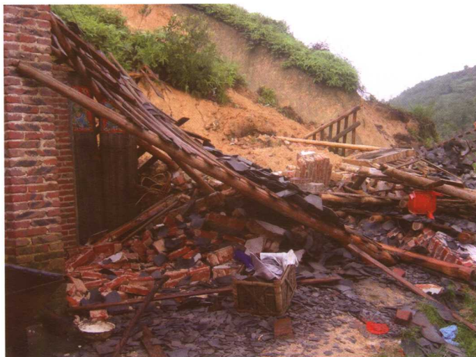
佛冈县山体滑坡现场。

6月18~25日,广东省出现特大致洪暴雨,西江、东江、北江、韩江及东南沿海大小河流均发生洪水,其中西江洪水超百年一遇。受其影响,全省443万人受灾,死亡65人,倒塌房屋40多万间,全省直接经济损失49.7亿元。