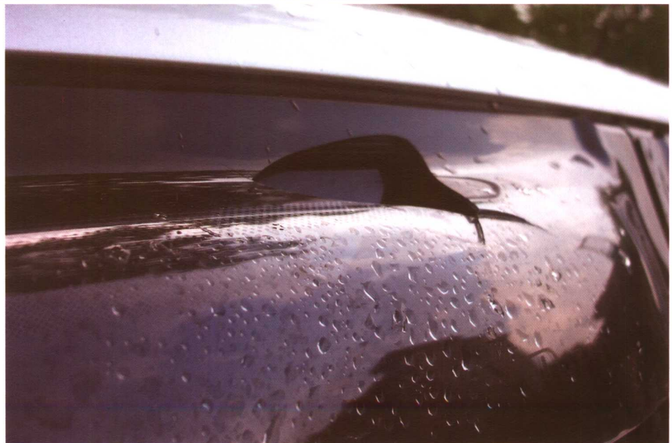
乐昌市被砸坏的汽车。