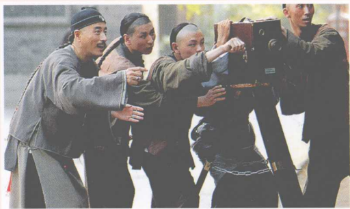
◎故事片《定军山》剧照