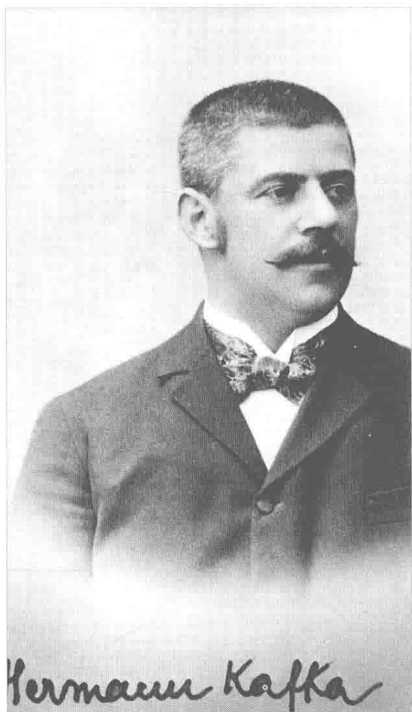
卡夫卡的父亲赫尔曼·卡夫卡 (1852—1931)