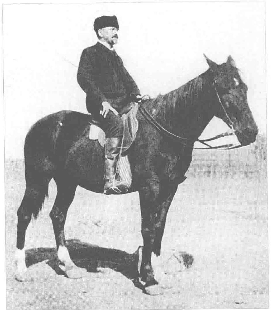
卡夫卡的舅舅西 格弗里德·勒维