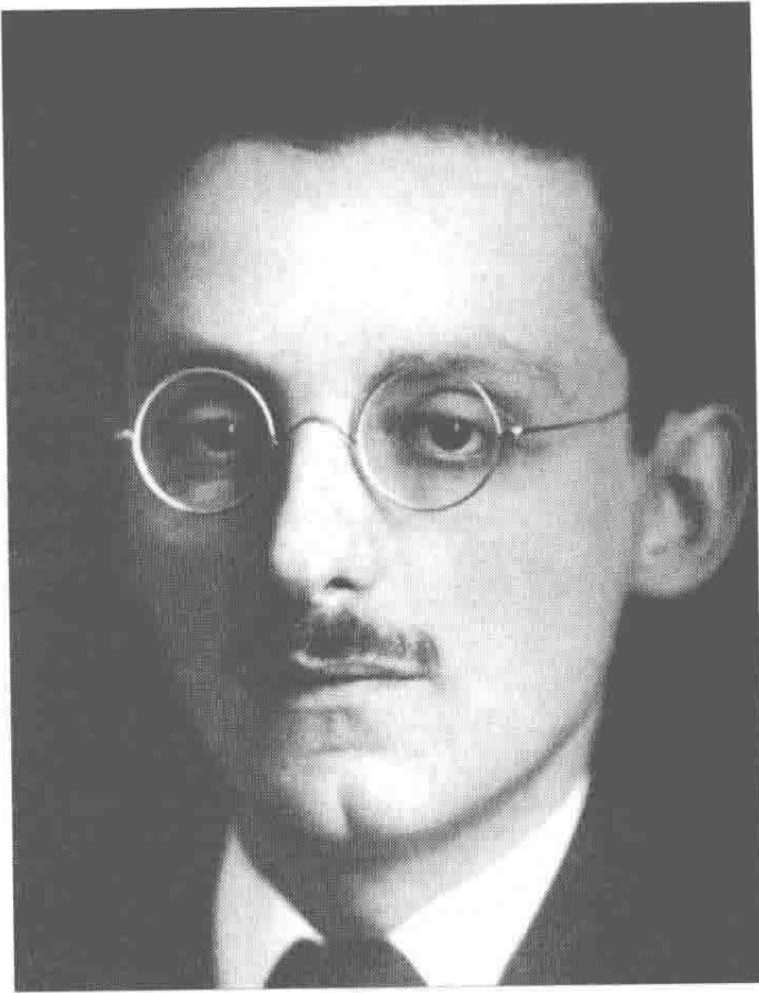
卡夫卡的挚友马克斯·布罗德