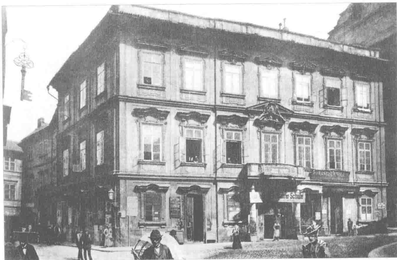
卡夫卡于 1883 年 7 月 3 日生于此楼（布拉格）