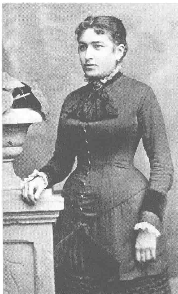
卡夫卡的母亲尤丽叶·勒维 (1856—1934)