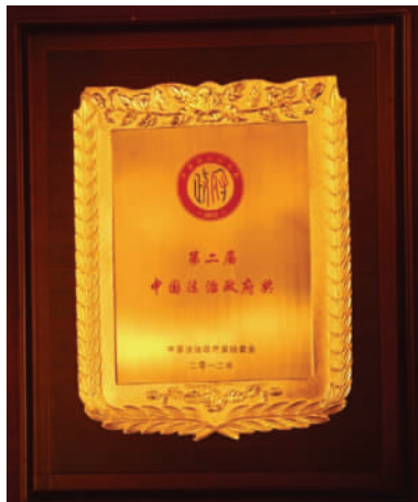
2012年12月23日，“广州市完善重大决策程序规范 推进科学民主依法决策”项目荣获第二届“中国法治政府奖”

2009年，广州市第四轮行政审批制度改革向区（县级市）政府下放行政审批事项129项、扩大其他管理权限65项。2010年，广州市着眼加快转型升级、提升科学发展实力、建设幸福广州的目标，再次启动简政强区事权改革。2011年3月30日，印发《中共广州市委、广州市人民政府关于简政强区（县级市）事权改革的决定》。4月10日，市委、市政府批准印发《中共广州市委办公厅、