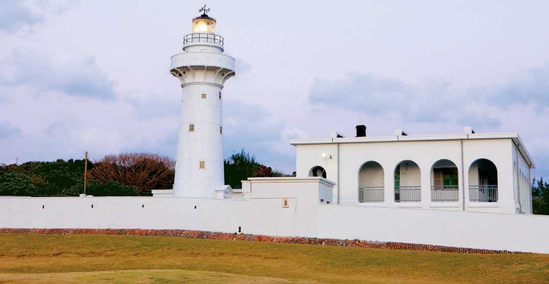
位于台湾最南端的鹅銮鼻灯塔