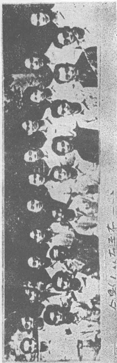
1946年春，东北大学“民主青年同盟”骨干成员在校部合影。