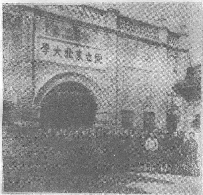
东北大学中文系师生在校门前留影（1946年摄）