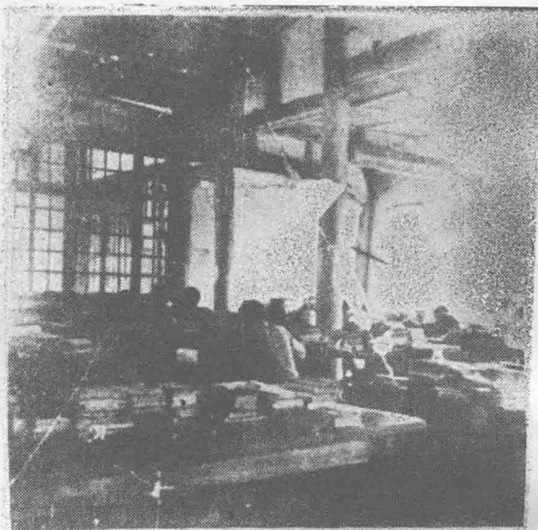
东北大学学生在校部图书馆里读书。