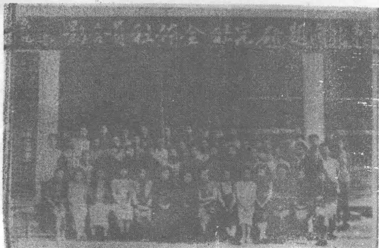
“东北问题研究社”社员在校部合影（1945年摄）