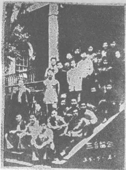
1946年5月，东 北大学进步学生团体 “学习社”成员在校 部留影。