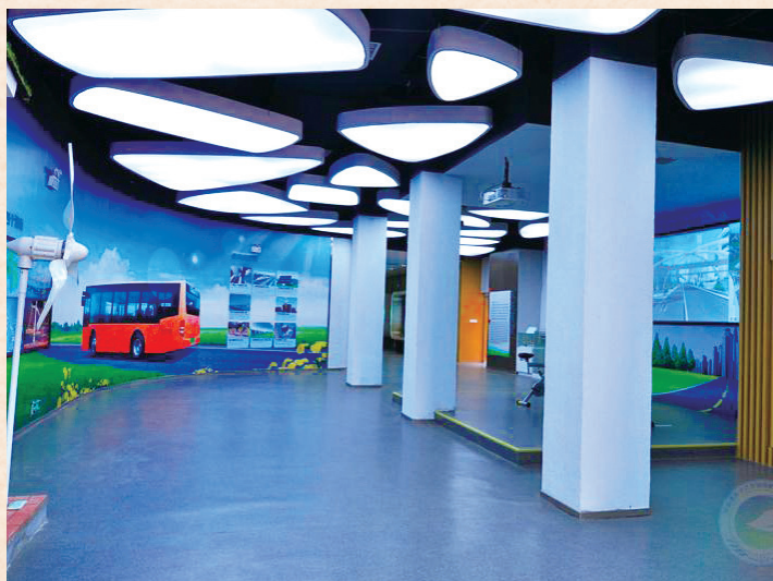
//长株潭“两型社会”国家未来展望厅 /