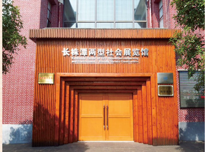
//长株潭“两型社会”展览馆外观 //