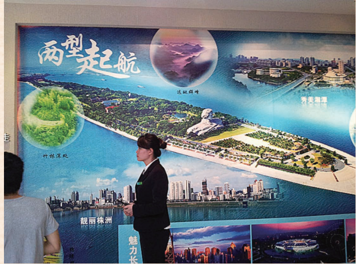
//长株潭“两型社会”展览馆阶段成果厅 /