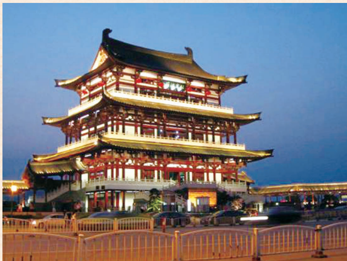
//长株潭湘江生态风光带长沙杜甫江阁 //