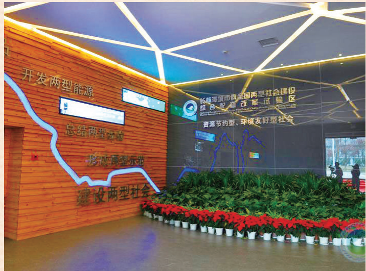
//长株潭“两型社会”展览馆序厅 //