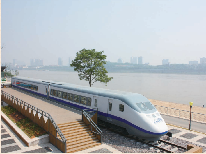
// 株洲湘江风光带火车头广场 //