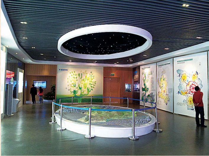
//长株潭“两型社会”展览馆顶层设计厅 //