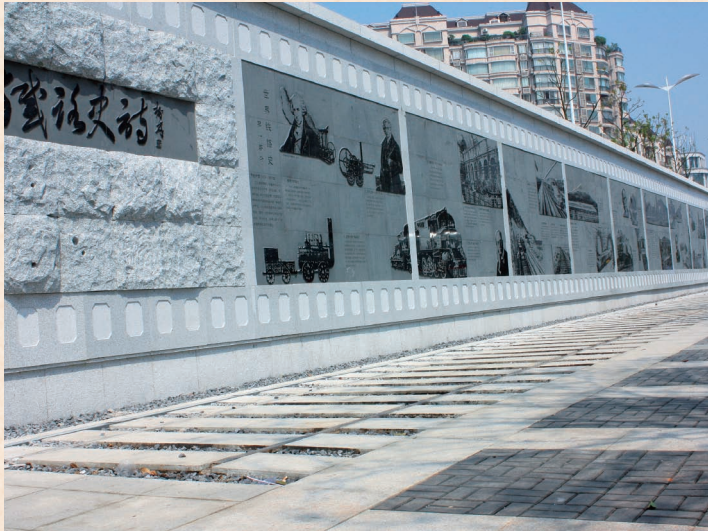
// 株洲湘江风光带故事墙 //