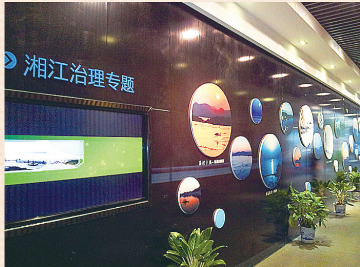
//长株潭“两型社会”展览馆阶段成果厅 /