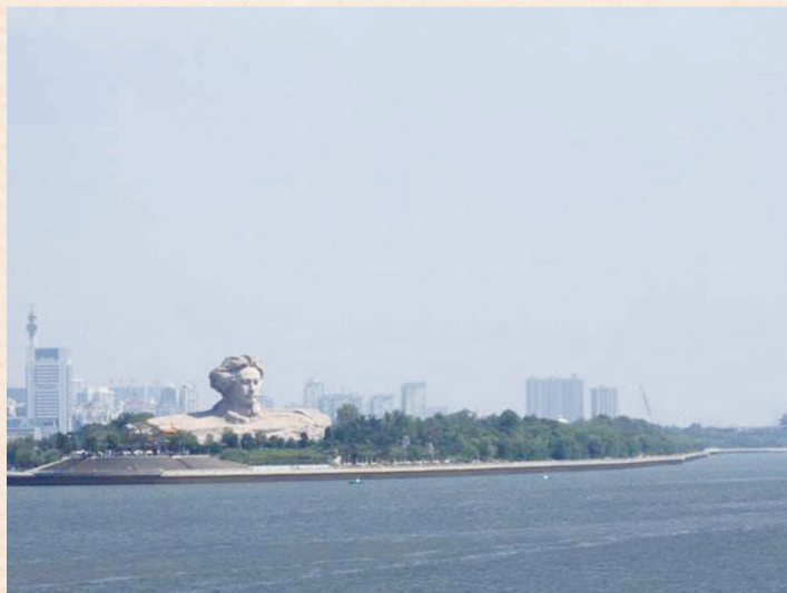
//风光带联接点长沙橘子洲青年毛泽东雕像 //