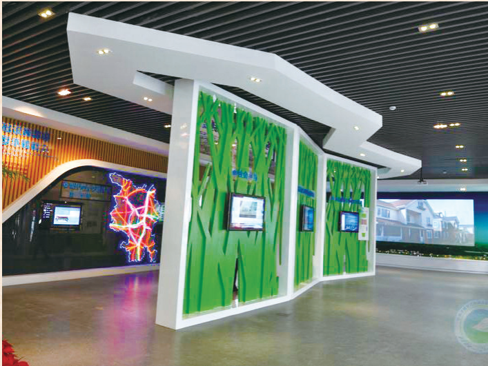
//长株潭“两型社会”展览馆阶段成果厅 //