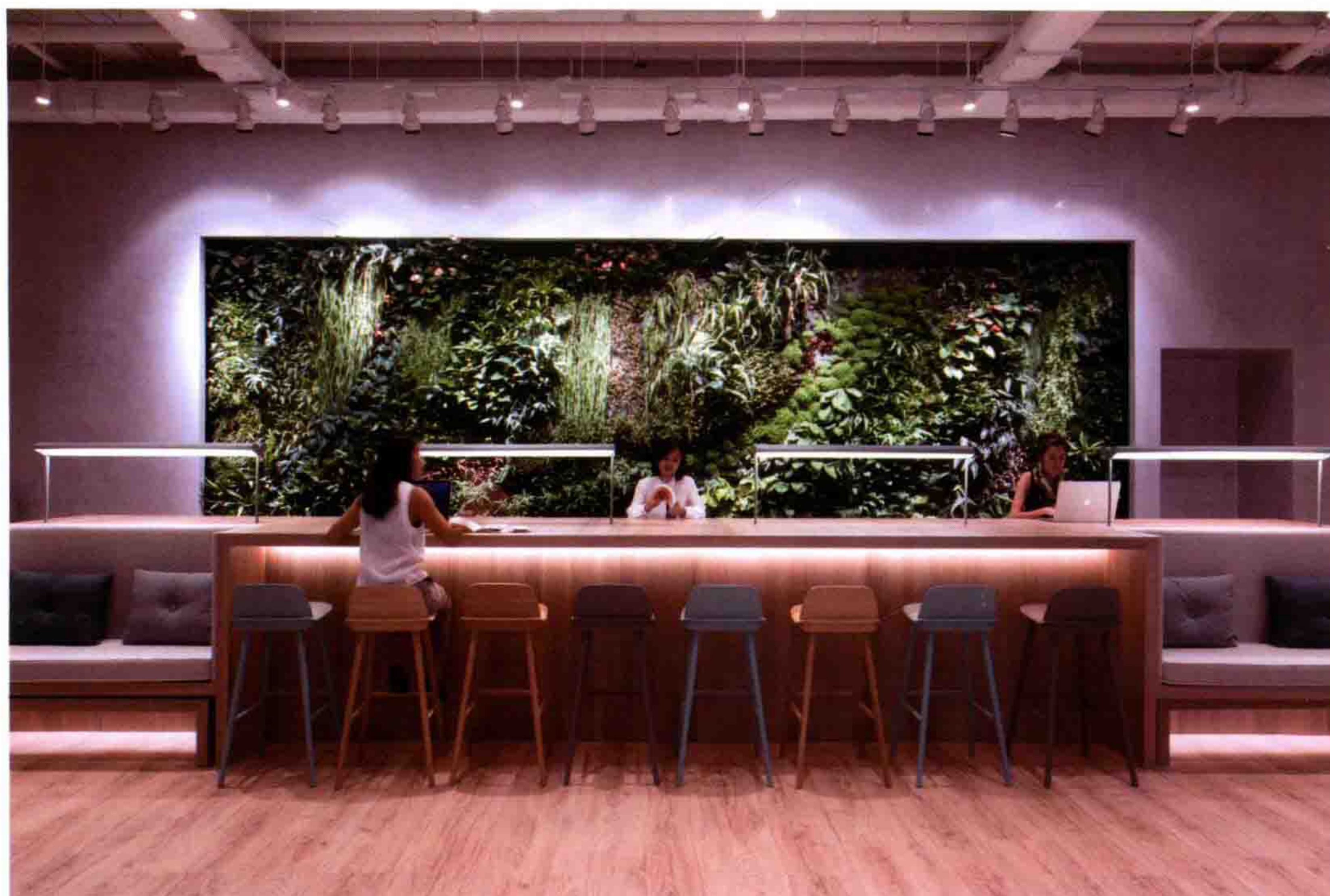
图片说明: The Work Project 中的花园共享办公区,由 Bean Buro 设计。垂直水培绿色植物墙由 Bean Buro 和植物学家 Patrick Blanc 合作设计。