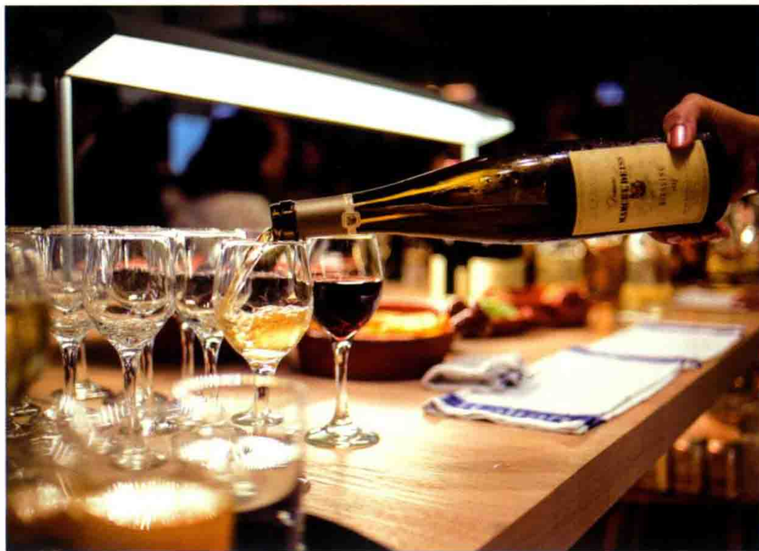
The Work Project 可举办的活动包括分享会、演讲、音乐会、品酒会等等。

资的原因,这往往会产生不舒适或非功能性的办公空间,这些空间缺乏整合和激情,因此造成了无法与员工建立良好关系或无法吸引人才的更大问题。