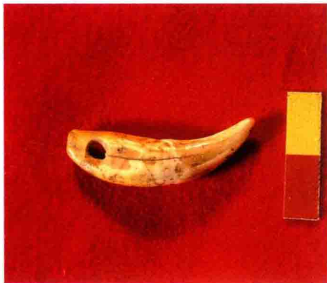
普定白岩脚洞人的穿孔装饰品