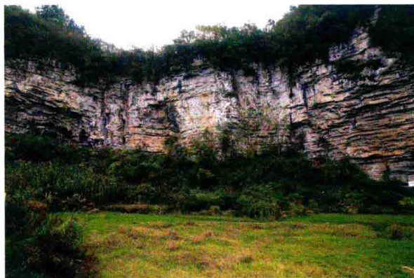
龙里巫山岩画石壁

播州是贵州四大土司之一。播州历代土司与中央朝廷关系融洽，土司地位稳定，境内物产丰富，实力强劲，先