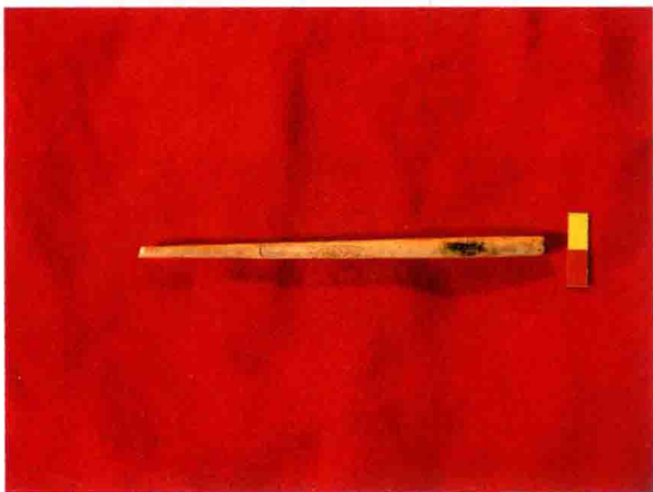
普定白岩脚洞人的骨笄

贵州民族民间美术以其精美的造型、精湛的技艺、丰富多彩的样式，以及深厚的民族文化内涵而盛誉于世。已经出版的《中国贵州民族民间美术全集》五卷本（分别为《银饰》、《刺绣》、《挑（花）织（锦）》、《蜡染》、《傩面》），向人们展示了银饰的精美华贵、刺绣的精致热烈、挑花织锦的精细工整、蜡染的质朴典雅、傩面的神秘古朴。这些精美绝伦、举世罕有的贵州民族民间美术品及其技艺，已被列入国家级非物质文化遗产保护名录，成为优秀的中华传统文化的组成部分。除这些瑰宝之外，更多的器物用具，如泥陶、石刻、木雕、竹编、藤编、漆器、纸品、乐器、杂件等，同样彰显着贵州民族民间美术的丰富多彩和别具特色的造型风貌。