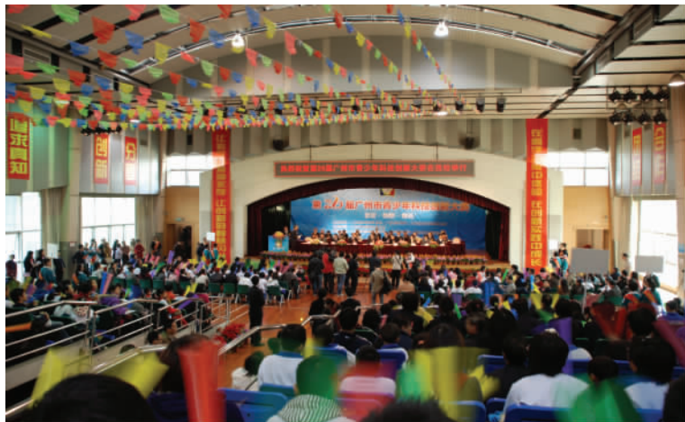
第 26 届广州市青少年科技创新大赛举办

1—3 日 由广州市科技和信息化局、广州市科学技术协会等单位联合主办的“第 26 届广州市青少年科技创新大赛”在广东实验中学举行。大赛首次设立“市长奖”，对优秀的青少年科技创新人才进行表彰和奖励。