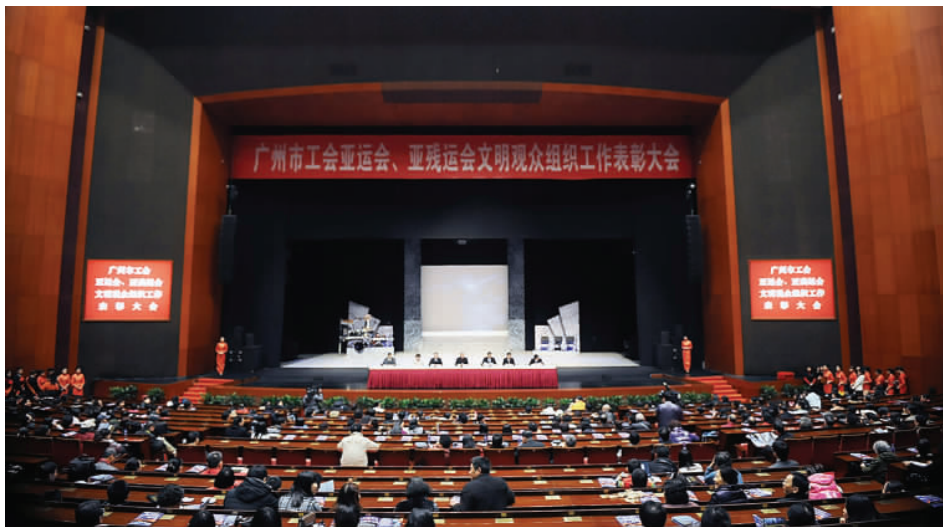
广州市工会亚运会、亚残运会文明观众组织工作表彰大会现场