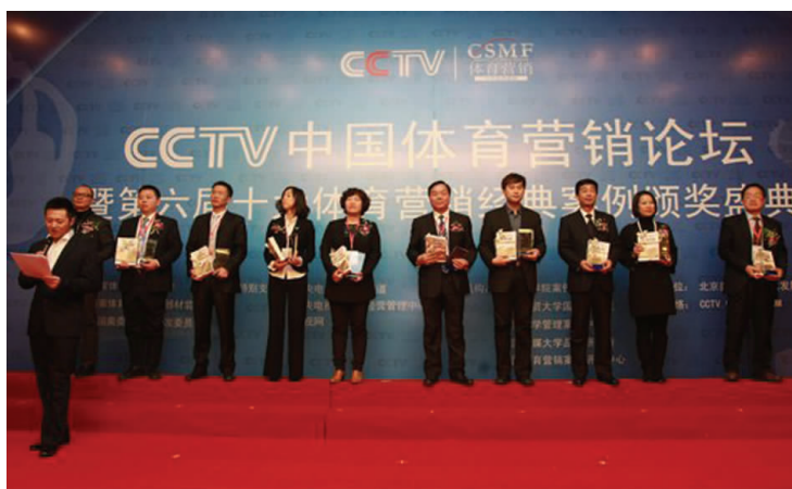
广之旅荣获“CCTV 体育营销经典案例”大奖

6日 岭南集团旗下广之旅荣获“CCTV 体育营销经典案例”大奖。广之旅于2010年成为亚运会旅游服务供应商及广州亚运志愿信使团指定组团社，共组织1036个“亚运志愿信使团”近10万名普通市民担当亚运志愿信使，前往世界21个国家120个城市宣传亚运，成为华南地区旅行社业内首个旅游与体育有机结合、持续时间超过一年的大型事件营销成功案例。