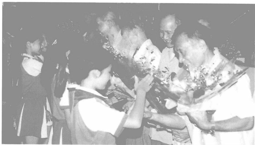
少先队员向归侨抗日老战士特邀代表敬献鲜花。