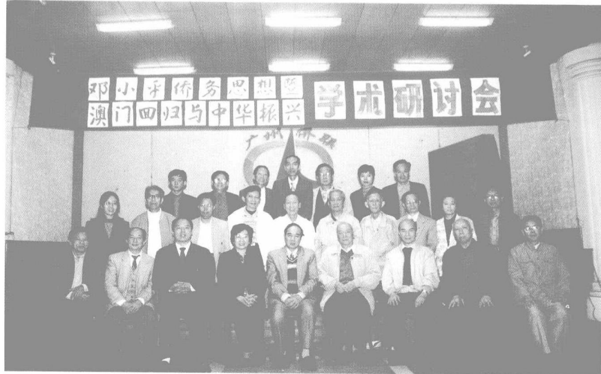
“邓小平侨务思想暨澳门回归与中华振兴”学术研讨会在广州召开，围绕“一国两制”的伟大构想和澳门的经济、历史、文化及回归后的前景进行研讨（1999年11月）。