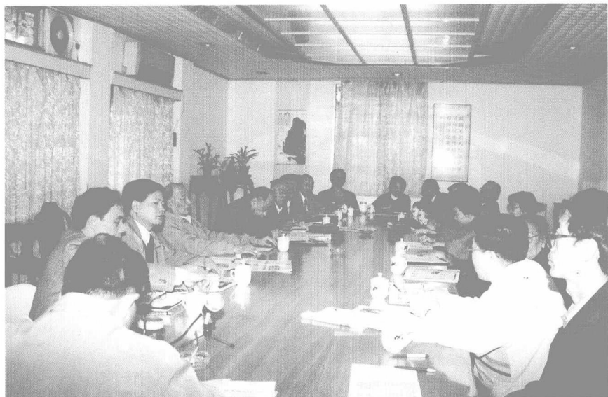
广州市侨史学会部分专家学者座谈江泽民总书记关于台湾问题的八项主张(1995年2月)。