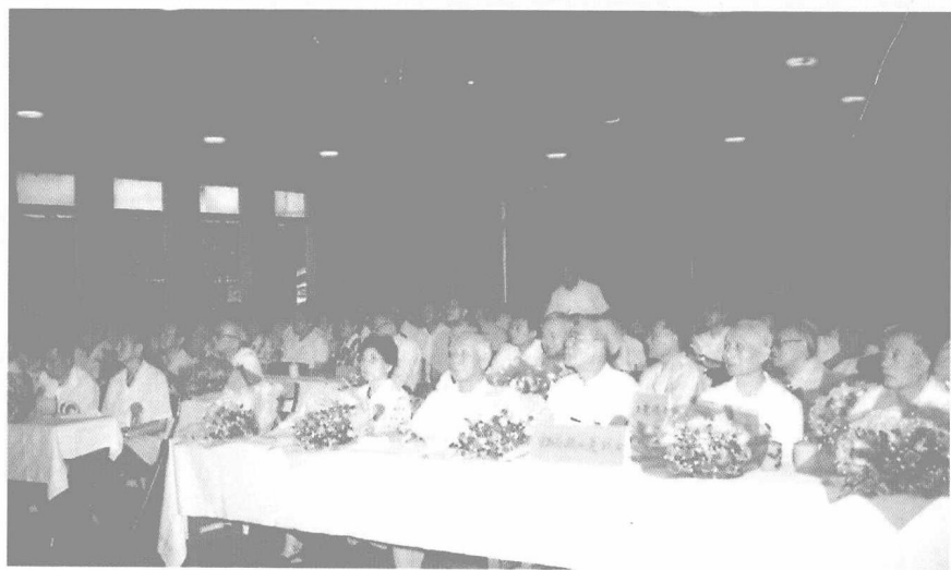
隆重召开广州地区归侨侨眷纪念抗日战争胜利五十周年大会,弘扬爱国主义、振奋民族精神。图为大会会场(1995年8月)。