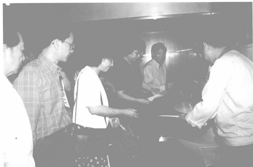
广州市侨史学会部分理事、专家、学者前往广州经济技术开发区考察，就“科技兴市、外向带动”进行调研。图为理事们参观中外合资企业广州三菱电机公司（1998年）。