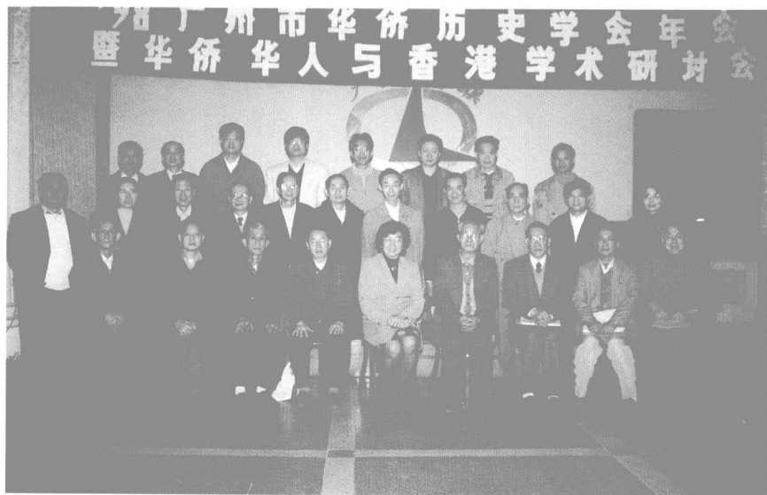
学会配合香港回归举行“华侨华人与香港”学术研讨会。图为部分理事、专家学者合影（1998年1月）。