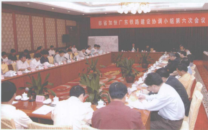
2006年4月6日,铁道部广东省联合召开加快广东铁路建设协调小组第六次会议。