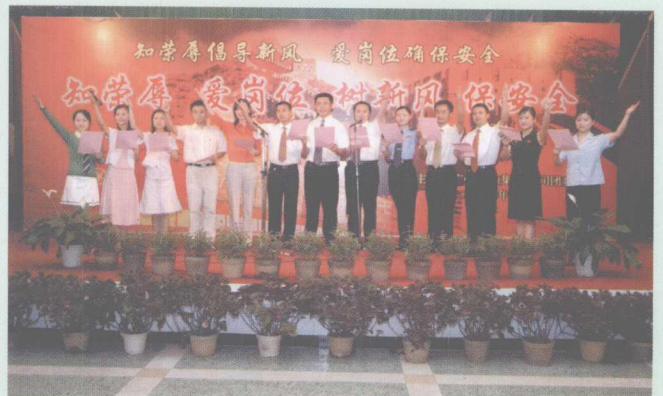
2006年6月15日,集团公司团委举办“知荣辱 爱岗位 树新风 保安全”演讲。