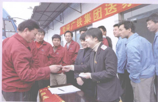
2006年1月6日，车站售票人员送票上门。