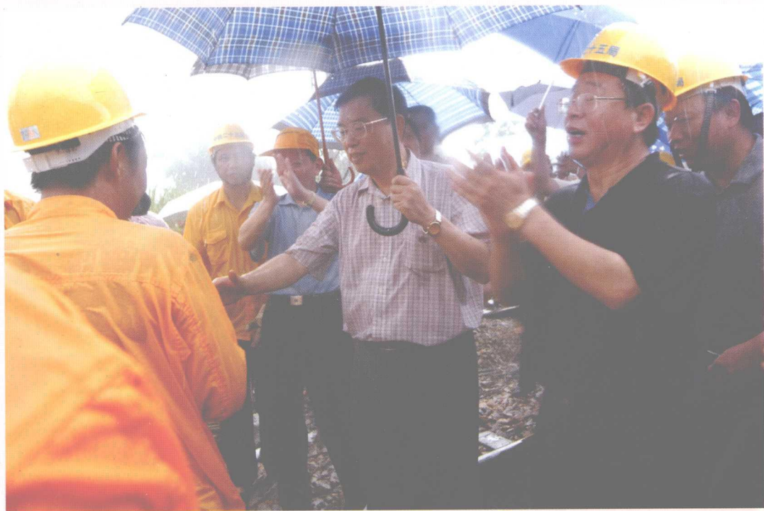
2006年7月18日,中共中央政治局委员、广东省委书记张德江在乐昌冒雨视察铁路抗洪抢险工作。