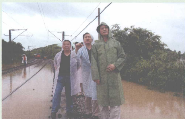
2006年7月17日,铁道部副部长卢春房深入水害现场查看线路情况。