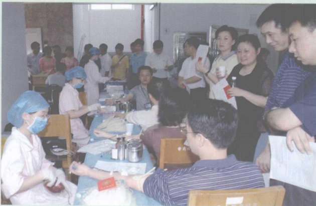
2006年5月11日,集团公司机关干部义务献血。