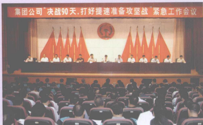
2006年11月18日,集团公司召开“决战90天,打好提速准备攻坚战”紧急工作会议。

2006年11月1日至12月31日,集团公司开展“决战90天,打好提速准备攻坚战”。图为道岔捣固作业。