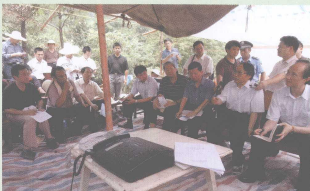
2006年7月24日,铁道部部长刘志军在京广线坪石北施工现场指挥线路修复工作。