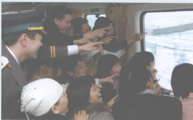
首发广州——拉萨列车上旅客欣赏窗外风光。