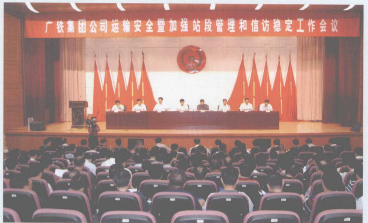
2006年6月22日,集团公司召开运输安全暨加强站段管理和信访稳定工作会议。