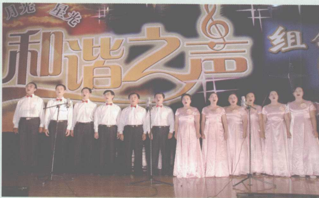
2006年9月30日,集团公司举办阳光、月光、星光和谐之声演唱大赛。