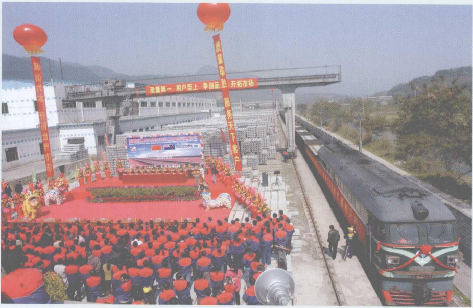
2006年3月2日,乐昌轨枕厂轨枕出口新西兰,列车在乐昌开出。