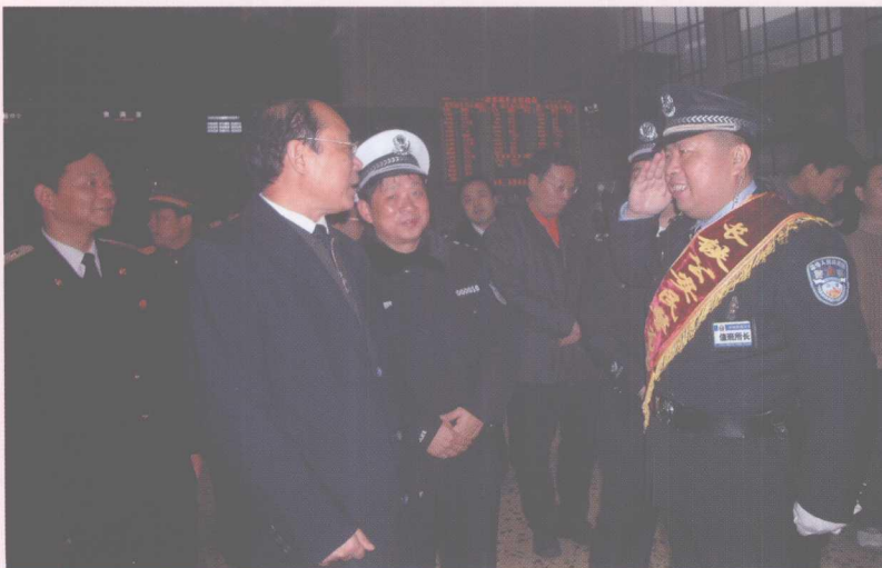
2006年1月14日,湖南省副省长许云绍视察长沙站春运工作。