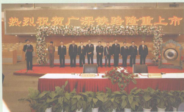
2006年12月22日,广深铁路A股在上海证券交易所挂牌上市。右图为铁道部副部长王志国敲响开市铜锣。上图为仪式会场。