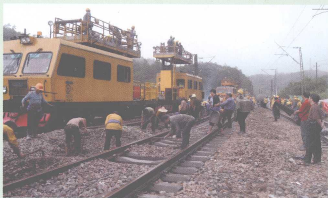
抢修受灾影响的线路、电网。