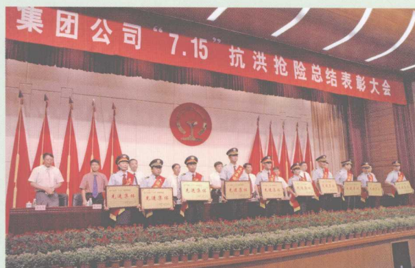
2006年8月11日,集团公司召开“7.15”抗洪抢险总结表彰大会。广东省委副书记欧广源出席会议并讲话。