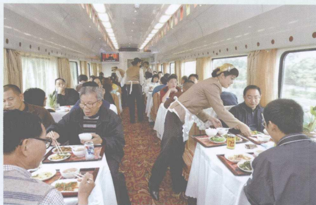
青藏列车餐车。