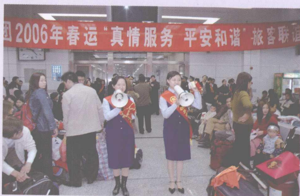
青年志愿者向旅客宣传春运安全知识。