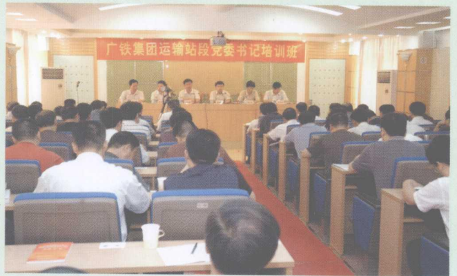
2006年10月13日,集团公司运输站段党委书记培训班在集团党校开班。