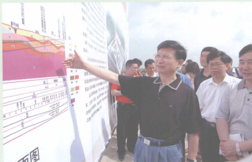
2006年5月9日,铁道部、广东省联合现场办公推进铁路建设。图为常务副省长钟阳胜在狮子洋隧道工地。