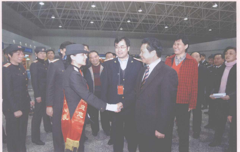
2006年1月28日,广东省常务副省长汤炳全到广州东口岸慰问。