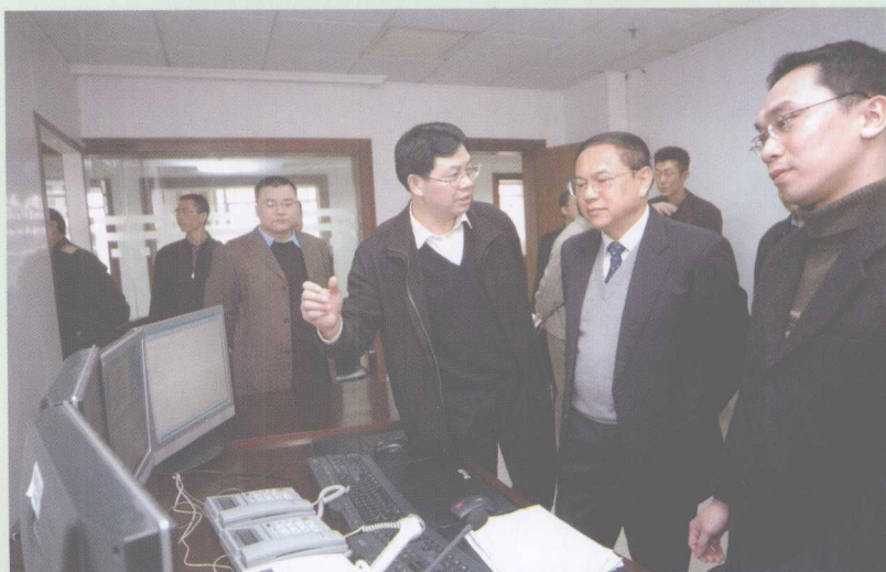
2006年1月13日,广东省省长游宁丰视察广铁集团电话订票和调度系统。