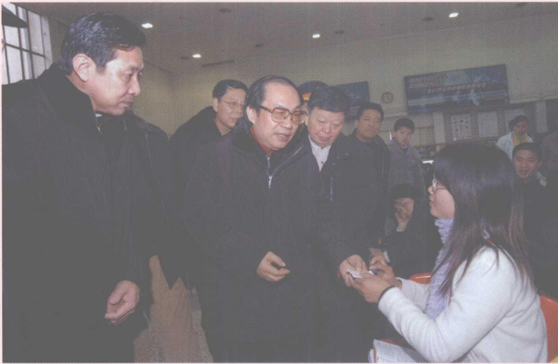
2006年1月31日,铁道部部长刘志军在长沙站候车室访问旅客。