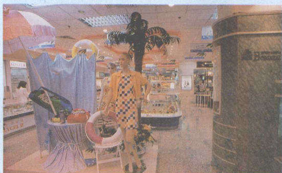
免税二分店入口处的装饰，充满动感活力。