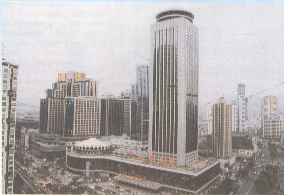
物业集团——国贸广场

一楼擎天百业旺，八方聚财万物兴。“物业”在深圳特区的改革开放和经济建设中崛起。特区的各项事业方兴未艾，“物业”的未来前程似锦。