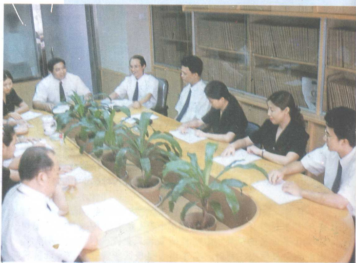
公司领导在研究工作

该所恪守职业道德,以《中国注册会计师独立审计准则》规范审计工作,为社会各界提供高效率高质量的服务。