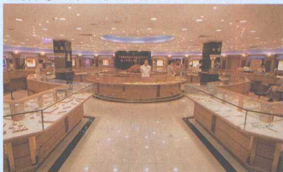
免税二分店金行，是深圳目前经营面积最大的金行。