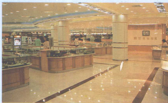
重新装修后的国贸免税商场。