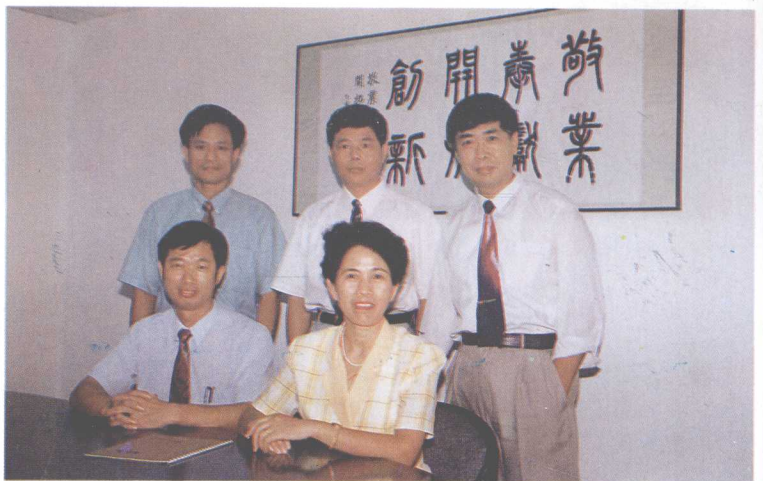
所(合伙人会议成员)领导班子

深圳中达信会计师事务所是经广东省政府批准，深圳市财政局颁发执业许可证的独立法人中介机构。本所是一所中等规模以上的会计师事务所，从业人员达70余人，目前设有审计一、二、三部，资产评估部、工程预决算部、咨询拓展部、宝安分部、沙井办事处、福永办事处、龙华办事处、新安镇办事处等业务部门，云集了一批精通会计、审计、财税、资产评估、工程造价方面的专业人员。