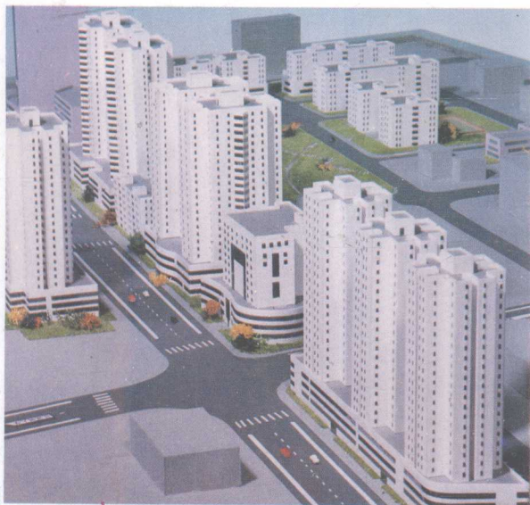
正在拆迁兴建中的深圳市南山区南新街旧城改建工程全貌，图中多层住宅小区九七年底交付使用。

目前，公司建成并交付使用的东湖路华秀花园和南山区常兴路常兴花园多层住宅小区，已进入高层次的规范管理中；位于滨河路南海滨广场的集华花园，建筑面积 26024 平方米，由两幢二十层住宅楼组成，交付使用两年多来，在创建安全文明小区活动中，受到社会各界的高度重视。公司在广州天河中心区投资兴建的三十二层“广东侨联商业中心”，总建筑面积六万平方米，现已接近竣工，并在发售之中。南山区南新街旧城改建工程是公司重点项目，占地 50342.5 平方米，建筑面积达十六万平方米，整个投资近 5.5 亿元，将兴建多层住宅，高层商住楼及公共配套设施等。规划分期建设；首期工程“华府花园”八栋多层住宅建筑面积 3.1 万平方米，已售 80%，将于九七年底交付使用。公司同时拥有龙华花园 3 万平方米的开发项目等。热诚欢迎各界人士前来洽谈投资，共同发展。