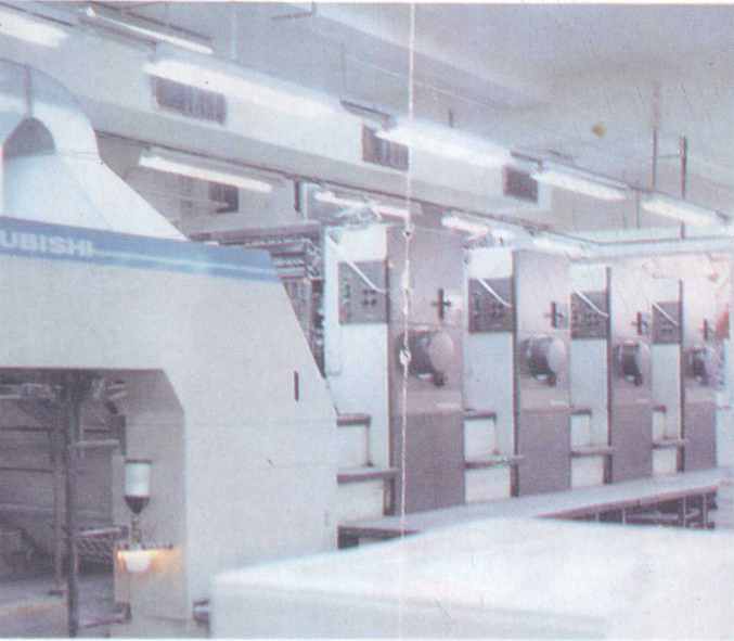
嘉年公司纸箱生产设备