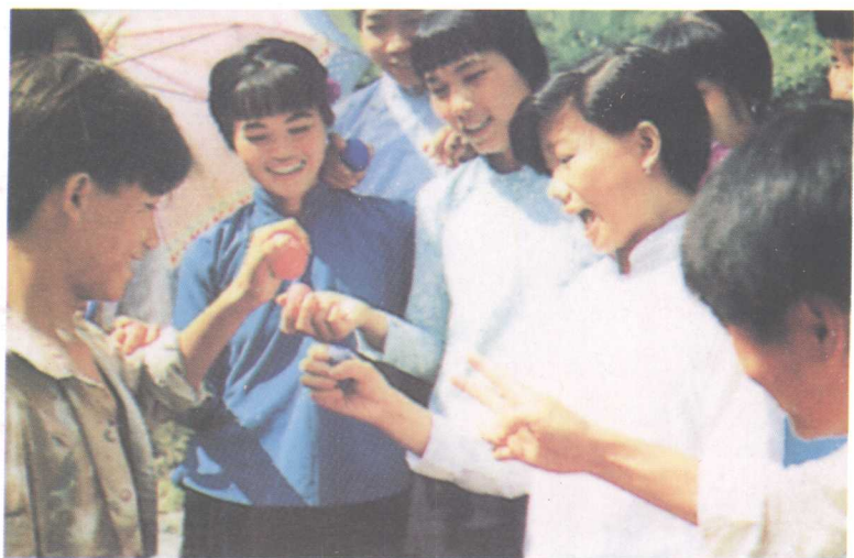
壮族歌节青年男女在碰蛋