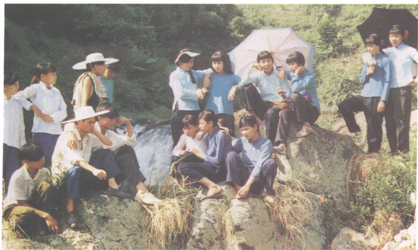
壮族歌节青年男女在对歌