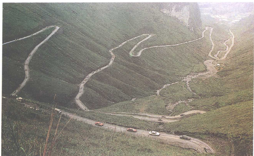
山 区 公 路