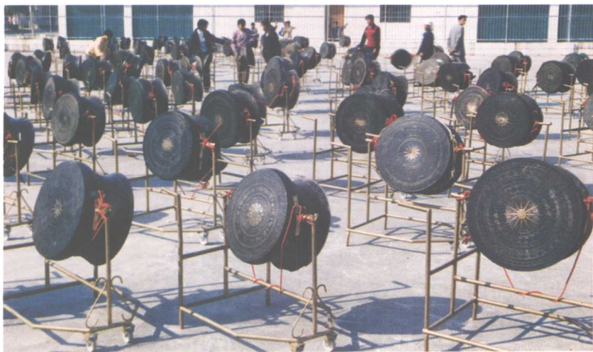
铜鼓之乡（已知全县民间传世铜鼓 300 多面）