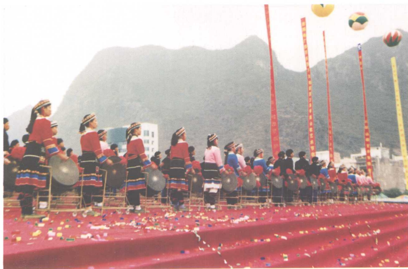
铜鼓艺术节——铜鼓魂