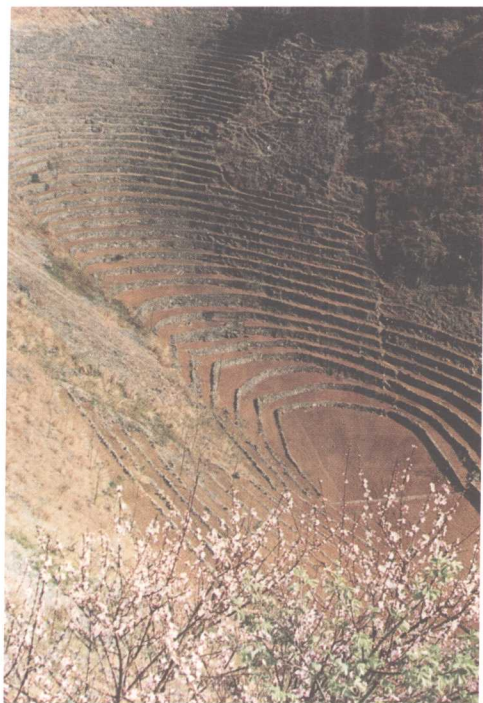
龙 卷 地