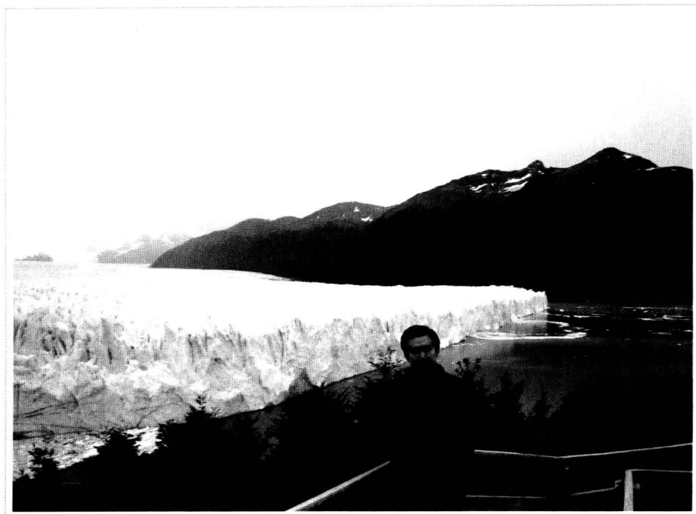
· 2007年11月，在阿根廷大冰川 ·