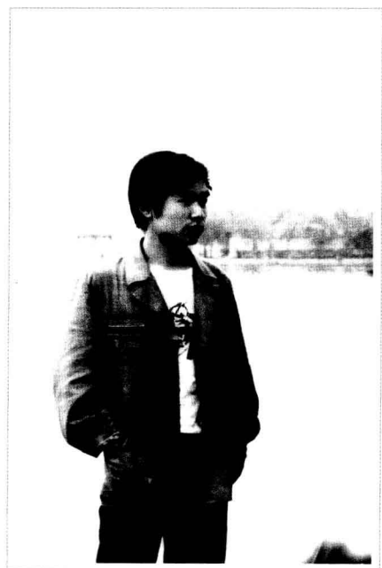
· 1983年秋，在济南大明湖