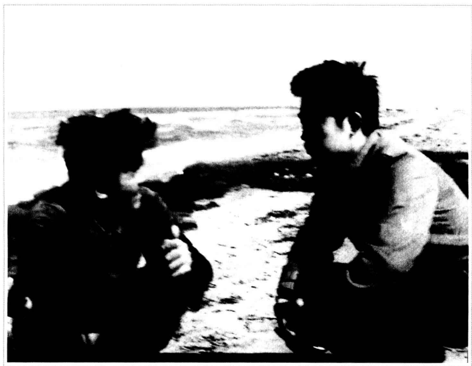
· 1981年在龙口海滨，与渔民交谈