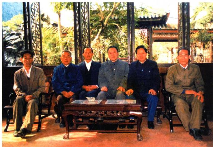
1985年11月，广东省检察院检察长肖扬（右二）到番禺考察工作。