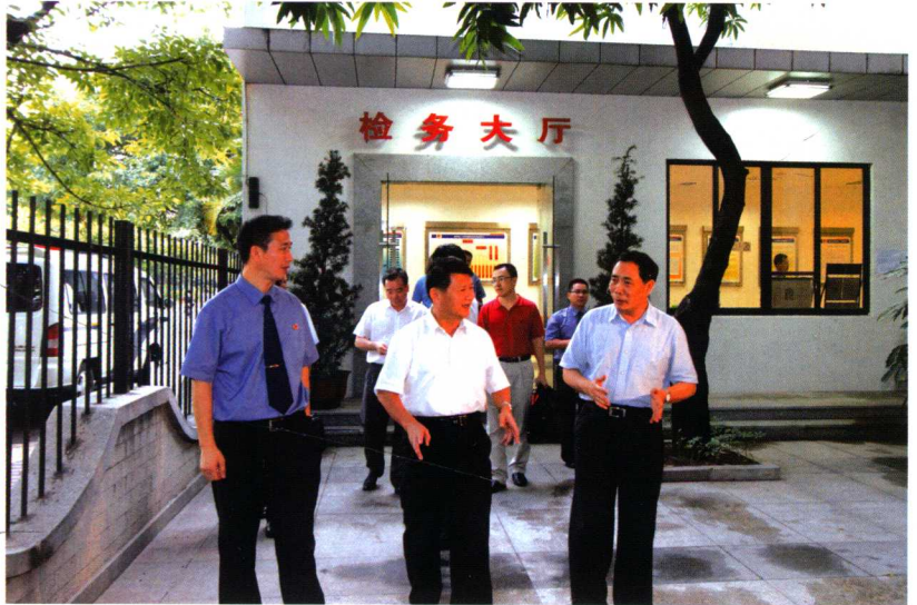
2010年8月，广东省检察院检察长郑红（中）到区检察院考察工作。