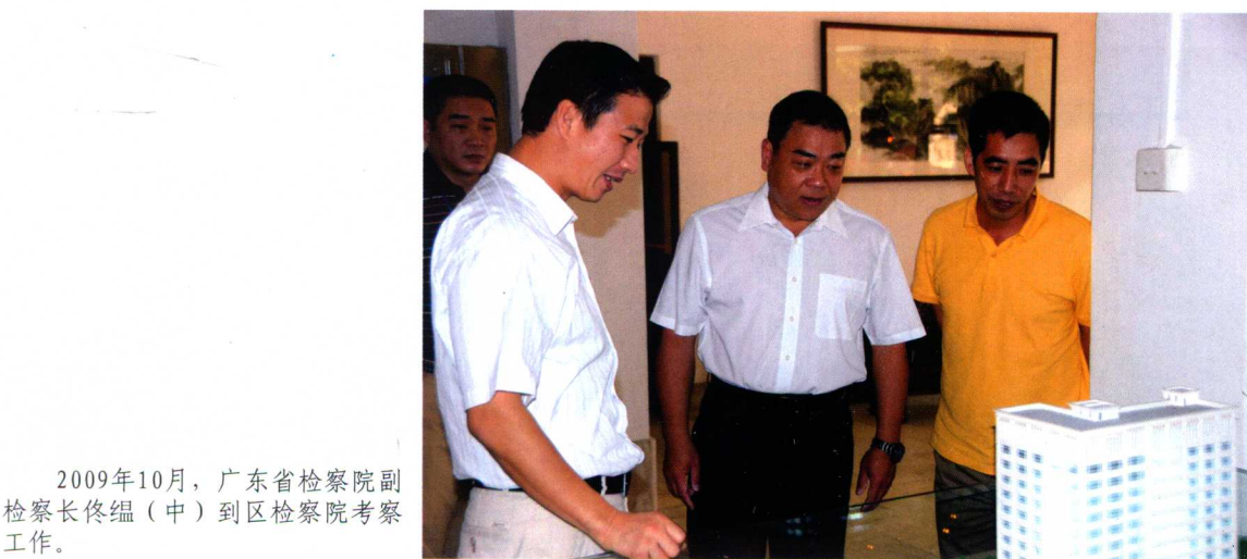
2009年10月，广东省检察院副 检察长佟缙（中）到区检察院考察 工作。