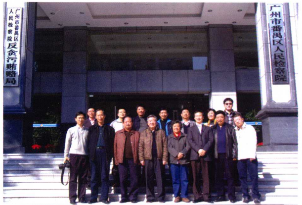
2010年12月，最高检原常务副检察长梁国庆（前排左四）到区检察院考察。