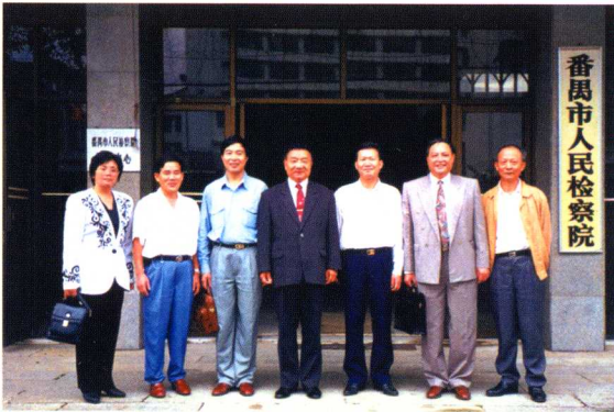
1995年10月，最高检副检察长王文元（中）到番禺市检察院考察工作，与番禺市检察院检察长黄建强（左三）、副检察长劳逢（右一）、副检察长郭锡森（左二）、副检察长林惠兰（左一）合照。