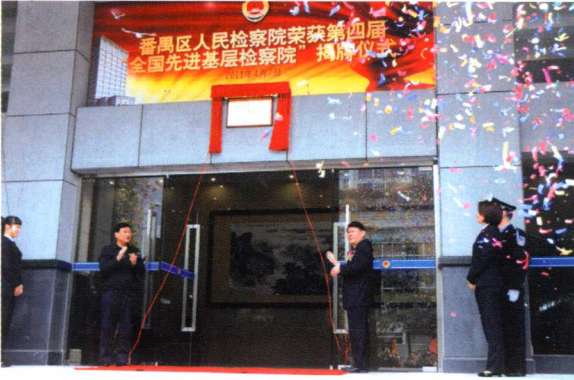
2011年4月，广东省检察院检察长郑红（右）和广州市委常委、政法委书记吴沙（左）为区检察院荣获第四届“全国先进基层检察院”揭牌。