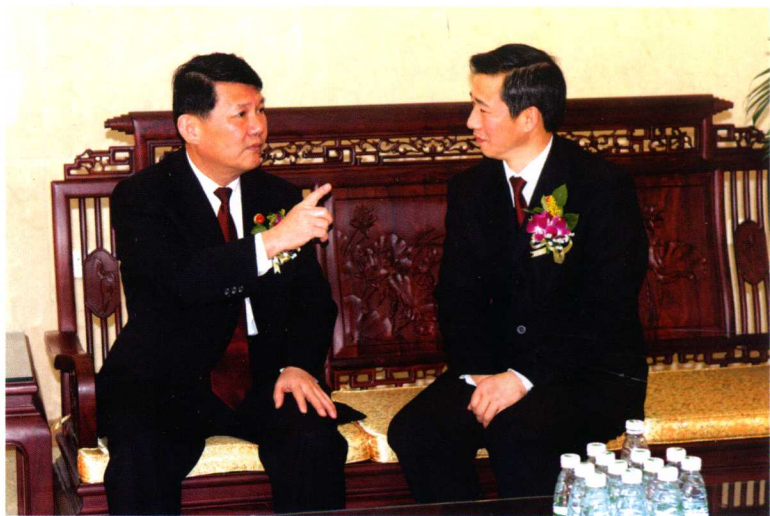
2011年4月，广东省检察院检察长郑红（左）到区检察院调研，指导业务建设。