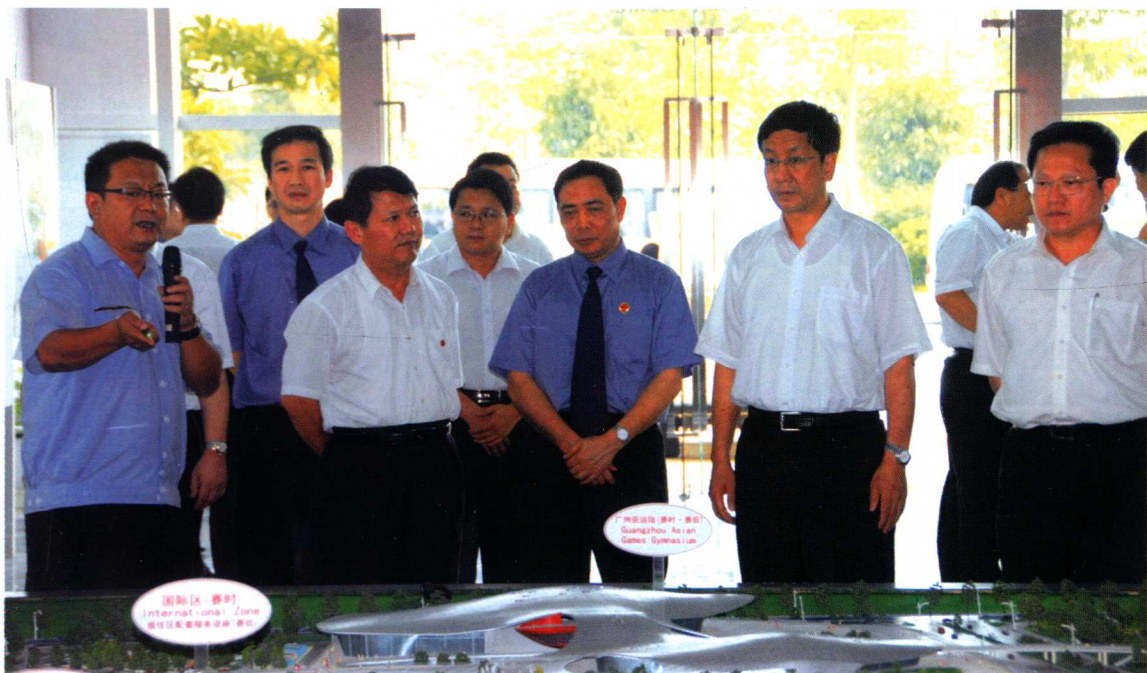
2010年9月，最高检察长曹建明（右二）在广州市委书记张广宁（右一）、广东省检察院检察长郑红（左二）、广州市检察院检察长王福成（右三）等省市领导的陪同下考察番禺亚运城。