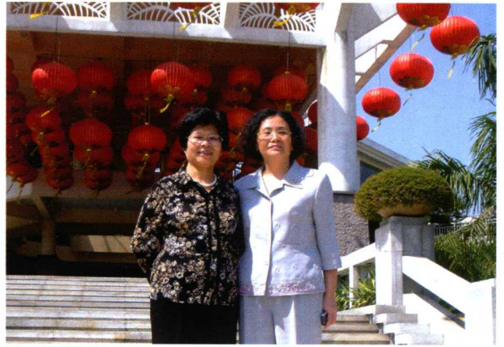
2006年4月，最高检副检察长胡克惠（左）在区检察院检察长林惠兰陪同下在番禺调研指导工作。