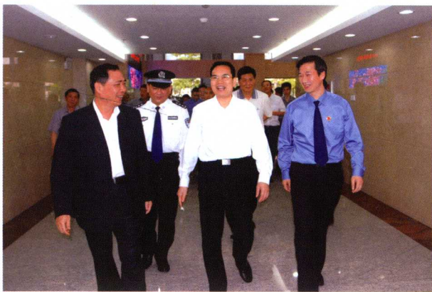
2011年4月，广东省委常委、政法委书记兼公安厅厅长梁伟发（中）考察区检察院。