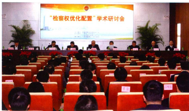
2010年12月，由中国法学会检察学研究会主办，广州市检察院和广州大学检察理论研究中心协办，区检察院承办的“检察权优化配置”学术研讨会在区检察院隆重召开。会议邀请了中国政法大学终身教授陈光中、四川大学法学院教授龙宗智等知名专家学者，最高检监所厅厅长袁其国、司改办主任王洪祥、理论研究所所长张智辉、广东省检察院常务副检察长佟缙、广州市检察院检察长王福成、副检察长廖荣辉等领导参加。