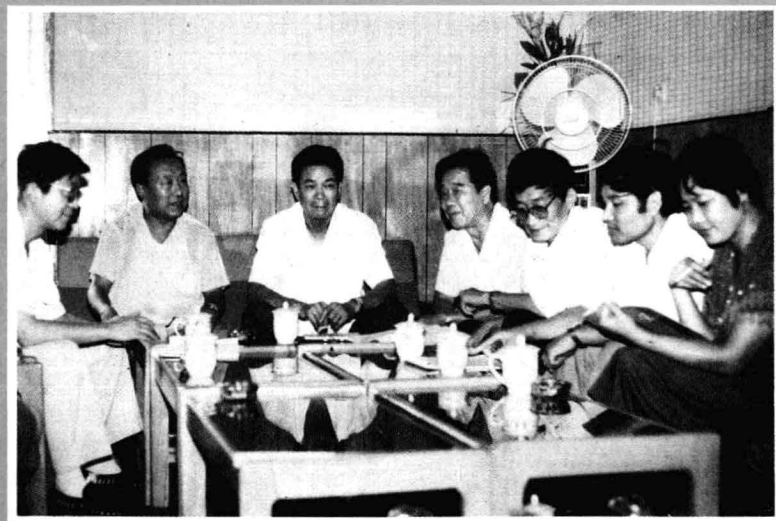
主编和部份作者在审稿