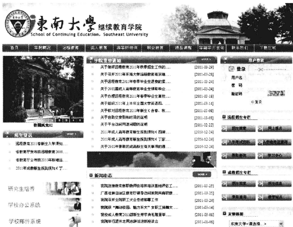
图 1 东南大学继续教育学院主页