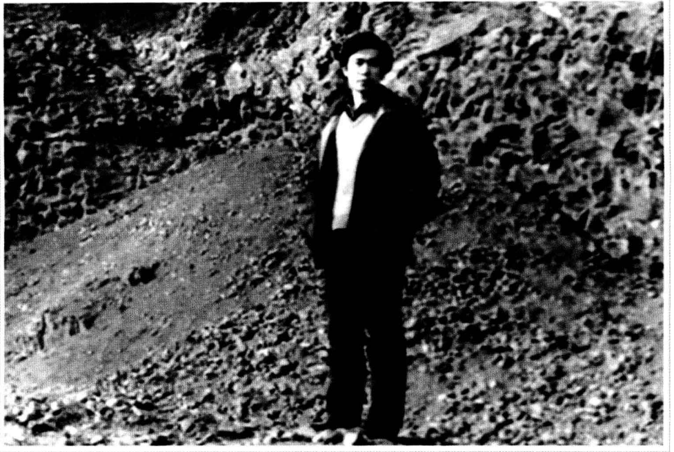
· 1983年，在胶东半岛采矿场 ·