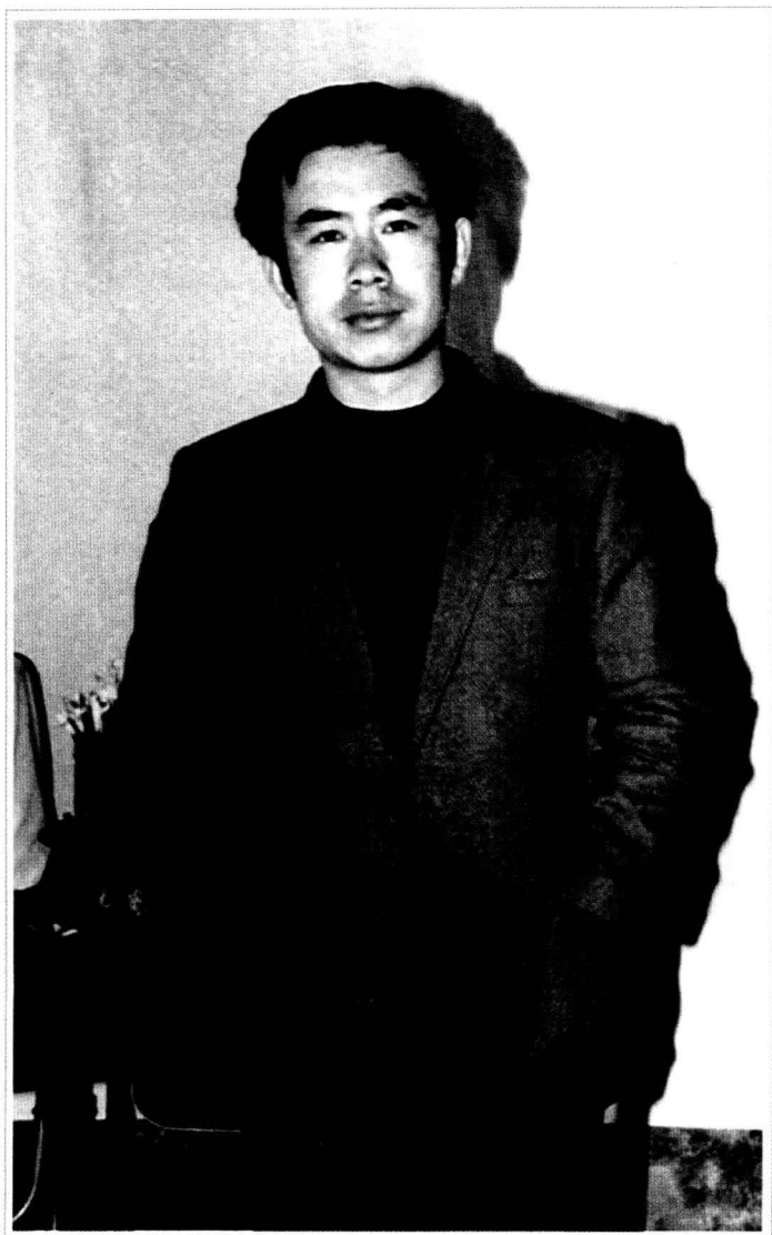
· 1991年，在胶东半岛写作小屋 ·