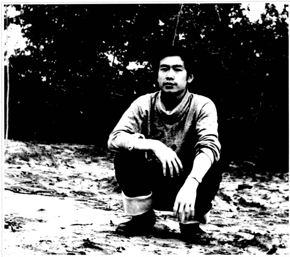
· 1983年，在龙口林场 ·